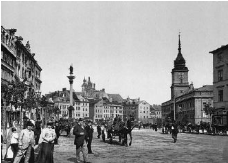
Рис. 3. Варшавская площадь, в глубине – один из иешиботов

С горечью вспоминает Мессинг свое более чем двухлетнее пребывание в иешиботе. Бесконечное заучивание все новых и новых молитв, скудное питание и короткий сон, явно недостаточные для растущего организма. Но, помня о наказе «посланца», он учился и благодаря острому уму и отличной памяти делал большие успехи. Не иначе как в скором времени пришлось бы ему надеть рясу раввина на радость родителям, если бы однажды.