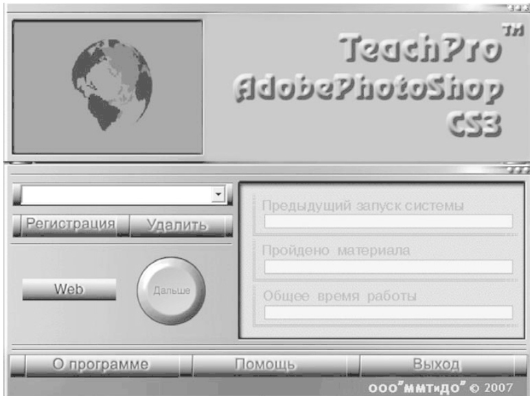
Рис. 02. Рабочее окно мультимедийного курса Adobe Photoshop CS3

Создайте свою учетную запись , чтобы следить за процессом обучения (объемом пройденного материала, затраченным временем на работу с каждым разделом). Для этого нажмите кнопку Регистрация и введите в появившейся для набора строке свое имя или фамилию.