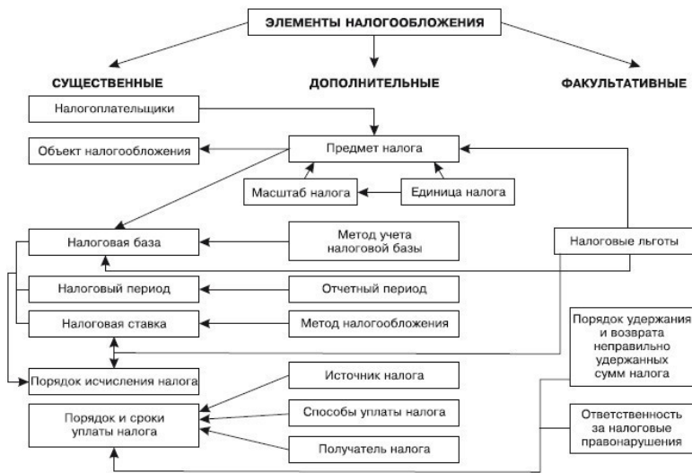
Рис. 3.1. Элементы налогообложения

ние, хотя налоги различны и число их велико. В зависимости от степени значимости и, соответственно, участия того или иного элемента в процедуре установления налога различают существенные, факультативные и дополнительные элементы налогообложения (рис. 3.1).