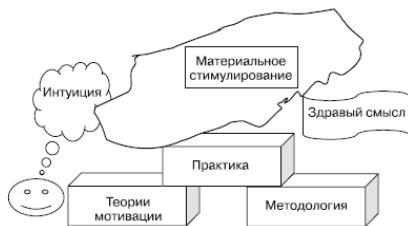
Рис. 1. Классический подход к проблеме мотивации

Очевидно, что при таком положении вещей любому руководителю выгоднее вообще не забивать голову «книжной чепухой», а применять наиболее простые способы обращения с персоналом – собственные эмоции и традиционную простейшую модель материального стимулирования (угроза увольнения, оклад плюс премия). «Классический» подход к мотивации приведен на рис. 1.