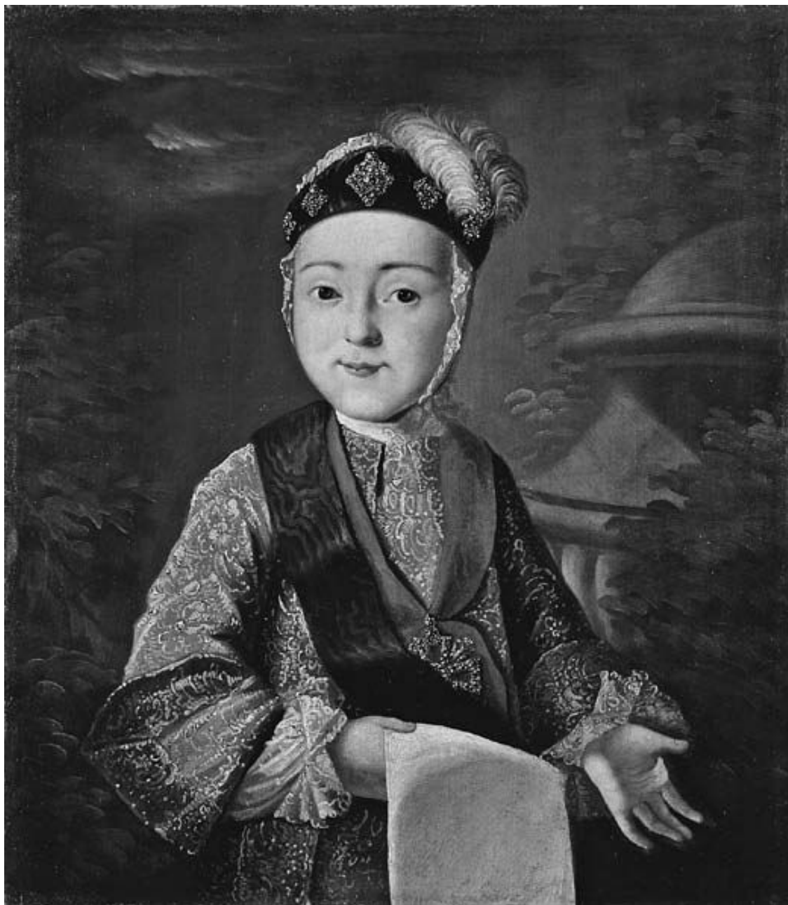
Неизвестный художник. Портрет Петра III Федоровича в детстве.

Прибыв к российскому двору в качестве невесты наследника престола, Екатерина быстро осознала, что занять высокое положение в России и получить корону можно только в случае, если она сделается истинно русской.