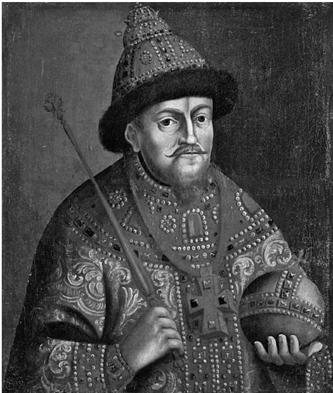
Неизвестный художник. Портрет царя Михаила Федоровича Романова.

Царский наследник также выбирал себе невесту только из числа своих православных подданных 39 , а царские дочери, не имея возможности найти себе равнородного жениха православного исповедания, чаще всего вынуждены были проводить свою юность в закрытых теремах, а в конце жизни принимать монашество. Прочим подданным государя на исповеди духовники также могли задать вопрос: «Не блудил ли ты с иноверкой или не был ли женат на ней?» 40 ,