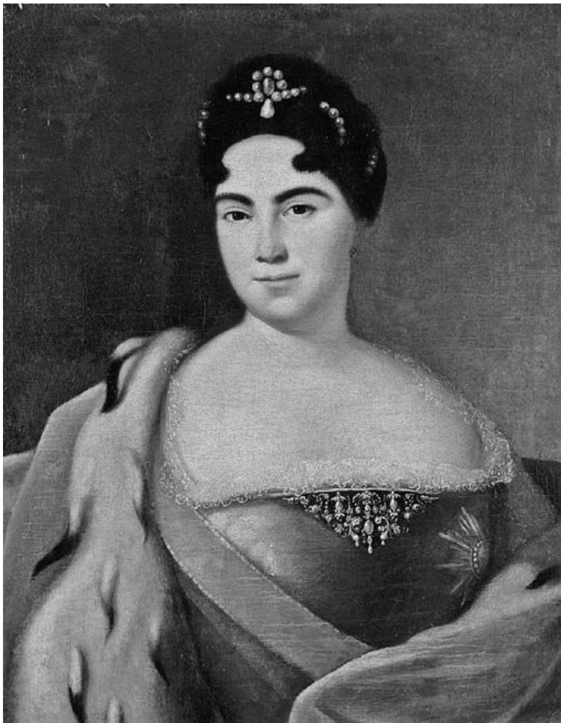
Неизвестный художник. Портрет императрицы Екатерины I.

Сложно определить, обучалась ли Марта в семье пастора богословию. По сведениям историков, ее учили грамоте и рукоделию и использовали только как служанку 67 . В любом случае о серьезном отношении к Церкви со стороны будущей российской императрицы в те годы ни в одном историческом источнике не указано.