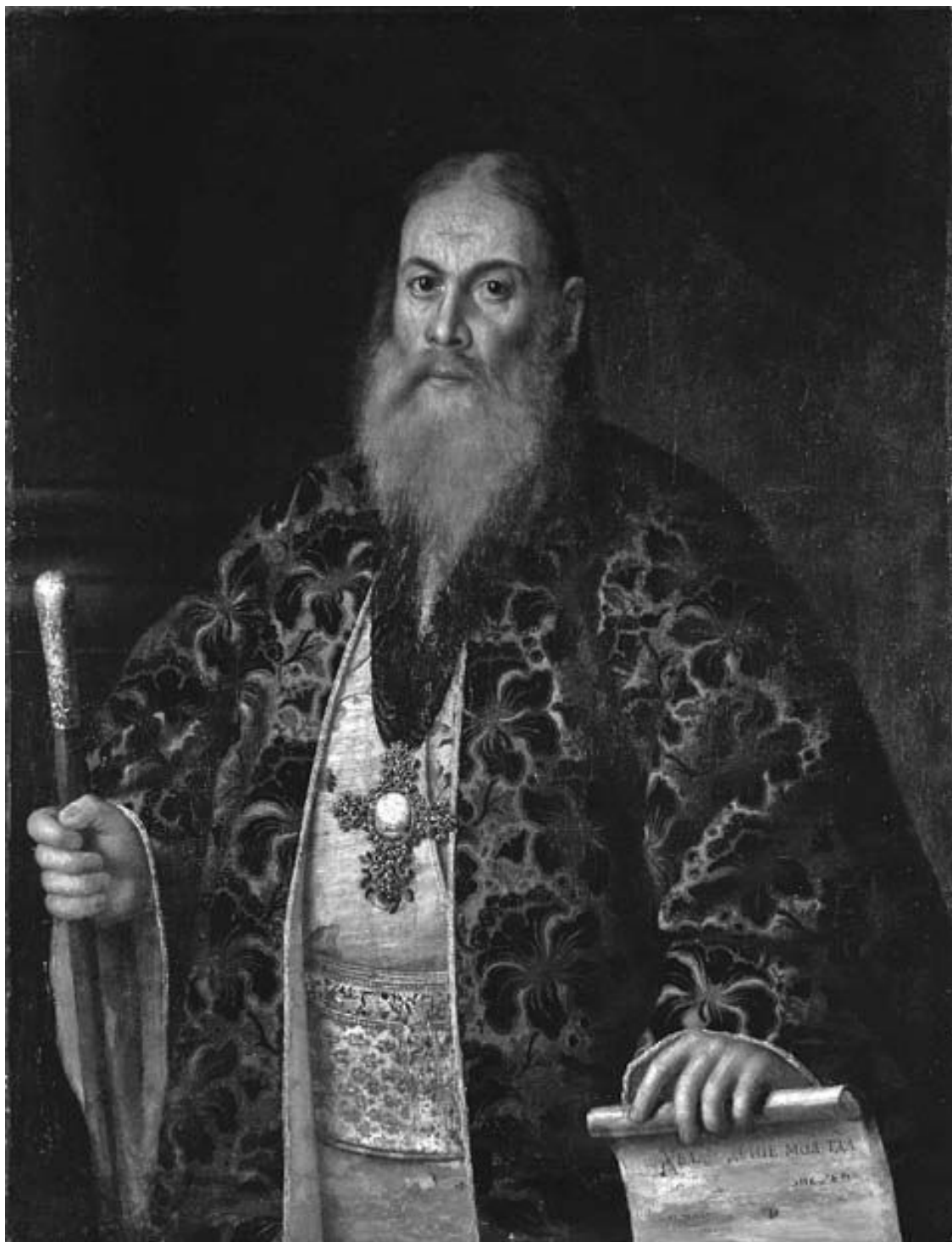
Антропов А. П. Портрет духовника Ф. Я. Дубянского.

Император Петр III Федорович, не успев короноваться, 28 июня 1762 г. был убит. Поданным было объявлено, что государь умер от геморроидальных колик. В тот же день архиепископ Дмитрий Сеченов в Казанском соборе провозгласил его жену великую княгиню Екатерину Алексеевну «самодержицей Всероссийской» 98 . Ее супруг удостоился лишь скромных похорон в усыпальнице Александро-Невской Лавры 99 .