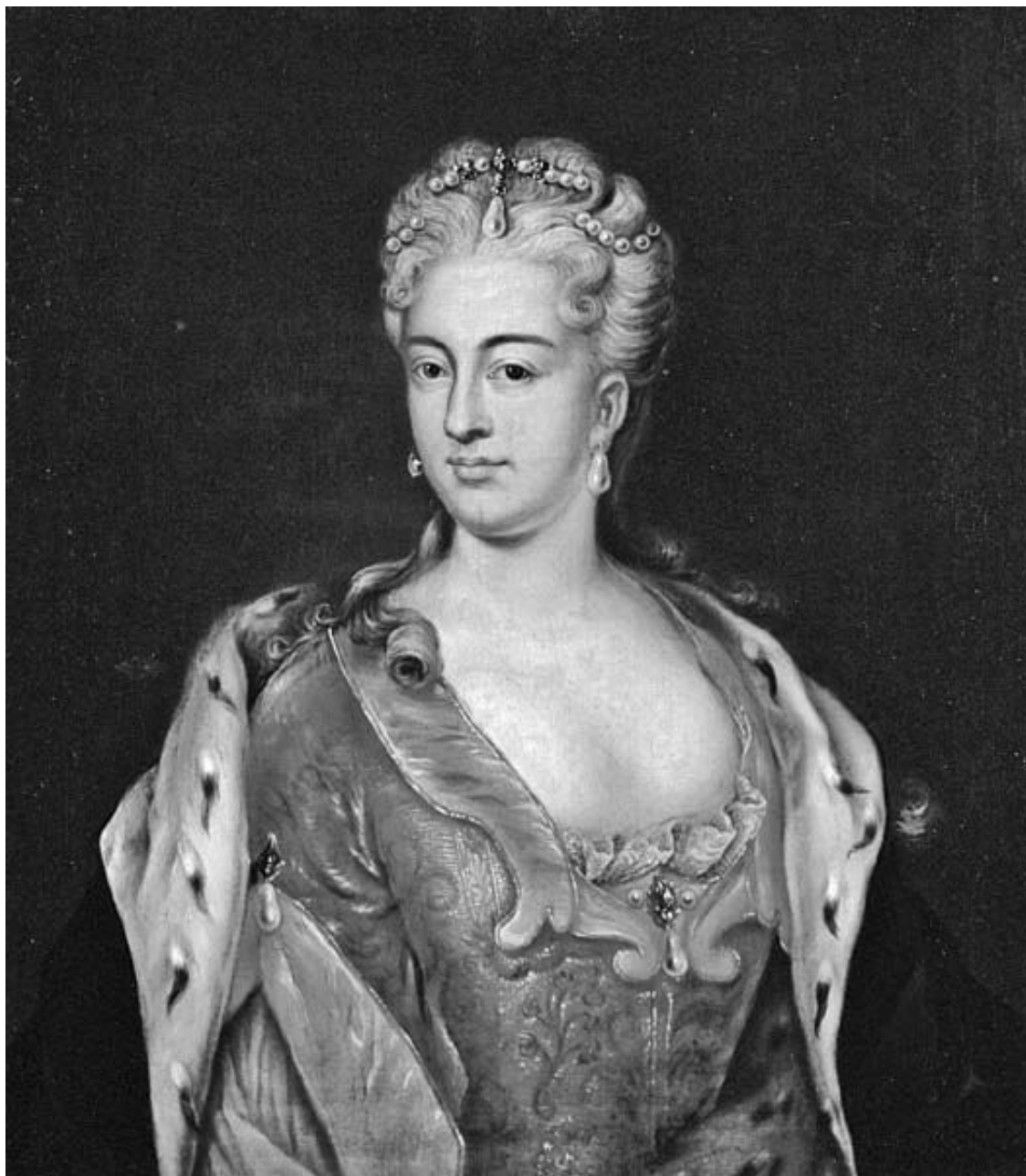
Неизвестный художник. Портрет принцессы Шарлотты Кристины Софии Брауншвейг-Вольфенбюттельской.

30 апреля 1711 г. был подписан брачный договор. При этом принцесса, не желая менять свое лютеранское вероисповедание, не только заручилась согласием Петра I сохранить веру, ей было также обещано иметь свою собственную церковь. Но все же дети, рожденные в этом браке, согласно договору, должны были воспитываться в православии 62 .