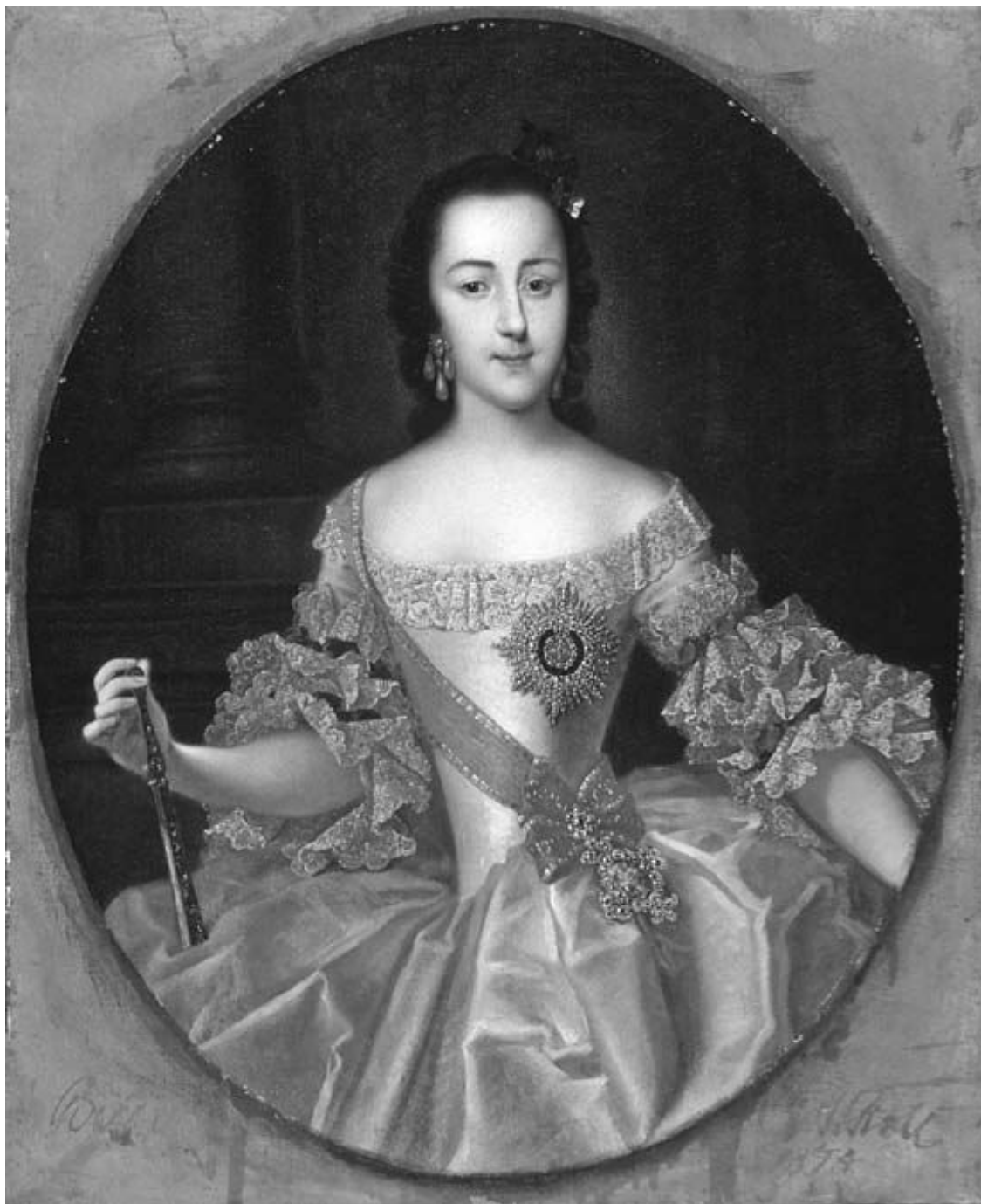
Гроот Г.-Х. Портрет великой княгини Екатерины Алексеевны в юности.

25 августа 1745 г. состоялось ее бракосочетание с наследником русского престола «по церемониальному образцу свадьбы французского дофина в Версале и польского, Августа И, в Дрездене» 105 .