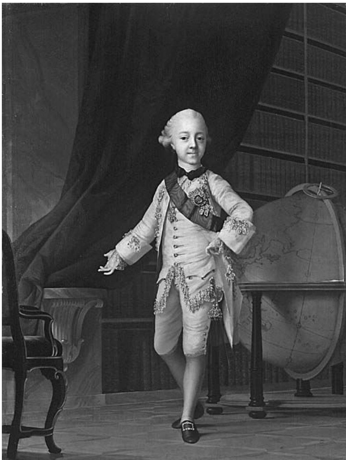
Портрет цесаревича Павла Петровича в Учебной комнате.