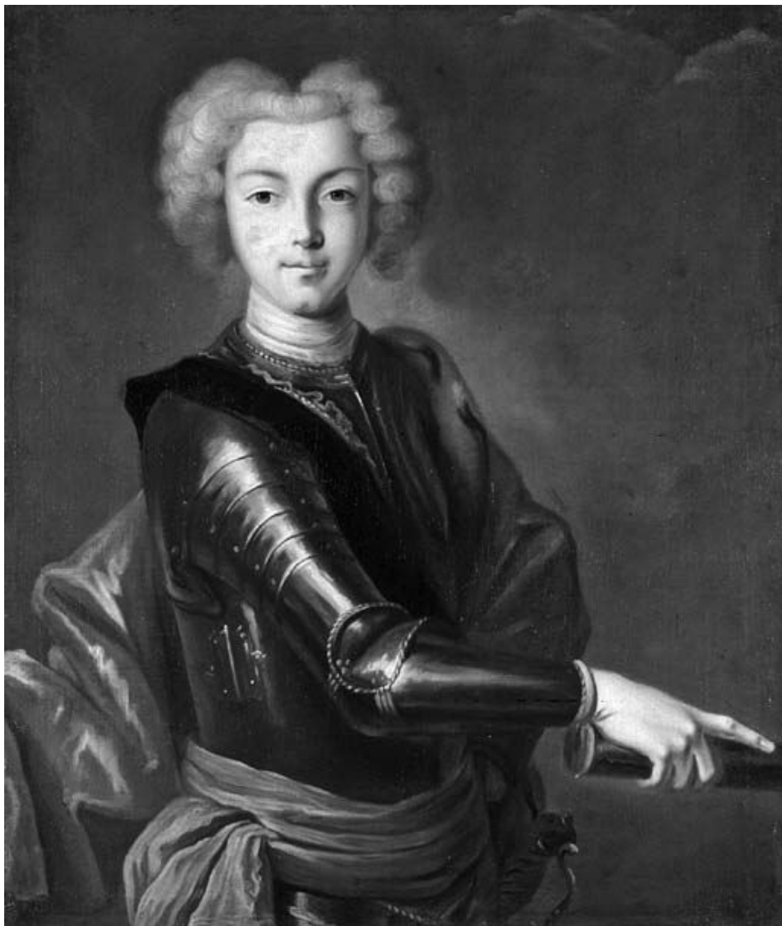
Неизвестный художник. Портрет императора Петра II.

По случаю этой свадьбы в Москве начались шумные многодневные праздники с обильными угощениями, увеселениями для простых людей, фейерверками и пушечной пальбой. Но горожане, не привыкшие к иноземным невестам своих монархов, все же роптали по поводу вероисповедания новобрачной 63 . К несчастью, брак не продлился долго: немецкая принцесса вскоре умерла при рождении второго ребенка, будущего российского императора Петра И, и серьезных для Романовых последствий ее лютеранское исповедание не имело.