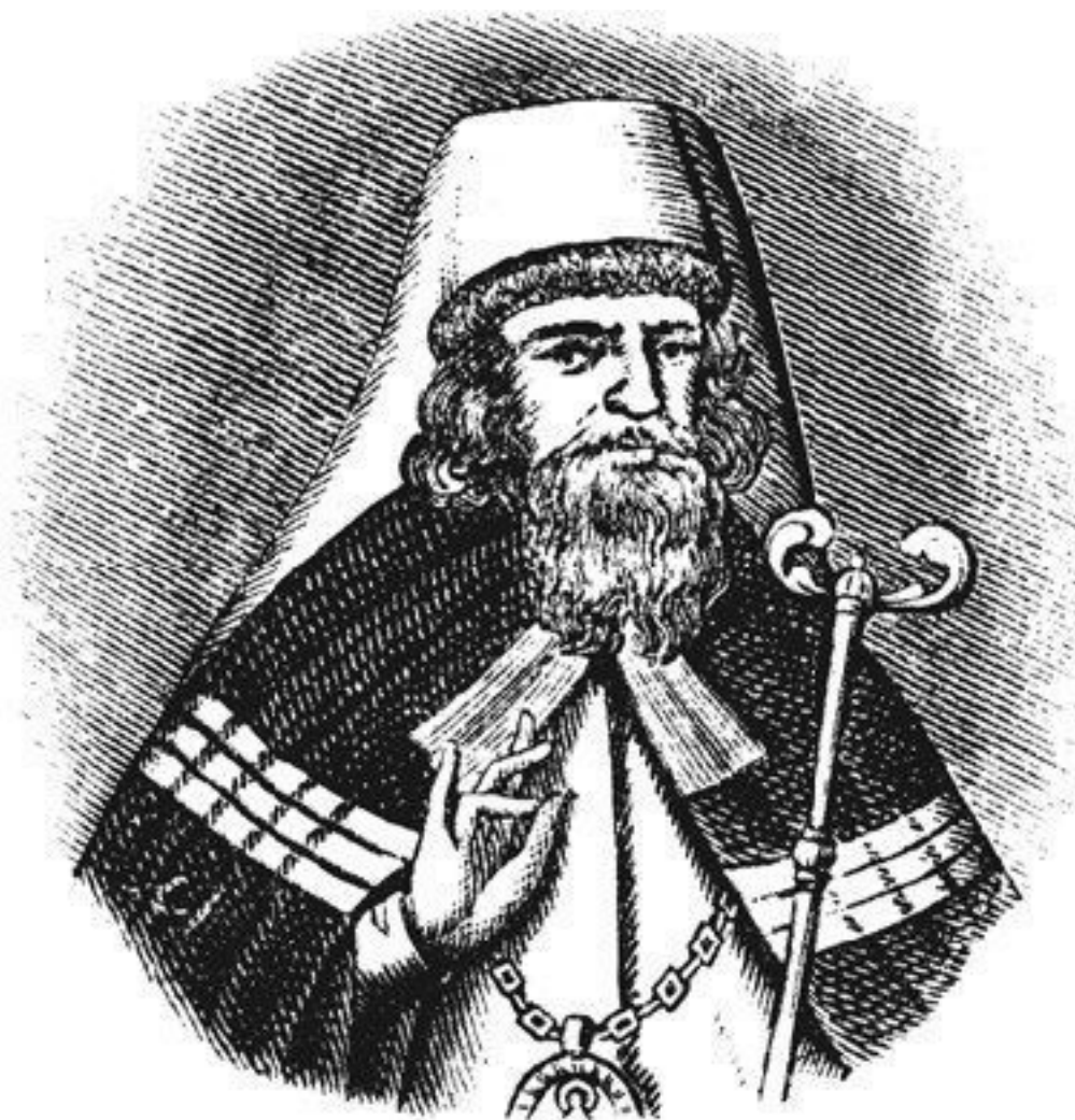
Неизвестный художник, с гравюры А. Ф. Зубова. Стефан Яворский, митрополит Рязанский и Муромский.

По словам одного из иностранных подданных, побывавших в России в ту пору, это сочинение «хотя и было напечатано на одном листе, однако по основательности своего содержания служит к чести и славе составителя» 72 .