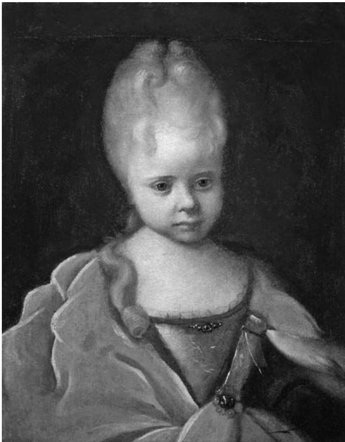
Никитин И. Н. Портрет Елизаветы Петровны ребенком.

Несмотря на то что Анна Иоанновна была на русском престоле единственной императрицей русского происхождения , все же с 1730 г. при дворе всем заправлял ее фаворит, регент и граф Священной Римской империи Эрнст Иоганн Бирон, который хотя и действовал всегда в интересах России, но воспринимался подданными империи как «немец».