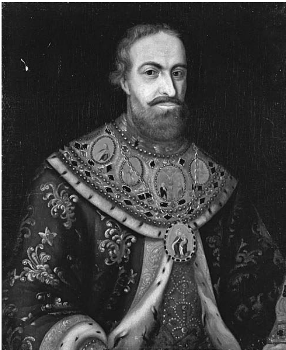
Неизвестный художник. Портрет патриарха Филарета Никитича Романова.

В общих чертах содержание этих исповедей не отличалось от таких же текстов, предназначенных для простых мирян, но некоторые различия все же имелись. В частности, в «Покаянных вопросах» подробно рассматривались не только нравственный облик властителя, его отношение к законам, поведение и высказывания, но и обстоятельства его прихода к власти. Это свидетельствовало о неустойчивом положении Романовых и желании при возможном повороте событий заранее определить критерии нравственной оценки будущего государя.