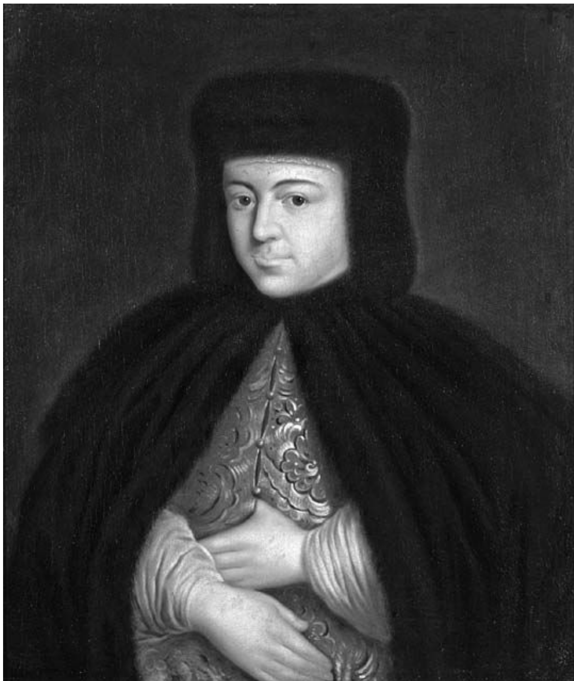
Неизвестный художник. Портрет царицы Натальи Кирилловны.

В 1702 г. государем был подписан манифест «О ввозе иностранцев в Россию с обещанием им свободы вероисповедания». Для царя, безразличного к тому, «крещен ли человек или обрезан», главными критериями являлись профессионализм и порядочность. На постоянное жительство стали прибывать иностранные специалисты различных профессий: горные и военные инженеры, врачи, ученые. Среди представителей высшего сословия вошло в моду и получило широкое развитие освоение западной культуры и наук. Иностранцев начинают привлекать также к обучению знати и государевых детей.