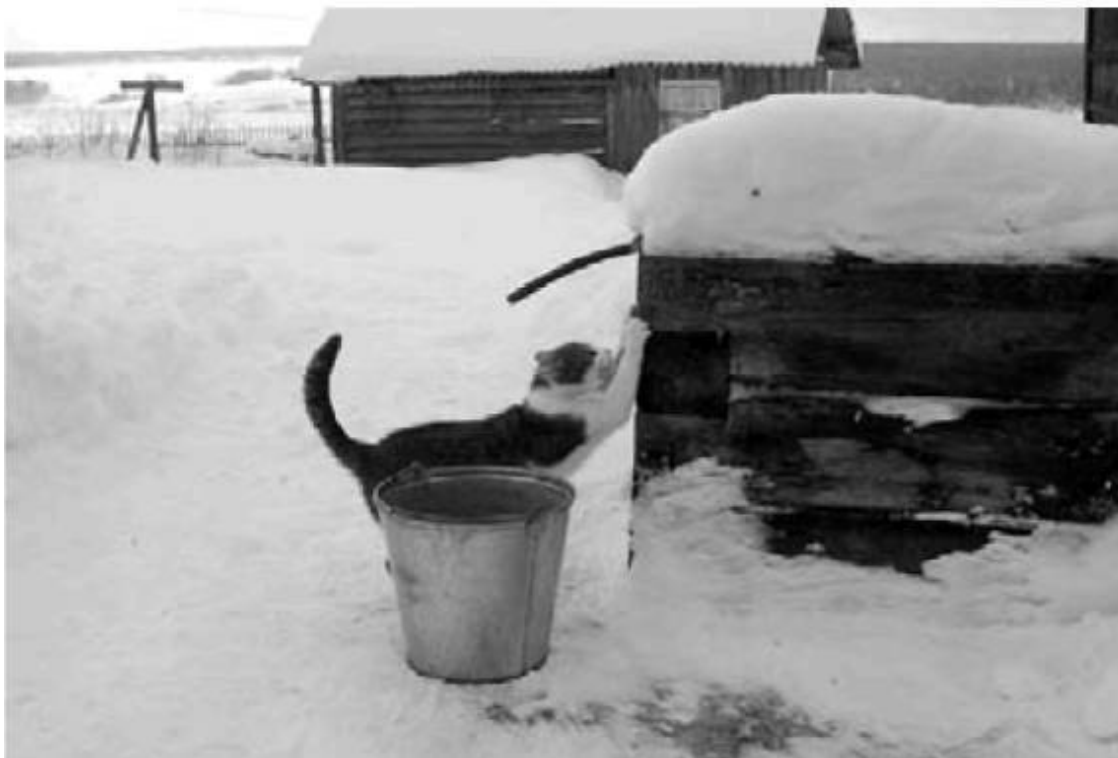
Архангельская область, деревня Пиринемь