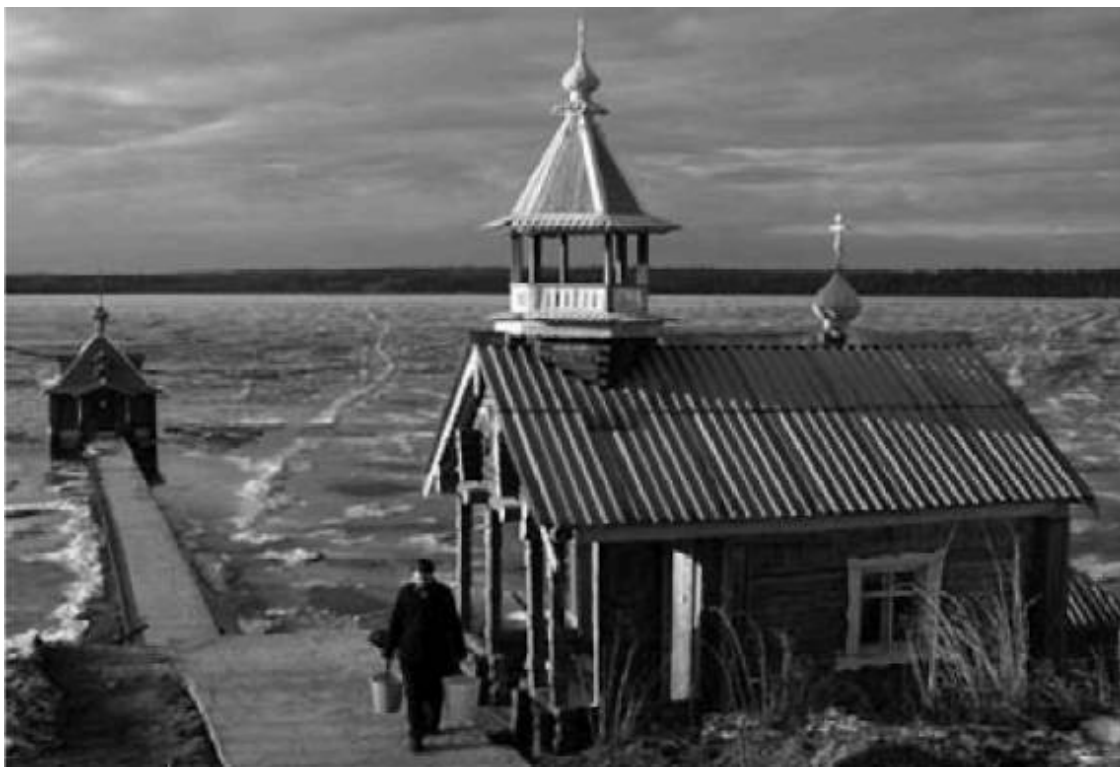
Карелия. Колодец Важеозерского мужского монастыря