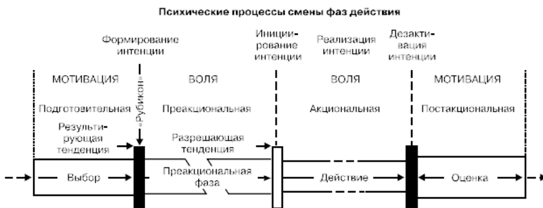
Рис. 2.1. Схематическое изображение четырех фаз действия (Gollwitzer, 1988)

Х. Хекхаузен (2003) в качестве волевого акта рассматривает только осуществление намерения, а фактически – инициирование интенции (побуждения) и самоконтроль за действием. Весь процесс осуществления действия он делит на четыре фазы: подготовительную, преакциональную, акциональную и постакциональную (рис. 2.1).