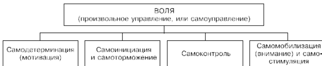
Рис. 2.2. Функциональная структура произвольного управления

Исходя из вышесказанного, произвольное управление, с моей точки зрения, включает в себя самодетерминацию, самоинициацию и самоторможение действий, самоконтроль (как за своими действиями, так и за своим состоянием, эмоциями), самомобилизацию и самостимуляцию . В соответствии с таким пониманием общая функциональная структура произвольного управления (воли в широком понимании) выглядит так (рис. 2.2).