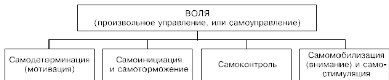
Рис. 2.2. Функциональная структура произвольного управления

моинициацию и самоторможение действий, самоконтроль (как за своими действиями, так и за своим состоянием, эмоциями), самомобилизацию и самостимуляцию. В соответствии с таким пониманием общая функциональная структура произвольного управления (воли в широком понимании) выглядит так (рис. 2.2).