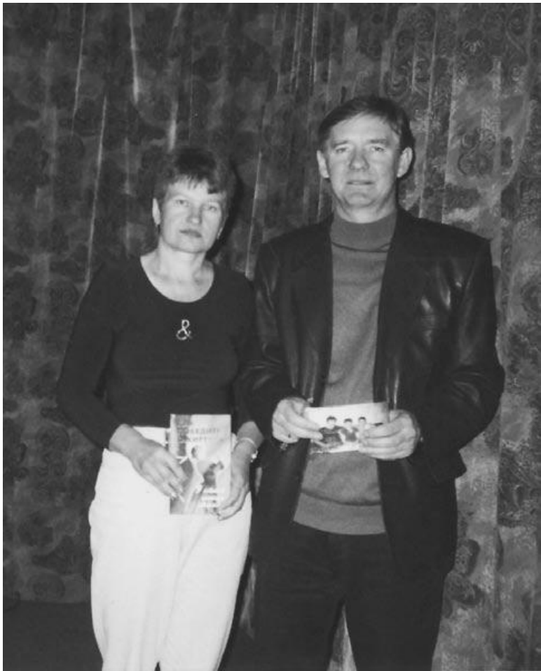
С пациенткой, похудевшей на 56 кг