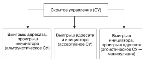
Рис. 1. Виды скрытого управления

Из сказанного ясно, что скрытое управление может производиться с различными целями и намерениями инициатора.