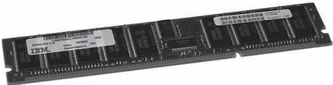
Рис. 0.2. Модуль оперативной памяти

Это электронное устройство, которое используется для хранения информации при работе компьютера (рис. 0.2). Как только он выключается, оперативка становится чистой, как Свет после отделения его от Тьмы. То есть в ней ничего не остается.