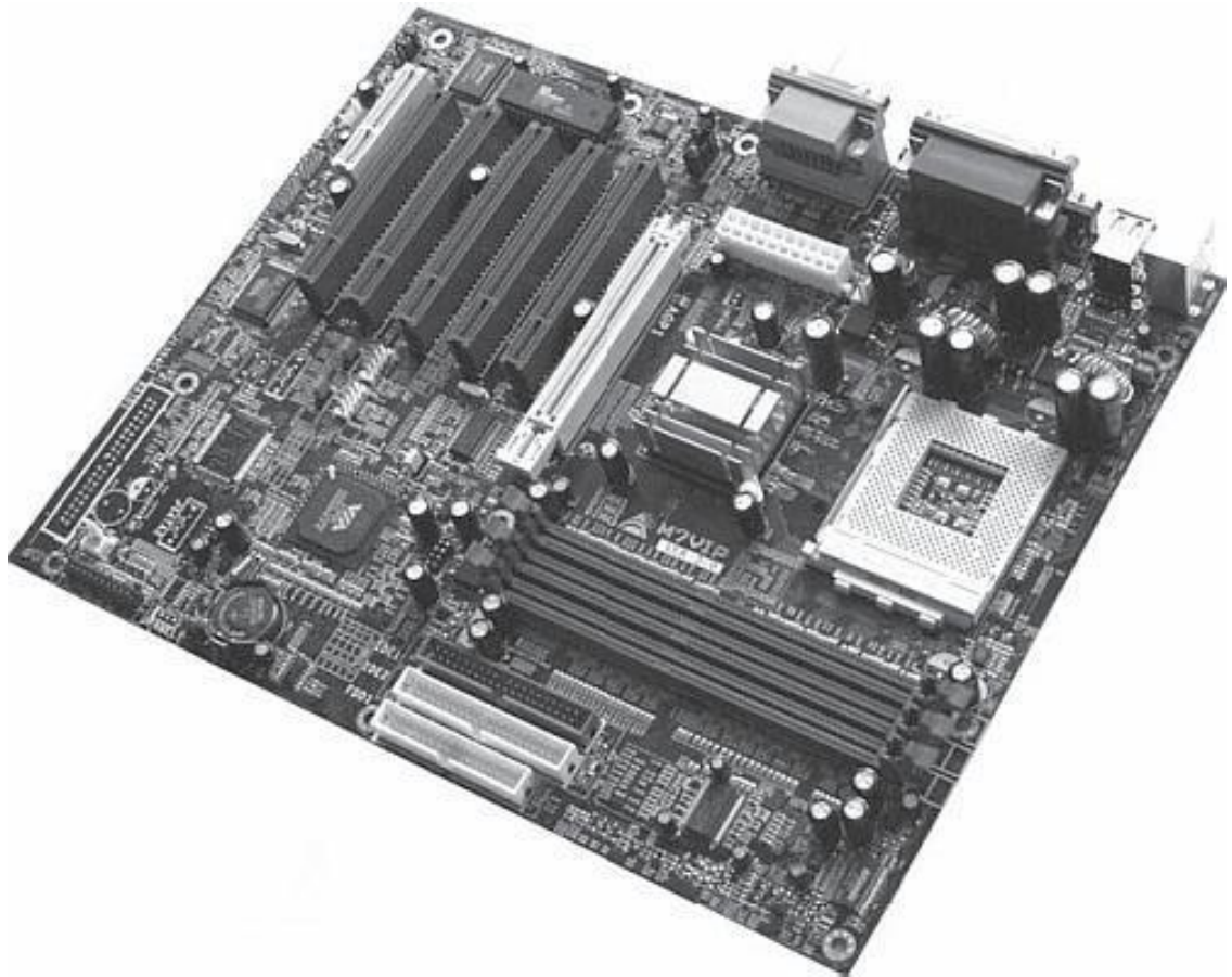
Рис. 0.3. Материнская плата

Вообще на плате должен быть «джентльменский набор» разъемов. Обычно он есть всегда, но на всякий случай можете развернуть системный блок (ящик, в котором все смонтировано) и проверить, все ли на месте (рис. 0.4).