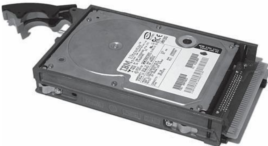
Рис. 0.5. Жесткий диск, или винчестер