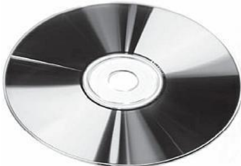
Рис. 0.6. Компакт-диск

Объем компакт-диска довольно велик – 650–800 Мбайт. Этого достаточно для записи фильма, правда, не очень высокого качества. Они гораздо надежнее дискет, хотя со временем тоже начинают сыпаться, то есть портиться. Сегодня распространены следующие виды компакт-дисков.