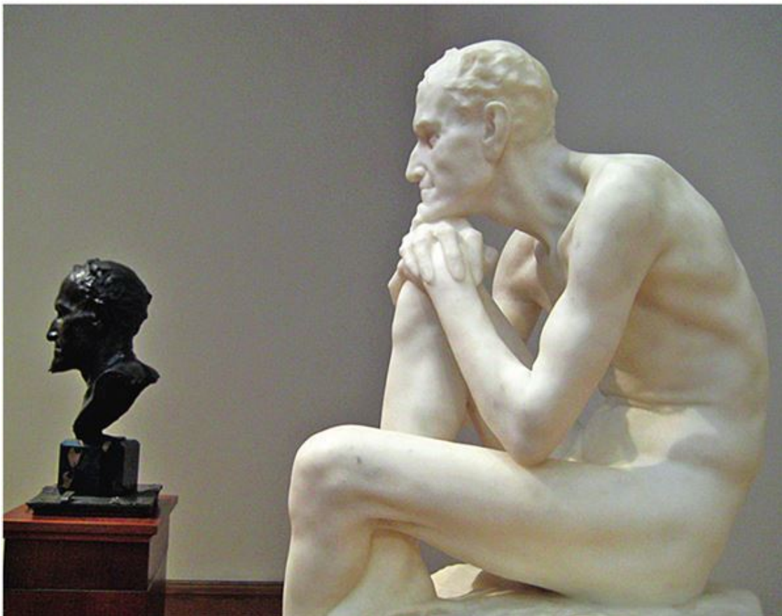
«Мефистофель». Скульптура Марка Антокольского

Ответственность за акцию с уничтожением барельефа Мефистофеля взяла на себя организация «Казачи Петербурга».