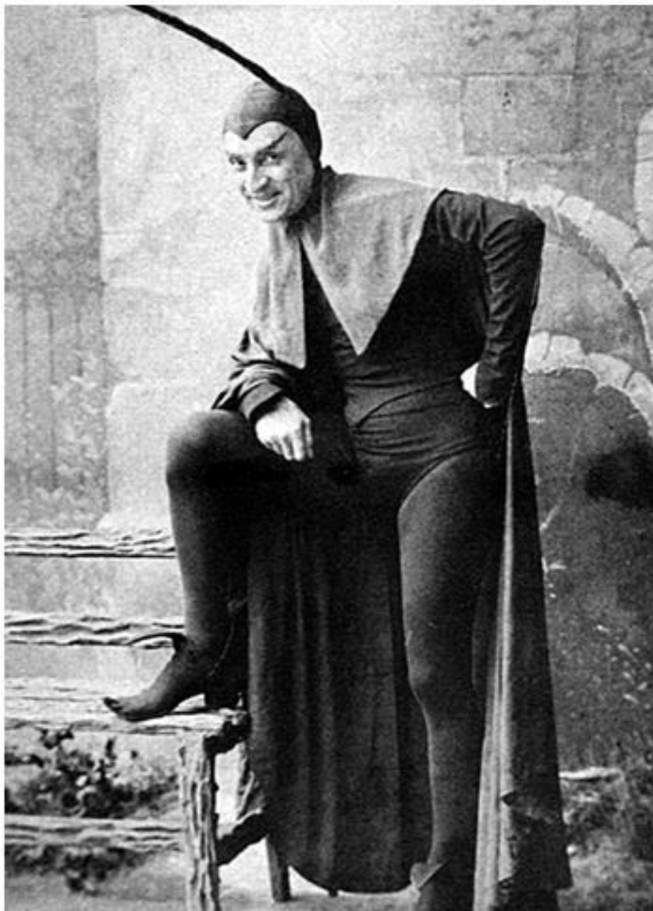
Американский певец конца XIX века Моррис В. Моррис в роли Мефистофеля

Самая известная ария Мефистофеля – куплеты: «Сатана там правит бал! Люди гибнут за металл 4 !», из оперы «Фауст» Шарля Гуно («Le veau d'or est toujours debout»).