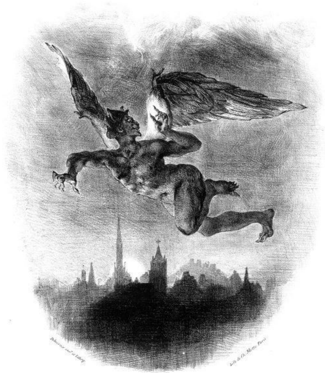
Зловещий Мефистофель пролетает над Виттенбергом в литографии Эжена Делакруа

Давайте подумаем. Всё в Природе создано Творцом.