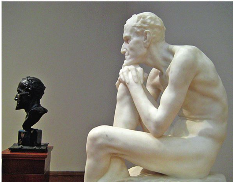
«Мепфистофель». Скульптура Марка Антокольского