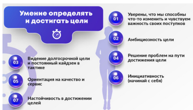
Рис. 4. Блок компетенций «Умение определять и достигать цели»

Одна из основных способностей бережливой личности – это умение ставить и достигать цели. Речь здесь идет не только об инструментальных (финансовые, бытовые), но и о терминальных целях, которые основываются на таких ценностях, как любовь, счастье, безопасность, удовольствие, внутренняя гармония, чувство завершенности, мудрость, свобода, дружба, уважение.