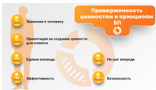
Рис. 3. Блок компетенций «Приверженность ценностям и принципам бережливого производства»

В 2014 году в госкорпорации «Росатом» были сформулированы единые корпоративные ценности [6], их шесть: «На шаг впереди», «Ответственность за результат», «Эффективность», «Единая команда», «Уважение» и «Безопасность».