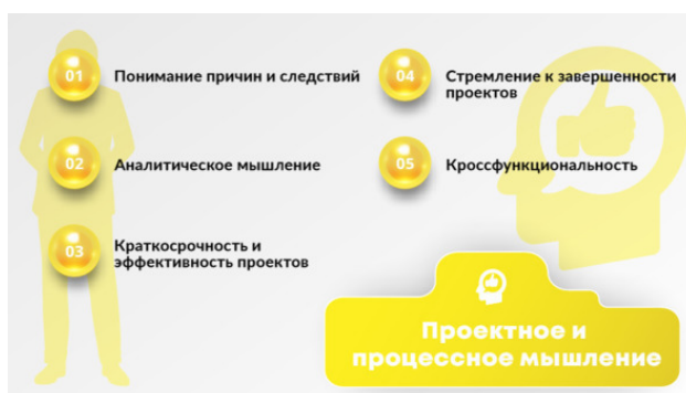
Рис. 5. Блок компетенций «Проектное и процессное мышление»

Мы уже говорили о важности культуры решения проблем и выявления коренных причин, в том числе о методе «5 почему». Здесь хотелось бы отметить, что важно научиться видеть, какая причина вызывает определенный результат, прогнозировать этот результат, научиться его предвидеть. В свою очередь, у каждого события или результата есть определенная причина или действие. Все в нашей жизни взаимосвязано, и ничего не происходит случайно. Все наши действия имеют свои последствия, и каждое конкретное действие приводит к конкретному результату в нашей жизни. Именно поэтому метод «5 почему» мы раскладываем на несколько первопричин, а также на следствия, которые могут произойти с нами в том случае, если мы не решим эту проблему.