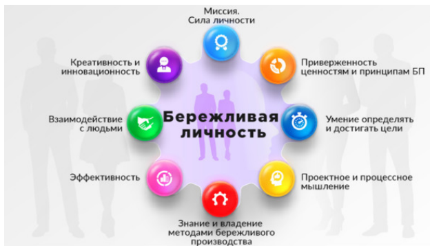
Рис. 1. Модель компетенций бережливой личности

мание уделено мировоззренческим и ценностным вопросам развития личности, особенностям мышления, а также конкретным навыкам в области методов и инструментов бережливого производства.