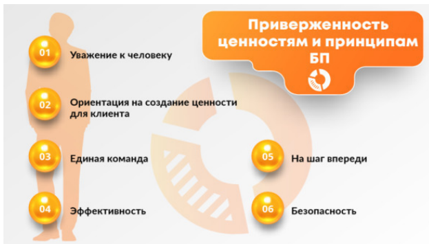
Рис. 3. Блок компетенций «Приверженность ценностям и принципам бережливого производства»