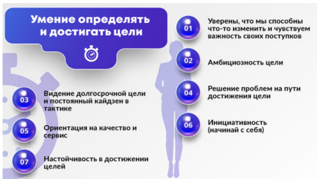
Рис. 4. Блок компетенций «Умение определять и достигать цели»