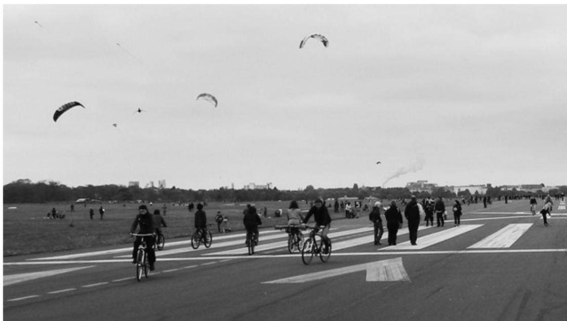
Ил. 1. Поле Темпельхоф

Первый пример обнаружился так: жители дома выставили на тротуар горшки, коробки и старые ванны – тем самым разбив небольшой садик и огород прямо напротив здания. Это, в общем-то, банальное действие запустило оживленную дискуссию обитателей района: имели ли жители право так делать и насколько эстетично то, что они сделали? Можно ли считать этот садик украшением городского ландшафта, которое доступно всякому прохожему, или же мы имеем дело с неправомерной приватизацией общественного пространства? Несколько обеспокоенных граждан отправили жалобы в местный отдел Ведомства по делам общественного порядка (Ordnungsamt), но, что интересно, арендодатель ни разу не пересылал жалобы своим квартиросъемщикам. Может, ему понравилась инициатива? Или же она была ему безразлична? Или, быть может, он надеялся, что инициативы арендаторов повысят ценность предлагаемого им жилья?