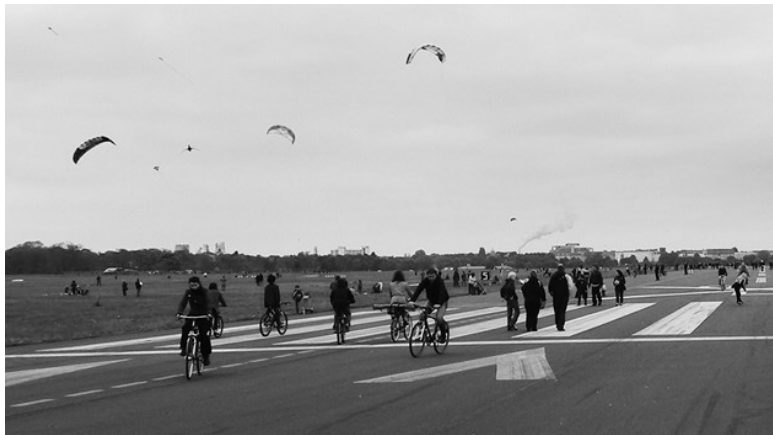
Ил. 1. Поле Темпельхоф

Поле Темпельхоф, на территории которого располагался одноименный городской аэропорт, можно считать примером значительно более масштабной совместности, захватывающей большую территорию и большее число пользователей (ил. 1). Аэропорт закрыли, но оставшееся пространство избежало масштабного девелопмента; случайно появившееся открытое место стало популярным среди горожан, которые осознали экологическую ценность высвобожденной территории и стали проводить там досуг: катались на велосипеде, занимались кайтсерфингом, устраивали пикники или же пестовали небольшие садики (urban gardening). Стоило берлинскому рынку недвижимости оправиться от удара 2008 года, как сенат выпустил план развития этой ча-