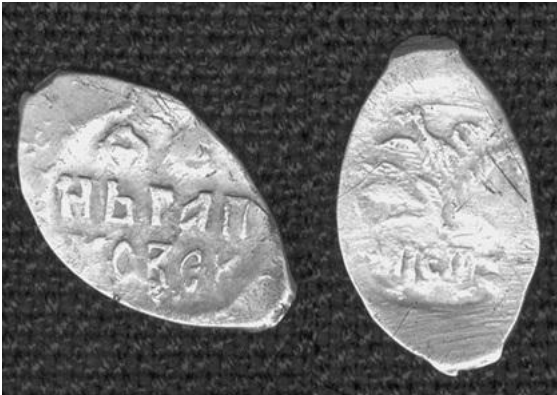
Псковская денга времен Василия III

выигрышных новых местах, а кто-то из них со временем даже перебрался в центральную часть города.