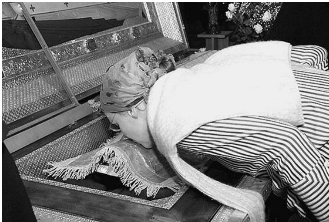
Поклонение святым мощам

вила последствия могут быть разными. В монастырях особенно благодатно творить молитвы (см. Приложение), задуматься о краткости земной жизни (в России сейчас средний возраст жизни у мужчин 58 лет, у женщин – 72 года), ее целях и результатах для каждого индивида и для его служения Отечеству, людям.