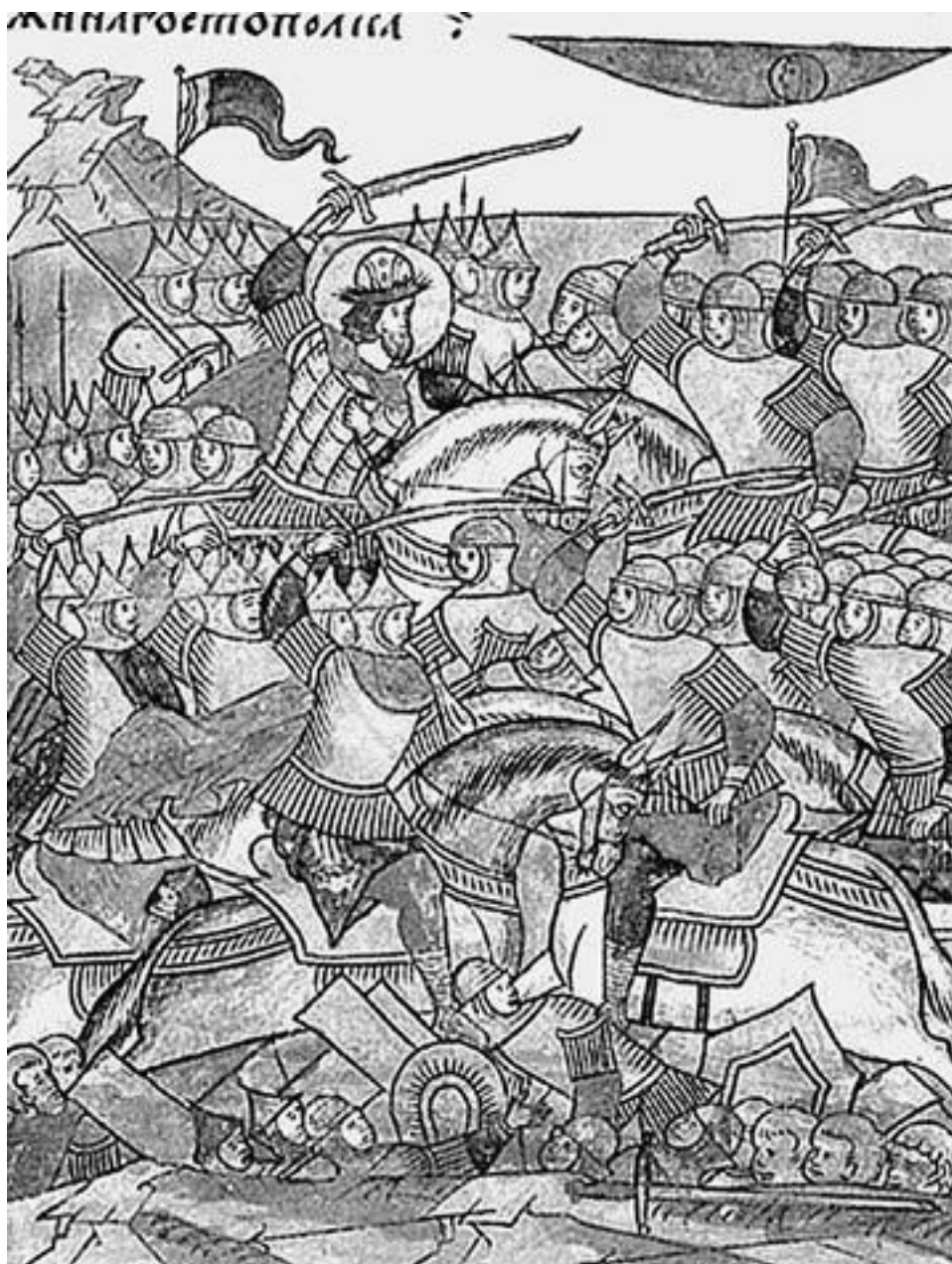
Ледовое побоище. Миниатюра XVI в.

дебная по отношению к славянским народам Руси идеология. Завоеватели стремились вытравить из памяти прибалтийских народов их давние добрые связи и взаимопомощь с Русью, усиленно напоминали, что прибалты были прежде всего данниками славян, что русские – в первую очередь, псковичи и новгородцы – не смогли или не захотели их защитить от немецких рыцарей, якобы непобедимых. Славянам пришлось в новых исторических реалиях XIII в. не столько помогать соседям, сколько отстаивать свою независимость. В 1242 г. русское войско во главе с князем Александром Ярославичем, позже названным Невским (см. с. 163), освободило Псков от немецких рыцарей, в том же году оно в битве на Чудском озере («Ледовое побоище») наголову разбило вражеское рыцарское войско. Нужно особо отметить высокий моральный дух русских ратников, обеспечивший им победу, ведь они защищали, отстаивали свои исторические владения. А немецкое ополчение, состоявшее из эстов и ливов, ненавидело своих поработителей, поэтому погибнуть во имя интересов немецких рыцарей не хотело.