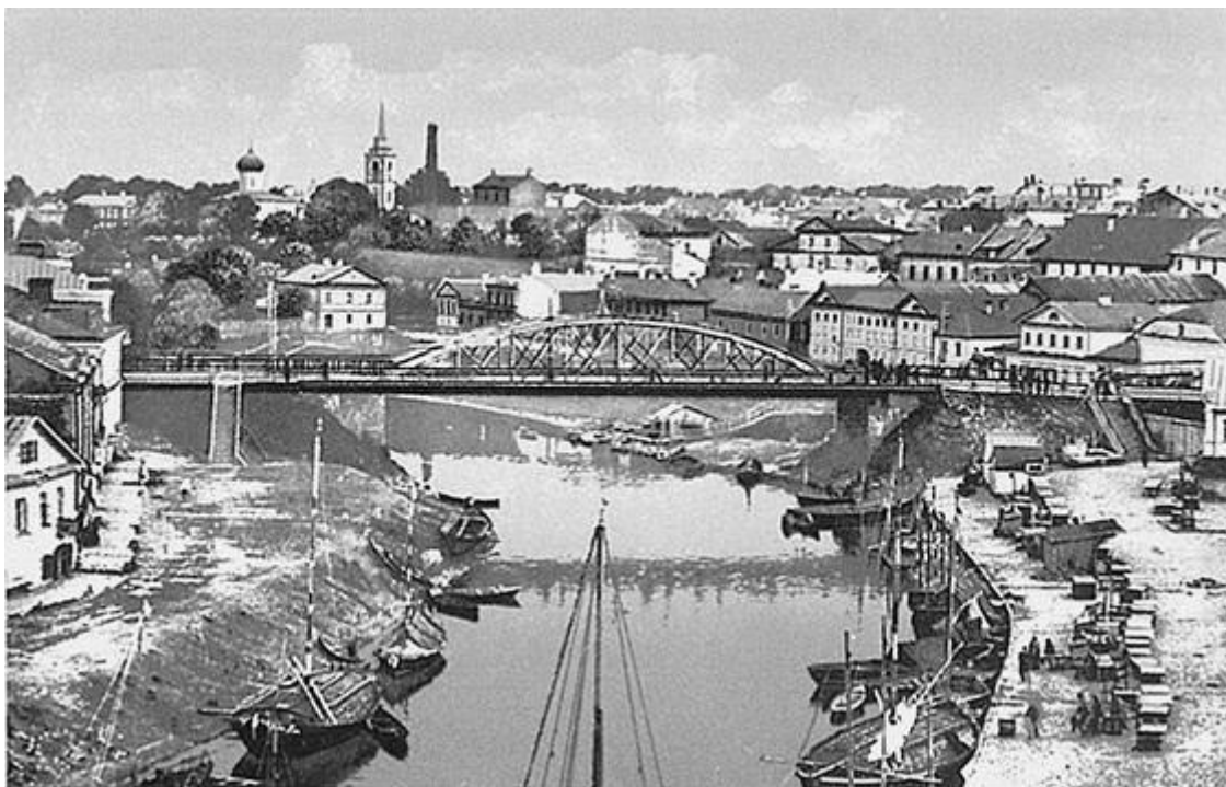
Псков в начале XX в.

С 1860-х гг. в Пскове развернуло свою работу тайное революционное общество «Земля и воля». В городе распространялось народническое движение, его центрами стали мужская и женская гимназии. В 1900 г., после окончания 3-летней сибирской ссылки, лидер большевиков-революционеров В.И. Ленин (Ульянов, 1870–1924) приехал и поселился в Пскове, где издавна жили высланные из Петербурга неблагонадежные для царского правительства лица. В Пскове Ленин продолжил свою антиправительственную деятельность, брал уроки немецкого языка у местного немца, ходил в библиотеку, много гулял, а потом уехал за границу. Большой подъем революционного движения в Пскове был в октябре 1905 г., когда всю Россию охватила Всеобщая политическая стачка.