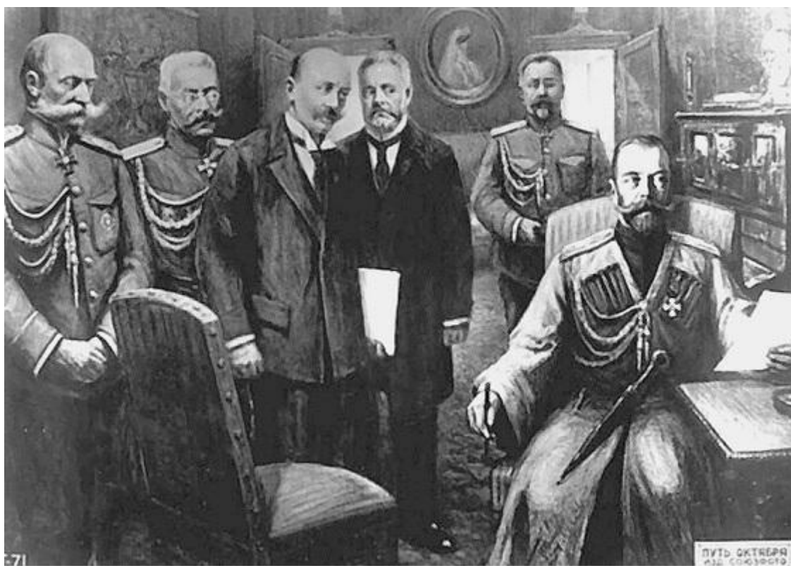
Отречение Николая II. Изображение на открытке 1917 г.

Земная жизнь императора Николая II (1868–1918, царствовал 1894–1917) принесла мало радости ему и его близким. Убийство членов императорской семьи, конец более чем трехвекового царствования Дома Романовых положили начало новых бед России. В 26 лет Николай II стал русским императором и был им более 23 лет. Выполнять роль первого лица в государстве ему было очень трудно из-за мягкости его характера и неподготовленности к этой ответственной роли. Главной трагической ошибкой в воспитании цесаревича Николая Александровича было то, что его не обучили искусству править государством. Он был совсем не приспособлен к делу правления огромной страной. Вероятно, его отец император Александр III (1845–1894, царствовал с 1881) намеревался, женив его, начать серьезно приучать к государственным делам, тем более что сам он был еще молод (но император внезапно умер в возрасте 49 лет).