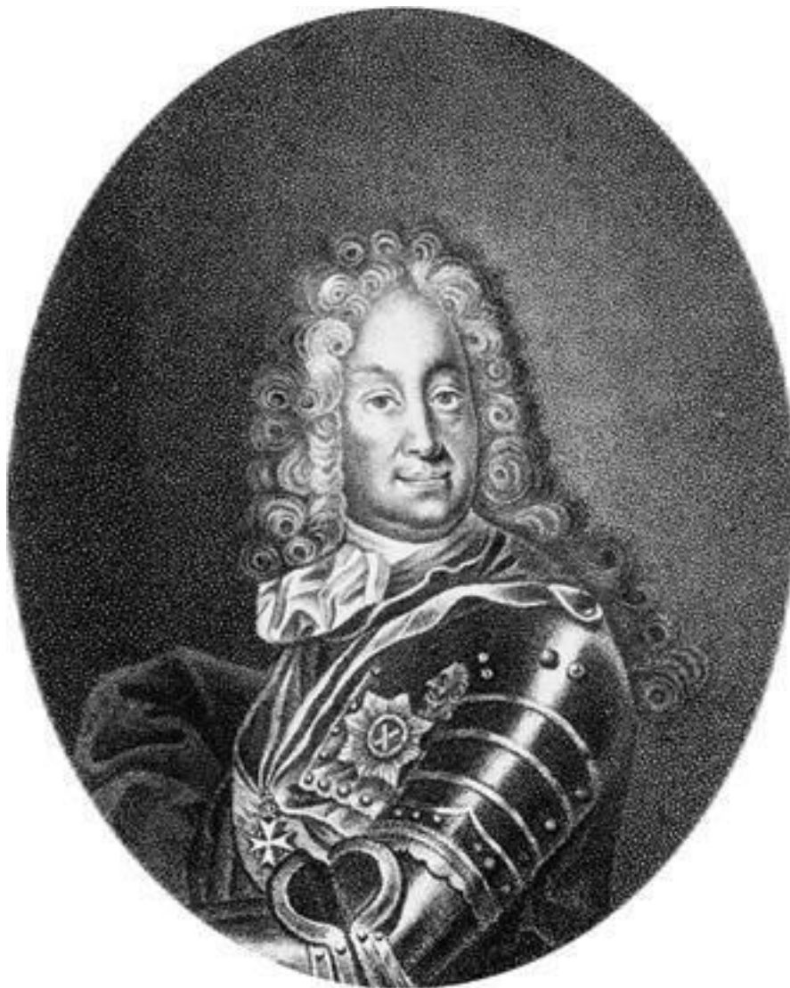
Б.П. Шереметев. Гравюра XIX в.

Шереметев не любил воевать с соотечественниками, тем более – с простым людом. Так, когда в 1706 г. в Астрахани вспыхнуло восстание и Петр I отправил его на подавление этого восстания, фельдмаршал был удручен. Шереметев пытался миром успокоить восставших, подолгу уговаривал их кончить смуту, а они не поддавались уговорам. Он стал раздражительным, вспыльчивым, грозным и жестоким. Он подчинился приказу царя, воевал с населением своей страны (хотя и не хотел этого делать), потратил много душевных и физических сил, навел порядок в Астрахани. Когда восстание было подавлено, Петр I щедро наградил Шереметева; он получил 2400 дворов, а сын его Михаил из комнатных стольников был произведен в полковники. Шереметев считал, что за участие в этом карательном деле он со временем получил кару Божию. После трудных переговоров с турками-османами в новой военной кампании пришлось оставить у них в Царьграде в качестве заложника сына Шереметева – полковника Михаила, способного молодого военачальника. М.Б. Шереметев в Россию не вернулся, его кончина (1714) стала непоправимым горем для Б.П. Шереметева, похоронившего его в Киеве, в Печерской обители.