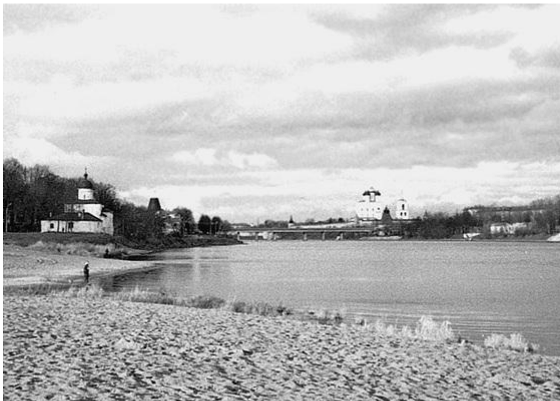
Вид на реку Великую от Мирожского монастыря в Пскове