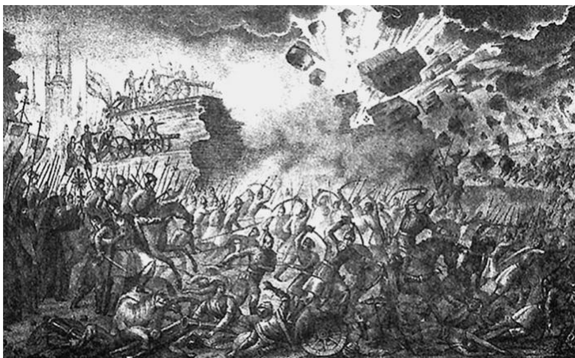
Осада Пскова войсками Стефана Батория. Гравюра Б. Чорикова. 1836 г.

Особенности геополитического положения Псковщины всегда существенно влияли на её собственную жизнь и развитие всей России. В XVI в., в том числе на Псковской земле, разворачивались события Ливонской войны, происходившей в период правления царя Ивана Грозного. В Ливонской войне (1558–1583) Россия выступала против Ливонского ордена, Швеции, Польши, Великого княжества Литовского (с 1569 г. – Речи Посполитой) за выход к Балтийскому морю. В этой войне на ее первом этапе (до 1561) был разгром Ливонского ордена; на втором этапе (до 1578) русские войска вели борьбу с переменным успехом, заняли в 1577 г. ряд прибалтийских крепостей; на третьем этапе (с 1579) русские войска вели оборонительные бои (в том числе героическая оборона Пскова в 1581–1582 гг. и др.) против армии польского короля Стефана Батория и шведских войск. Она завершилась подписанием невыгодных для России Ям-Запольского и Плюсского перемирий.