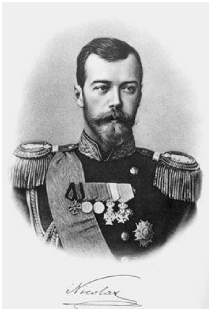
Император Николай II. Литография конца XIX в.