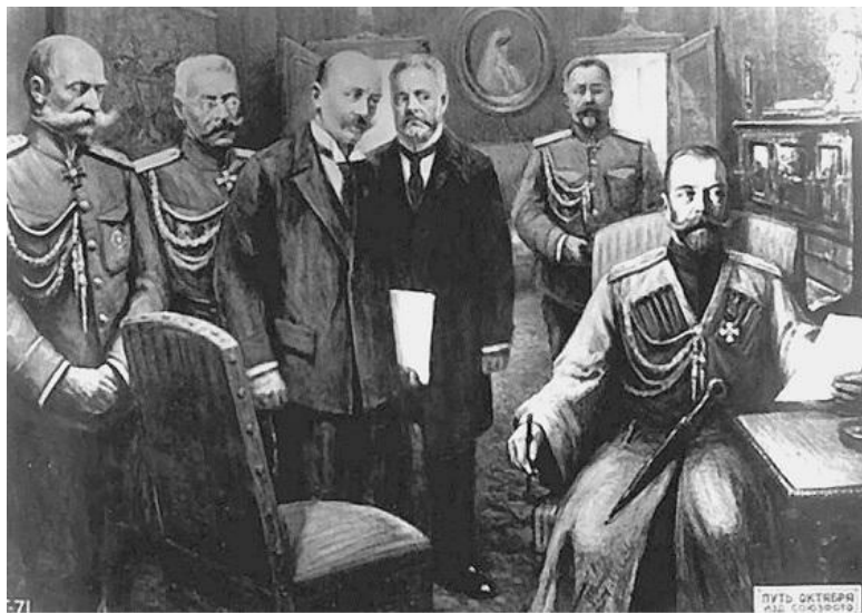
Отречение Николая II. Изображение на открытке 1917 г.

Цесаревич Николай просил умирающего отца императора Александра III позволить ему отречься от русского престола и жениться на Алисе Гессенской. Но Александр III требовал соблюдения закона о престолонаследии, поэтому Николай должен был принять трон, в утешение ему разрешил взять в жены Гессенскую принцессу Алису (ставшую в России после принятия православия Александрой Федоровной, 1872–1918). Меньше чем через месяц после похорон состоялось бракосочетание Николая II и Алисы Гессенской – тоже плохой знак. Решая вопрос о допустимости этого брака, не