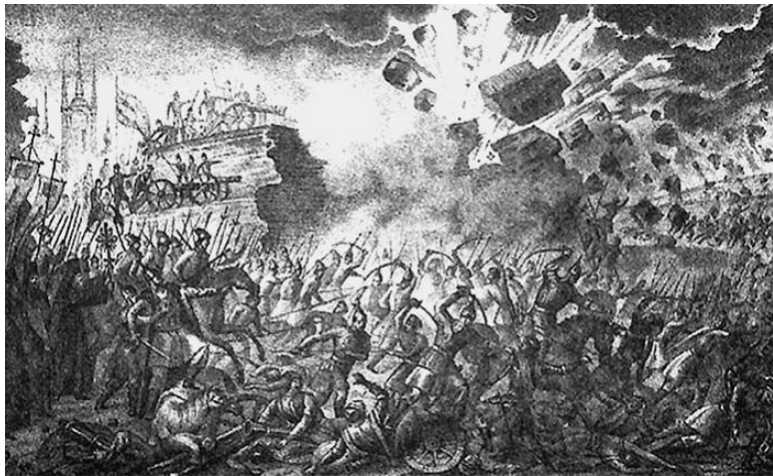
Осада Пскова войсками Стефана Батория. Гравюра Б. Чорикова. 1836 г.

Иван Грозный (Иван IV Васильевич, 1530–1584, великий князь с 1633, первый русский царь с 1547) был противоречивой и сложной личностью, что определялось временем, историческими обстоятельствами. Он с конца 40-х гг. XVI в. правил с участием Избранной рады, при нем начался созыв Земских соборов, составлен Судебник (1550), проведены реформы управления и суда и др., были покорены Казанское (1552) и Астраханские (1556) ханства, велась Ливонская война (1558–1583) за выход к Балтийскому морю, началось присоединение Сибири (1565), внутренняя политика Ивана Грозного сопровождалась массовыми опалами и казнями,