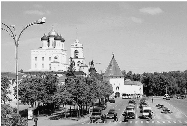
В центре Пскова

том, культурно-эрудиционного развития в связи с платностью услуг. Реструктуризация экономики Пскова в рыночных условиях принесла обострение проблемы трудоустройства, избыток специалистов традиционных профессий (тем более в условиях закрытия или падения объема производства на предприятиях) и нехватку кадров в относительно новых сферах занятости. В дальнейшем машиностроение, туристический бизнес, а также финансово-кредитная деятельность упрочат свои позиции в экономике Пскова. Культурологическое значение города, его историко-культурные ценности будут цениться все выше и выше.