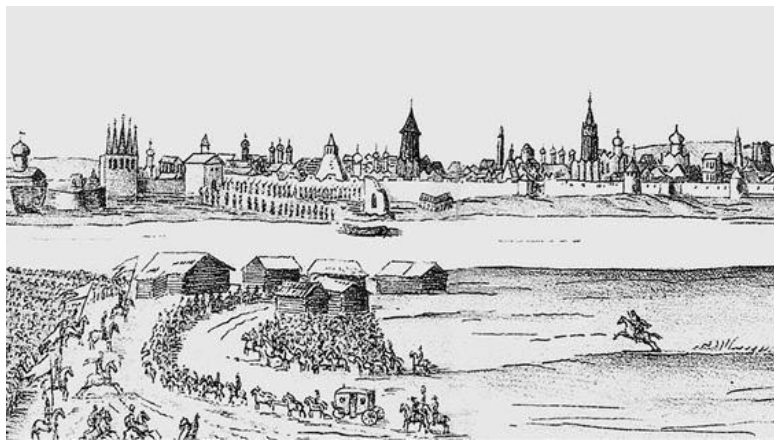
Вид Пскова в XVII в.

тервенции начала XVII в. Псковичи тогда в очередной раз защитили интересы и отстаивали свободу всего Русского государства.