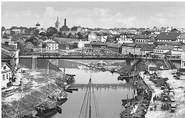
Псков в начале XX в.

Революционные настроения псковичей усилились в период 1-й мировой войны (1914–1918). В конце 1916 г. фронт от Пскова находился в 300 км. В Пскове был размещен штаб Северного фронта. Здесь находилось управление главного начальника снабжения с большим количеством отделов, госпитали, другие армейские учреждения, нужные для фронта мастерские, полевые хлебопекарни, обозное имущество и т. п. В Пскове формировались роты и полки, в состав которых входили выписавшиеся из госпиталей солдаты. В начале 1917 г. псковский гарнизон насчитывал около 30 тыс. солдат. В дни Февральской буржуазной революции 1917 г. Псков