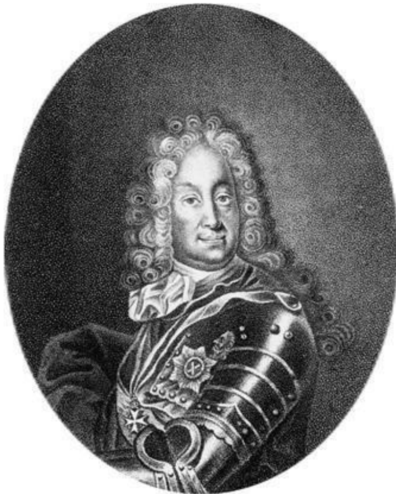
Б.П. Шереметев. Гравюра XIX в.