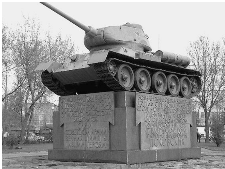
Танк-мемориал в память павшим во время Великой Отечественной войны