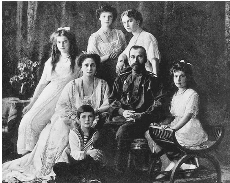
Император Николай II с семьей. Фото 1910-х гг.

2 марта 1917 г. в Пскове император Николай II был вынужден отречься от престола, затем последовал в марте 1917 г. по постановлению Временного правительства арест его и членов его семьи, их пребывание под стражей в Царском Селе, затем – в Тобольске; с весны 1918 г. их содержали в Екатеринбурге, а 5 июля в подвале дома Ипатьевых большевики их расстреляли. Убийство последнего русского царя, вероятно, носило ритуальный характер и имело для