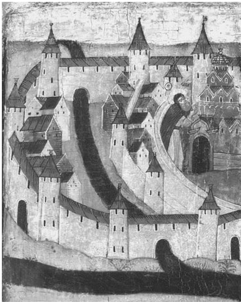
Изображение укреплений Пскова на клейме иконы XVII в.