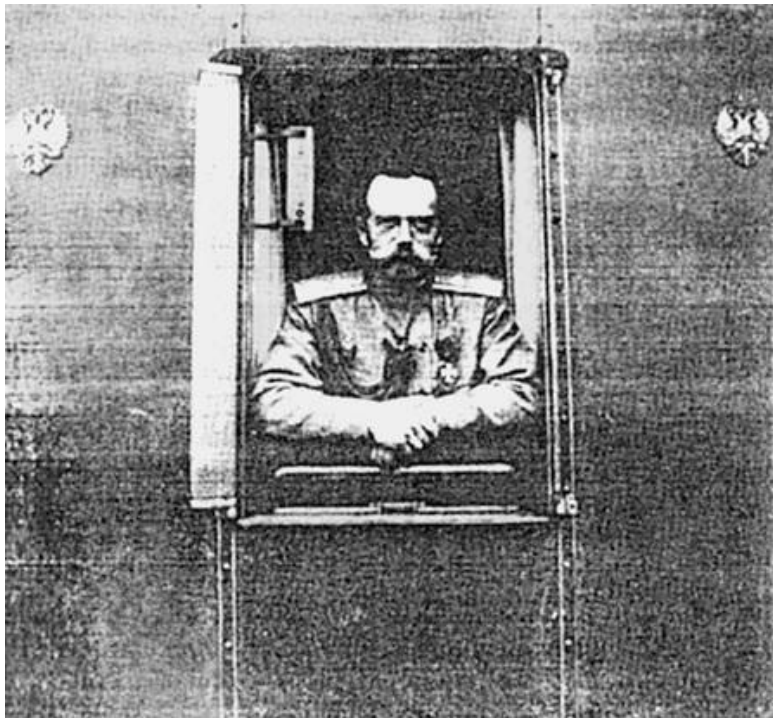
Император Николай II после отречения. Фото 1917 г.

В 1991 г. силами только светских структур были найдены, изъяты из захоронения, опознаны останки расстрелянных членов царской семьи, их близких родственников и верных слуг. Тогда не обнаружили останков великой княжны Марии и цесаревича Алексея. В июле 2007 г. нашли и их. Благословение Церкви на поиск останков Романовых иници-