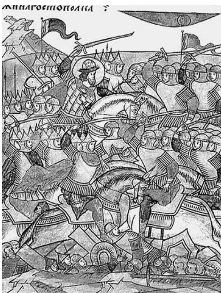
Ледовое побоище. Миниатюра XVI в.