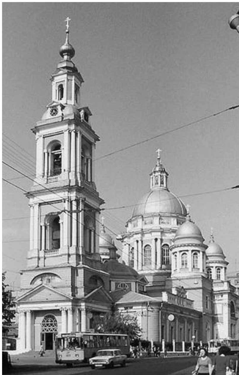
Богоявленский собор в Елохове

Именно из центра Москвы 22 июня 1941 г., т. е. в первый же день войны, сразу после сообщения советского правительства о начале войны митрополит Сергей (И.Н. Страгородский, 1867–1944) обратился ко всему народу страны, ко всем верующим, с патриотическим воззванием. Гораздо позже, только 3 июля, состоялось первое выступление И.В. Сталина по радио после его длившегося с 22 июня молчания. Он явно учел слова обращения к верующим митрополита Сергея. Партийный лидер тех лет впервые говорил с советским народом из Кремля в совершенно необычном для него тоне, взывал к патриотическим чувствам людей. Он обратился к соотечественникам в абсолютно не свойственной ему манере: «Товарищи! Граждане! Братья и сестры!..» – т. е. констатировал, что именно нравственно-духовные силы должны объединить народ и привести его к победе над врагом. В стране в 1943 г. возродилось патриаршество. (На Руси патриаршество было введено в 1589 г., в 1700 г. царь Петр I отменил его; патриаршество было возрождено в 1917 г., когда был выбран патриарх Тихон, но со смертью патриарха Тихона оно было фактически отменено, так как в 1925–1943 гг. был только Местоблюститель Патриаршего престола.)