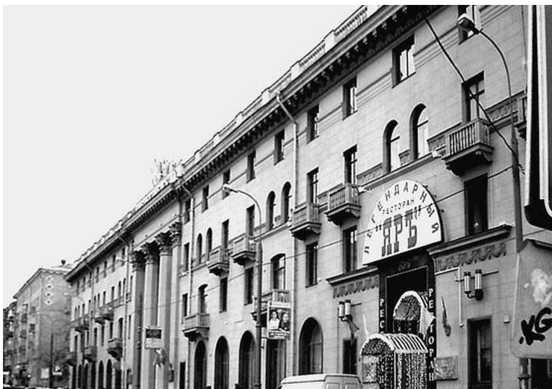
Гостиница «Советская» и ресторан «Яр»

В первые десятилетия советской власти в этой части Москвы были построены интересные и важные объекты культурно-бытового обслуживания населения. Здесь в 1927–1929 гг. построили первую в Москве столовую, или, как говорили тогда, – фабрику-кухню (Ленинградский проспект, 7; арх. А. Мешков). Это 3-этажное здание в стиле конструктивизма с оригинальным входом в срезанной угловой части. Место для этой фабрики было выбрано символическое – поблизости от знаменитого в прошлом ресторана «Яр». Инициатива строительства этой фабрики-кухни исходила от рабочих фабрик «Ява», «Большевик» и других предприятий. При закладке первого камня этой фабрики-кухни подчеркивалось, что она ознаменует собой освобождение трудящихся женщин от домашнего рабства, в частности, ежедневного трудоемкого процесса приготовления пищи. Фабрику-кухню открыли в 1929 г. По ее подобию в 1920-х – начале 1930-х гг. в Москве построили более 10 фабрик-кухонь.