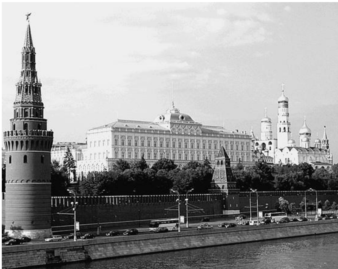
Вид на Кремль и Большой Кремлевский дворец