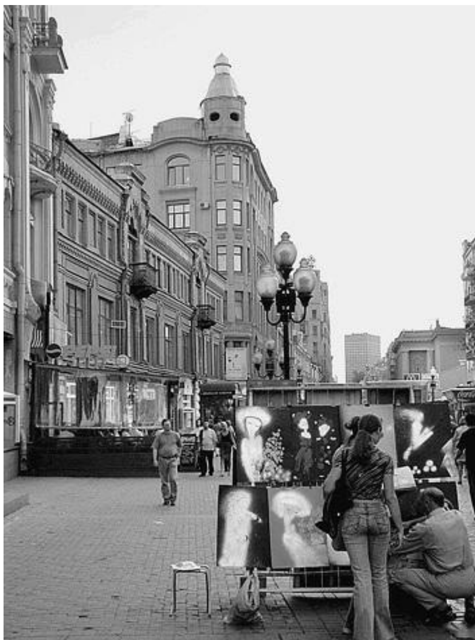
На Старом Арбате

ров и бессистемного размещения промышленных предприятий. В XVII–XVIII вв. отдельно стоящие промышленные предприятия были построены на реке Неглинной (пушечный завод), в Кадашах (полотняный двор), на Яузе (бумажная, пороховая фабрики, мельницы) и др. Преобладающее направление ветров, санитарно-гигиеническое благополучие повлияли на особенности расселения в Москве лиц разных сословий, разных профессий. На западном, северо-западном, юго-западном направлении от Кремля и в непосредственной близости от него сложились традиции расселения наиболее состоятельных, известных москвичей, занятых в основном на государственной службе, связанных с военным делом. Век от века, от десятилетия к десятилетию в этой части Москвы происходила концентрация интеллигенции. На восточном, юго-восточном, северо-восточном направлениях расселялись ремесленники, рабочие, мелкие служащие. Отголоски давних традиций зримо ощущаются и в наши дни.