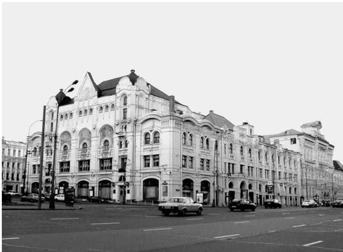
Политехнический музей на Новой площади