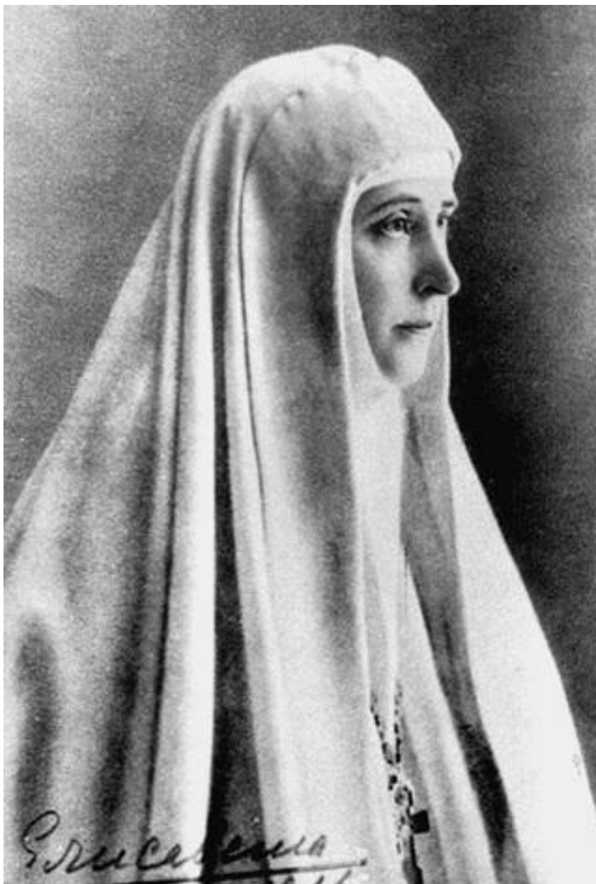
Великая княгиня Елизавета Федоровна. Фото 1900-х гг.

Святынями храма являются частицы святых мощей преподобномучениц Елизаветы и инокини Варвары. В обители действует приют-пансион для девочек-сирот, благотворительная столовая, патронажная служба, магазин церковной утвари. Сестры обители помогают больным и персоналу в военных госпиталях, НИИ скорой помощи им. Н.В. Склифосовского в ожоговом и травматологическом отделениях. Эта обитель имеет два десятка самостоятельно действующих по уставу обители отделений в европейской части России, в Сибири, на Урале, Дальнем Востоке, а также в Белоруссии и на Украине.