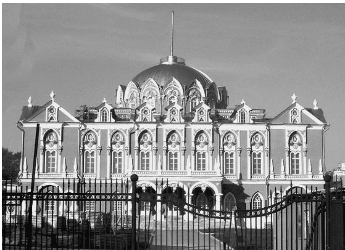
Петровский подвездной (путевой) дворец

В этой части Москвы в разные периоды возвели несколько уникальных сооружений, хозяйственных объектов. На наш взгляд, в архитектурно-художественном плане самым интересным из них является Петровский подвездной дворец (Ленинградский пр., 40). В 1922 г. его хозяином стала Военно-воздушная инженерная академия им Н.Е. Жуковского, богатая организация сохранила дворец, с которым связаны многие страницы московской и российской истории. В наши дни благодаря усилиям правительства Москвы дворцовый комплекс стал собственностью столицы. В нем будут элитарная гостиница, музейная экспозиция, деловой сектор.