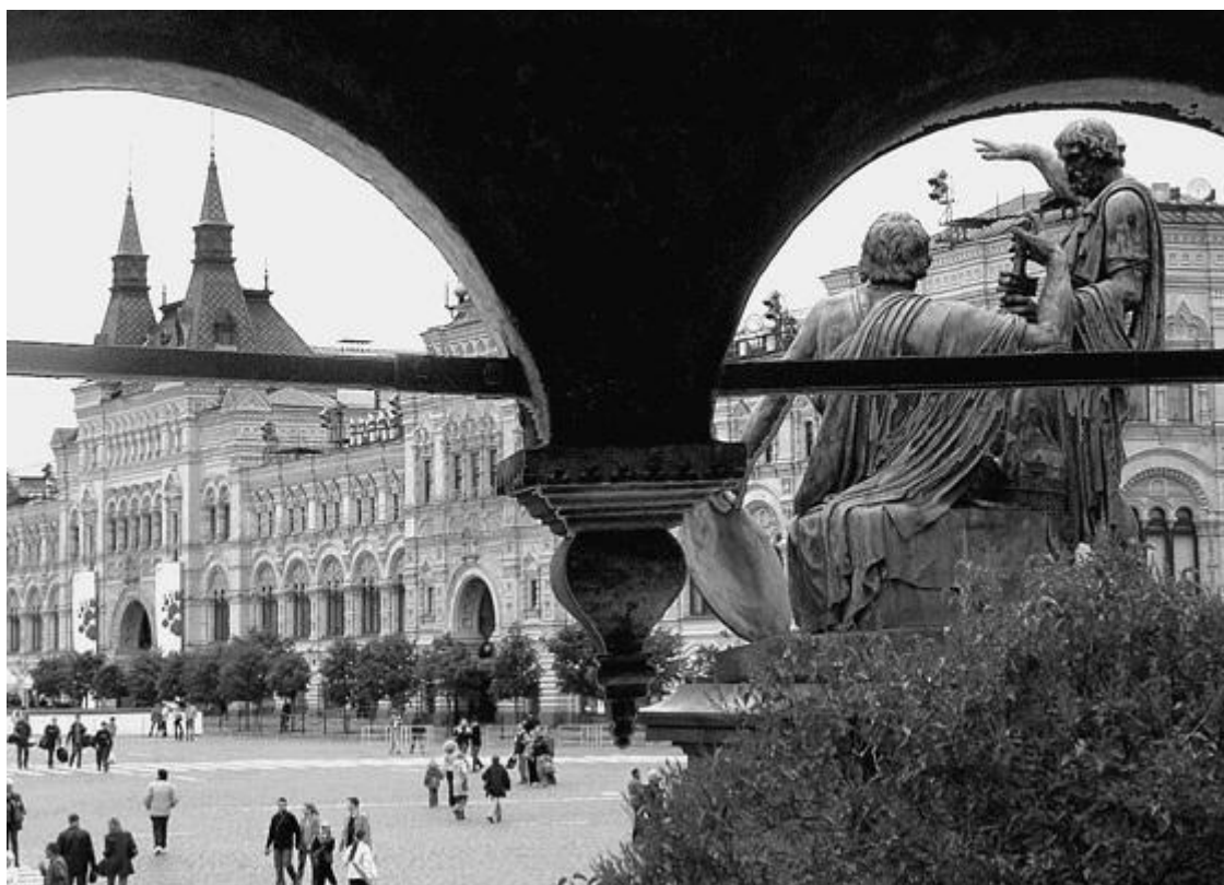
Вид на памятник Минину и Пожарскому и ГУМ (Верхние торговые ряды)

1936 г. собор собирались снести. Редчайшее мужество проявил архитектор-реставратор П.Д. Барановский (1892–1984), который послал Генеральному секретарю ЦК коммунистической партии, тогда первому человеку в стране И.В. Сталину (Джугашвили, 1878–1953), телеграмму о необходимости сохранения Покровского собора и, несмотря на притеснения, ссылку, бескомпромиссно защищал прекрасное произведение русских зодчих. В большой мере благодаря именно ему Покровский собор удалось сохранить. В соборе с 1991 г. постепенно возрождается религиозная жизнь (проводятся нерегулярные богослужения), но он все еще не возвращен в собственность Церкви, является филиалом Государственного исторического музея.