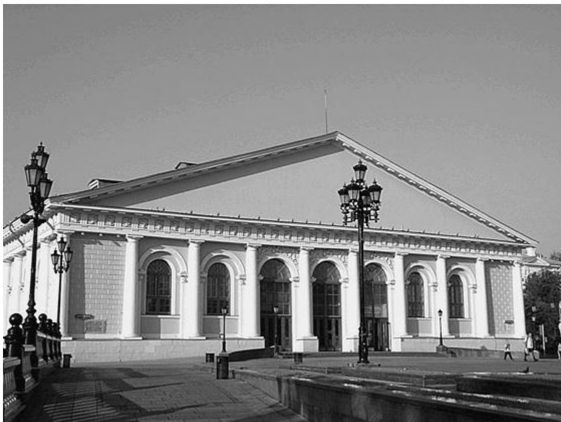
Здание Манежа на Моховой улице

Недалеко расположены здания, сооруженные в десятилетия советской власти, характерные для парадной архитектуры того периода: бывшее здание Госплана (арх. А.Я. Лангман), бывшее здание ВАО «Интурист» (Моховая ул., 16, арх. И.В. Жолтовский) и др. В 1930 – 1950-х гг. была проделана огромная работа по переустройству, благоустройству центральной части Москвы.