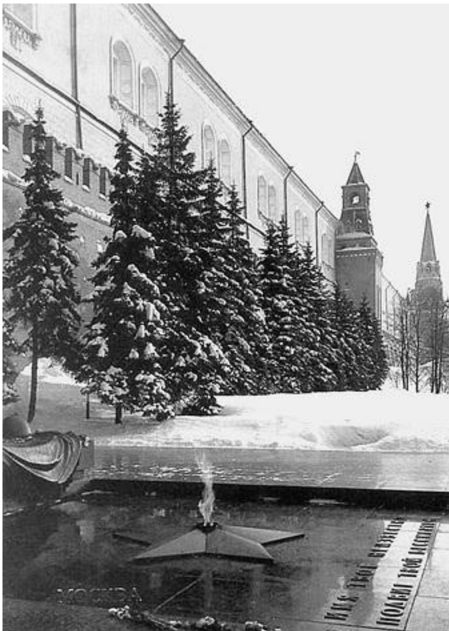
Могила Неизвестного солдата в Александровском саду

Рядом с Покровским собором находится АО «Торговый дом – ГУМ» , занимающее бывшие Верхние торговые ряды , построенные в 1893 г. (арх. А.Н. Померанцев, остекленные перекрытия выполнены по проекту инж. В.Г. Шухова).