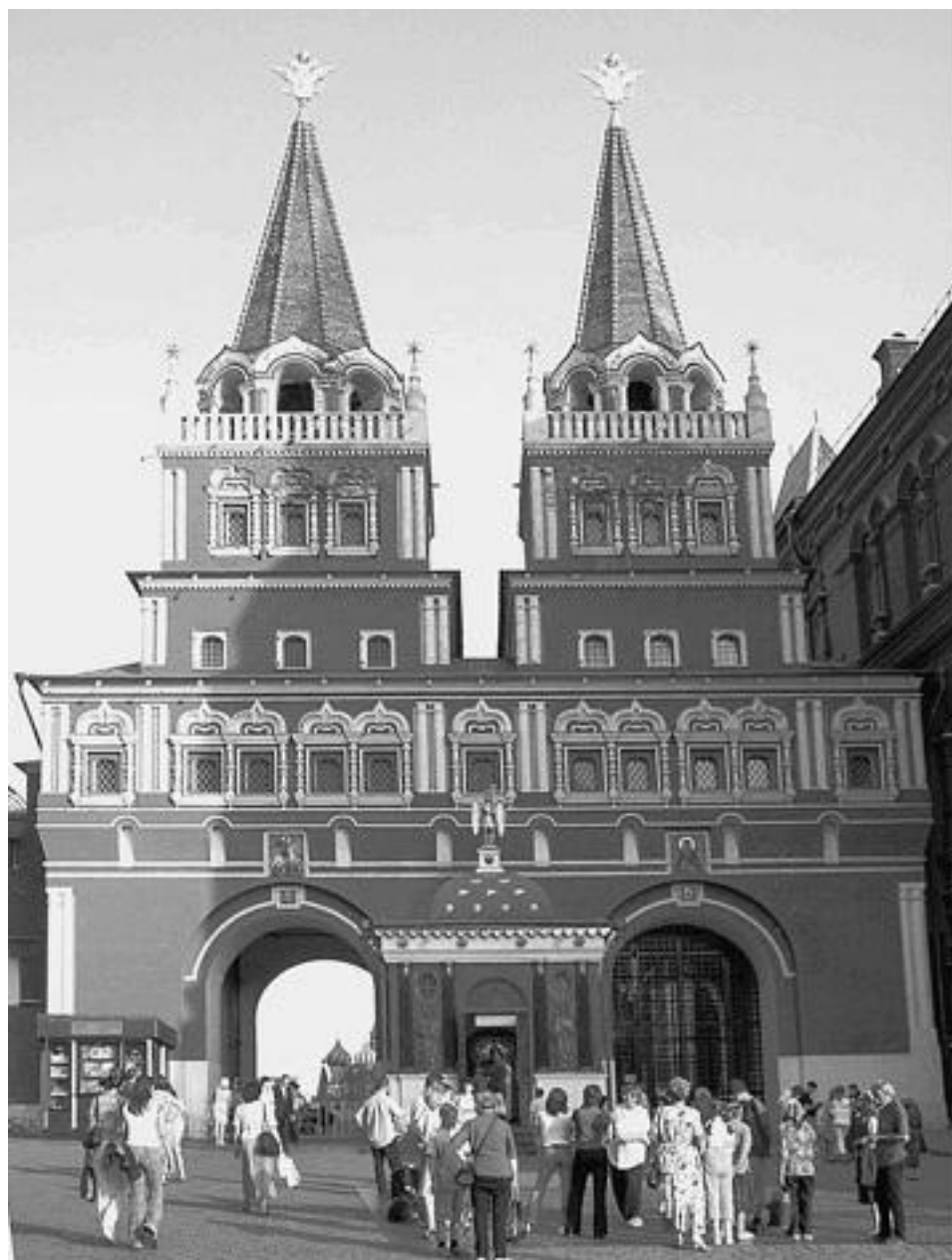
Воскресенские ворота с часовней Иверской иконы Божией Матери

Вот почему Пантеон коммунистов и Мавзолей у Кремлевской стены уже не являются национальной святыней, а остаются только мемориальным местом, в первую очередь, для коммунистов. В-третьих, на Красной площади стали проводить парады, демонстрации, увеселительные (а в последние годы и коммерческие, прибыльные с позиции получения денег) мероприятия с музыкой, песнями, танцами, прочей веселой атрибутикой; рядом с могилами и захоронениями подобные акции недопустимы. Еще в 1953 г., сразу после смерти И.В. Сталина, было принято и опубликовано совместное постановление ЦК КПСС и Совета министров СССР о целесообразности со временем переноса захоронений коммунистов и Мавзолея с Красной площади и сооружения в другом месте монументального здания – Пантеона, куда предполагалось перенести саркофаг с телом Ленина и саркофаг с телом Сталина, останки и могилы других коммунистов, продолжить в нем захоронение особо отличившихся коммунистов. У лидеров социалистической страны хватило ума принять такое постановление и не отменить его, хотя его реализация затянулась. В-четвертых, сохранение мумии Ленина имеет научно-практическую ценность. Целый институт – Лаборатория биологических структур –