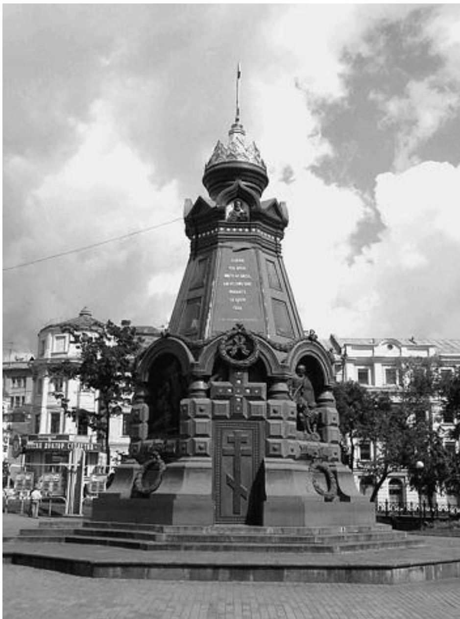
Памятник гренадерам – героям Плевны

Из более чем трехсот памятников (монументов), имеющих в Москве, большая часть находится в Центральном округе. Среди них памятник К.М. Минину и Д.М. Пожарскому (1818, скульптор И.П. Мартос) на Красной площади – это самый первый памятник, появившийся в Москве. В досоветской Москве большинство памятников создавалось на средства населения. Так были воздвигнуты памятник гренадерам – героям Плевны (1887, первый памятник неизвестному солдату в Европе), Н.И. Пирогову (1897), первопечатнику И.Ф. Федорову, А.С. Пушкину (1880) и др. В советский период в Москве поставили около 260 памятников, но, как показала жизнь, многие не следовало спешить ставить. В 1991 г. немало памятников, особенно в центральной части, было снято (Ф.Э. Дзержинскому, Я.М. Свердлову, М.И. Калинин и некоторым другим деятелям советского периода). С начала 1990-х гг. в Москве ставят памятники только действительно достойным людям, и в большой мере в центральной части города. Среди них памятники святым просветителям словенским Мефодию и Кириллу, российской святой великой княгине Елизавете Федоровне, А.А. Блоку, маршалу Г.К. Жукову, святому великому князю Московскому Даниилу Александровичу, С.А. Есенину, В.С. Высоц-