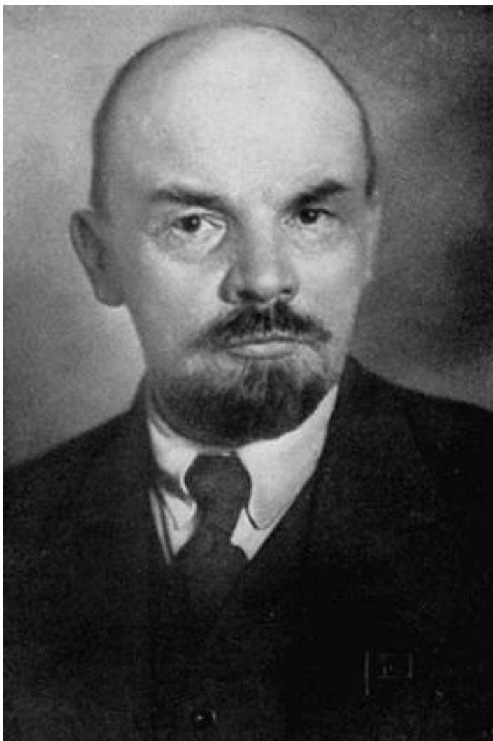
В.И. Ленин. Фото начала 1920-х гг.

В 1907–1917 (начало) гг. В.И. Ульянов жил за границей и действовал во имя грядущих революционных изменений в России. После Февральской буржуазной революции 1917 г. В.И. Ульянов, взявший еще раньше псевдоним Ленин, вернулся в Россию в окружении его соратников. На ведении революционной работы в России он получил ощутимые деньги у немецкого правительства (шла I Мировая война), заинтересованного в ослаблении экономического и политического значения России, падении ее обороноспособности, военной силы и ускорении вывода ее из войны. Летом 1917 г. 47-летний Ленин скрывался от преследований Временного правительства. В октябре 1917 г. он приехал в Петербург и возглавил руководство Октябрьским переворотом, названным Социалистической революцией. Большевики во главе с Лениным смогли захватить власть. На II Всероссийском съезде Советов Ленин был избран Председателем Совета народных комиссаров (возглавил советское правительство). По настоянию Ленина весной 1918 г. IV Чрезвычайный съезд Советов ратифицировал позорный для России Брестский мир. По Брестскому мирному договору Россия потеряла, а Германия приобрела почти 1 млн кв. км (т. е. больше германских европейских территориальных владений).