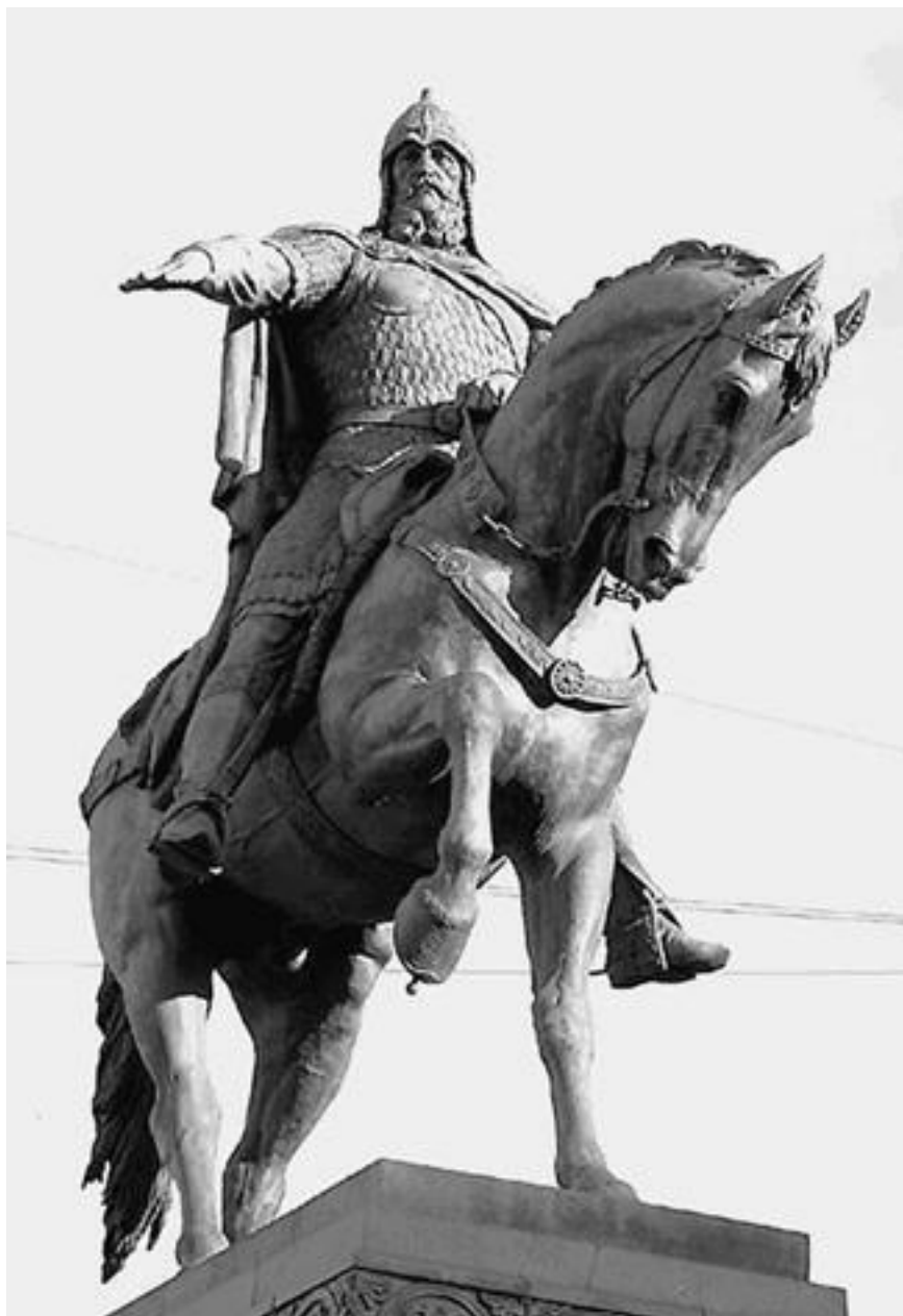
Памятник Юрию Долгорукому на Советской площади

В ЦАО расположено более 350 учреждений, относящихся к аппарату органов государственного управления, общественных организаций, межотраслевых органов управления (Государственная дума, Городская дума, Мэрия Москвы, Госкомстат, ФСБ и др.). Здесь размещаются крупнейшие коммерческие, финансовые, предпринимательские структуры. В Центральном округе функционирует более 200 промышленных предприятий (обувная фабрика, автоагрегатный завод, карбюраторный завод, кондитерская фабрика «Красный Октябрь» и др.), находится более 400 научных и научно-исследовательских института, огромное количество высших учебных заведений (среди них – комплекс Московского государственного университета им. М.В. Ломоносова на Моховой улице, Московский архитектурный институт, Академия живописи, ваяния и зодчества, Московская государственная консерватория им. П.И. Чайковского, Московский государственный лингвистический университет, Российская академия музыки им. Гнесиных, Московский государственный педагогический университет, Российский православный университет св. Иоанна Богослова, Высшее театральное училище им.