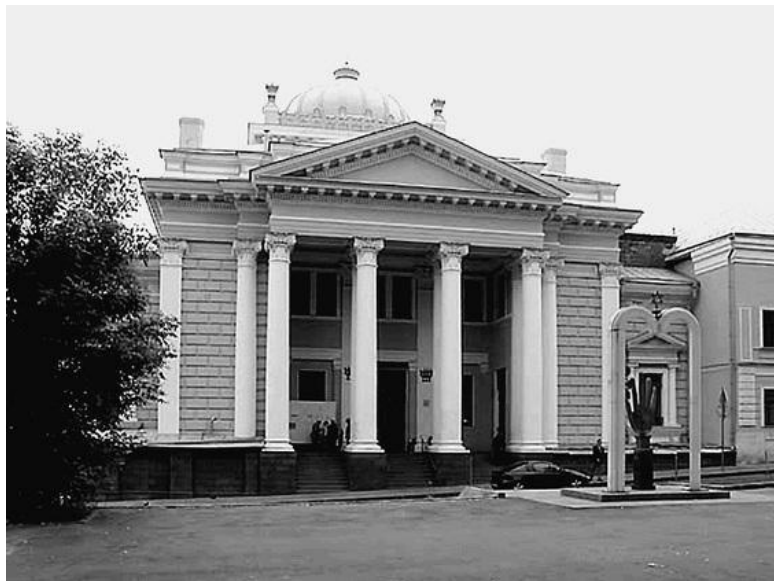
Московская хоральная синагога

лай II (1868–1918, правил в 1894–1917). Костел построили в 1901–1911 гг. по проекту академика архитектуры поляка по происхождению Ф.И. Богдановича-Дворжецкого. Деньги на строительство этого костела пожертвовали поляки, проживавшие в разных частях России, и прежде всего – члены московской польской общины.