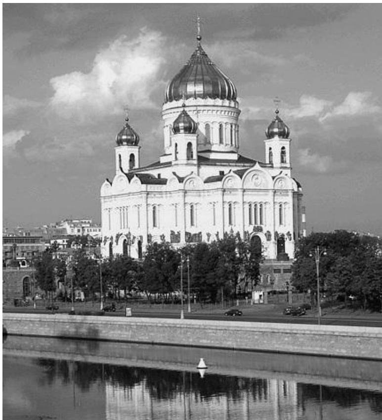
Храм Христа Спасителя

В ЦАО находится подавляющая часть бывших и действующих в наши дни православных монастырей, в том числе действующие монастыри: Новоспасский, Новодевичий,