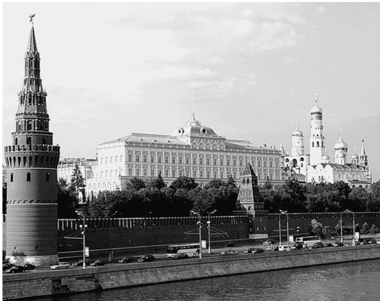
Вид на Кремль и Большой Кремлевский дворец

Особо значимой частью Москвы являются Кремль и Красная площадь , их ближайшее окружение из площадей и улиц. Кремль был и остается главным символом нашей столицы и всей России. Подъезжая или подходя к Кремлю, мы видим его мощные кирпичные стены и башни, возведенные в 1485–1495 гг. Их предшественниками были белокаменные стены в 1367–1368 гг. (отсюда и пошло название Москва белокаменная), а еще раньше – дубовые, построенные в 1339–1340 гг. и сгоревшие в 1365 г. А самые первые просто дере-