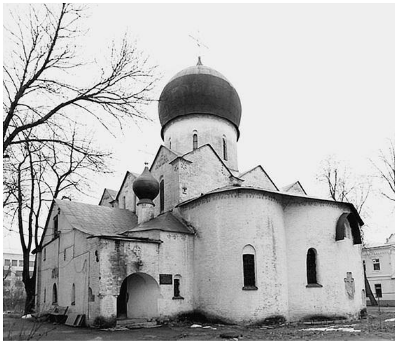
Покровский храм в Марфо-Мариинской обители