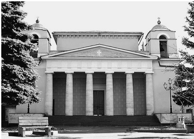
Костел Святого Людовика

распятого Христа – 3 м. Кроме того, установлены скульптуры Пресвятой Девы Марии и святого Иоанна Евангелиста. Автором этого монументального произведения является скульптор из Подмосковья С.Ф. Захлебин. В костеле можно проводить не только богослужения, но и концерты органной музыки.