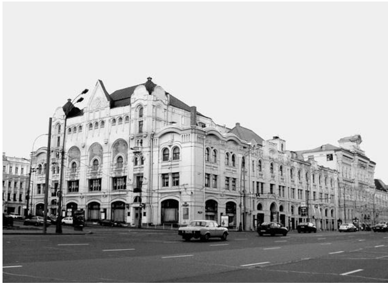
Политехнический музей на Новой площади

Известна на весь мир Третьяковская галерея (Лаврушинский пер., 10). Третьяковская галерея является сокровищницей национального изобразительного искусства, в которой представлена живопись, в том числе иконопись, за тысячелетнюю историю Российского государства. Основал ее предприниматель-меценат, коллекционер, благотворитель П.М. Третьяков (1832–1898) в 1856 г., в 1892 г. он подарил свою коллекцию (1287 живописных произведений, 518 рисунков, 9 скульптур) Москве. В своем завещательном распоряжении (1860) П.М. Третьяков записал, что «...желал