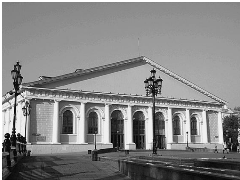
Здание Манежа на Моховой улице

ры того периода: бывшее здание Госплана (арх. А.Я. Лангман), бывшее здание ВАО «Интурист» (Моховая ул., 16, арх. И.В. Жолтовский) и др. В 1930 – 1950-х гг. была проделана огромная работа по переустройству, благоустройству центральной части Москвы.