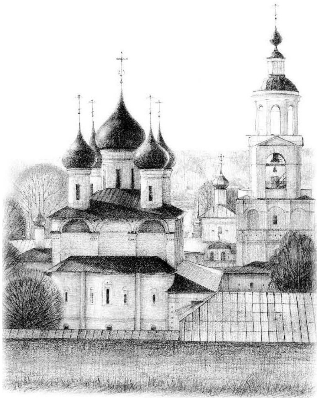
Рисунки Ольги Бухтояровой