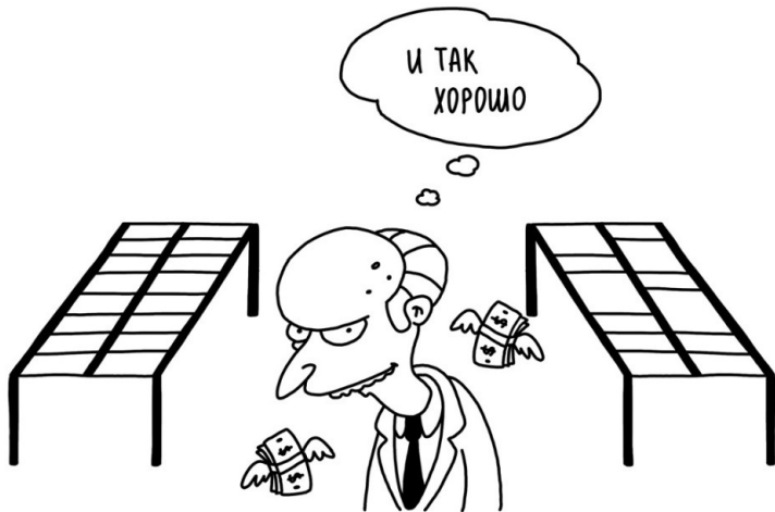
Иллюстрация: М. В. Шевелева

А потом он сэкономил на утеплении крыши мансарды. Итог – зимой холодно, летом жарко. Простые законы физики. Без сюрпризов.