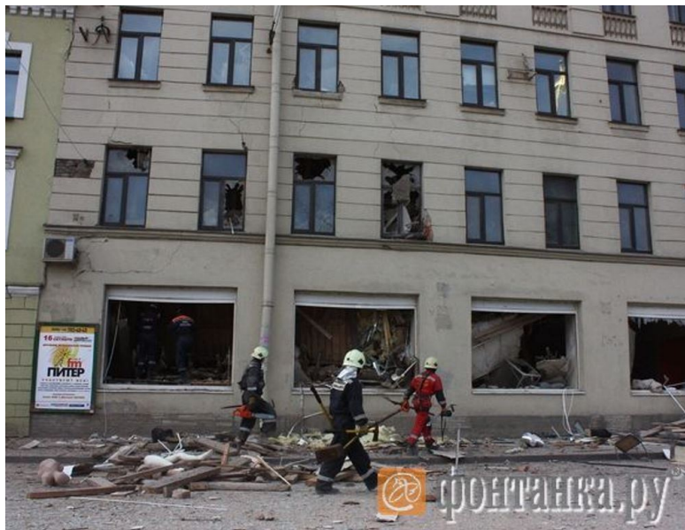
Фото с сайта: www.fontanka.ru Валентин Илюшин