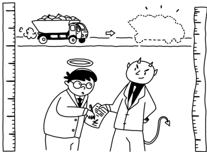
Иллюстрация: М. В. Шевелева

Но за его счёт оштукатурили ещё 2-3-4-5-6 или даже 7 объектов маленьких или больших.