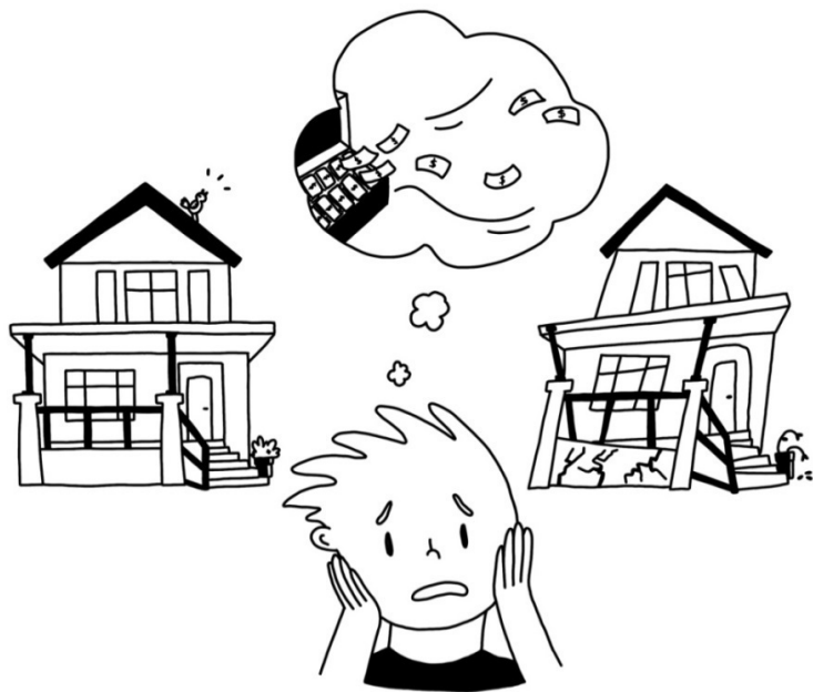
Иллюстрация: М. В. Шевелева

промахнётся. А если промахнётся, то никто не умрёт и потери будут невелики.