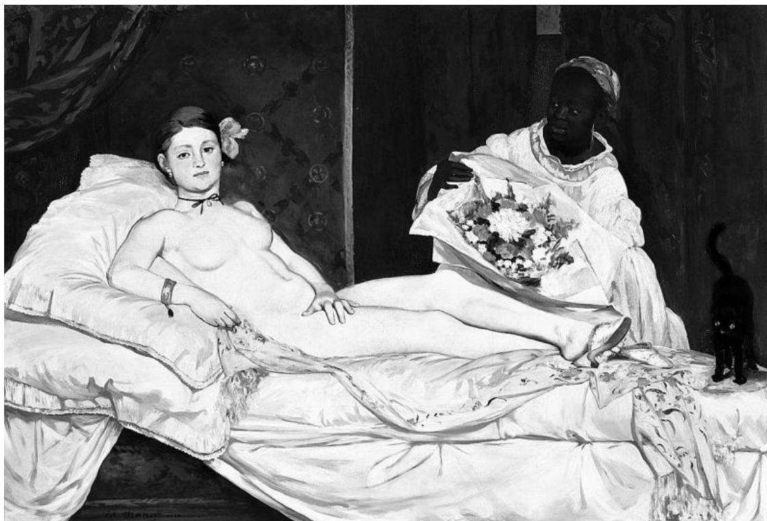
Эдуард Мане. Олимпия. 1863. Музей Орсе, Париж

В чем же это отличие? Посмотрим внимательнее на «Завтрак на траве». Во-первых, эта вещь очень интересно и необычно сделана с точки зрения композиции. Во-вторых, это вещь очень классическая. И в-третьих, она впервые показала ту жизнь, которой живут люди, и на картине все они узнаваемы. По сути это портрет, и одна из женщин была всем хорошо известна – это Викторина Меран. В картину вошла сама жизнь, про которую никто даже не думал, что ее можно так изображать в искусстве.