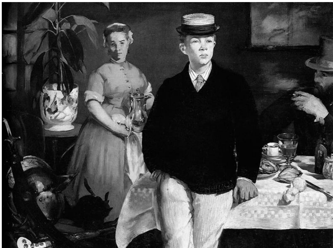
Эдуард Мане. Завтрак в мастерской. 1868. Новая пинакотека, Мюнхен

тали новизну и классическую традицию, нет. И именно ему принадлежит очень интересное социальное открытие: больше никто так полно не описывал для нас жизнь своей среды.