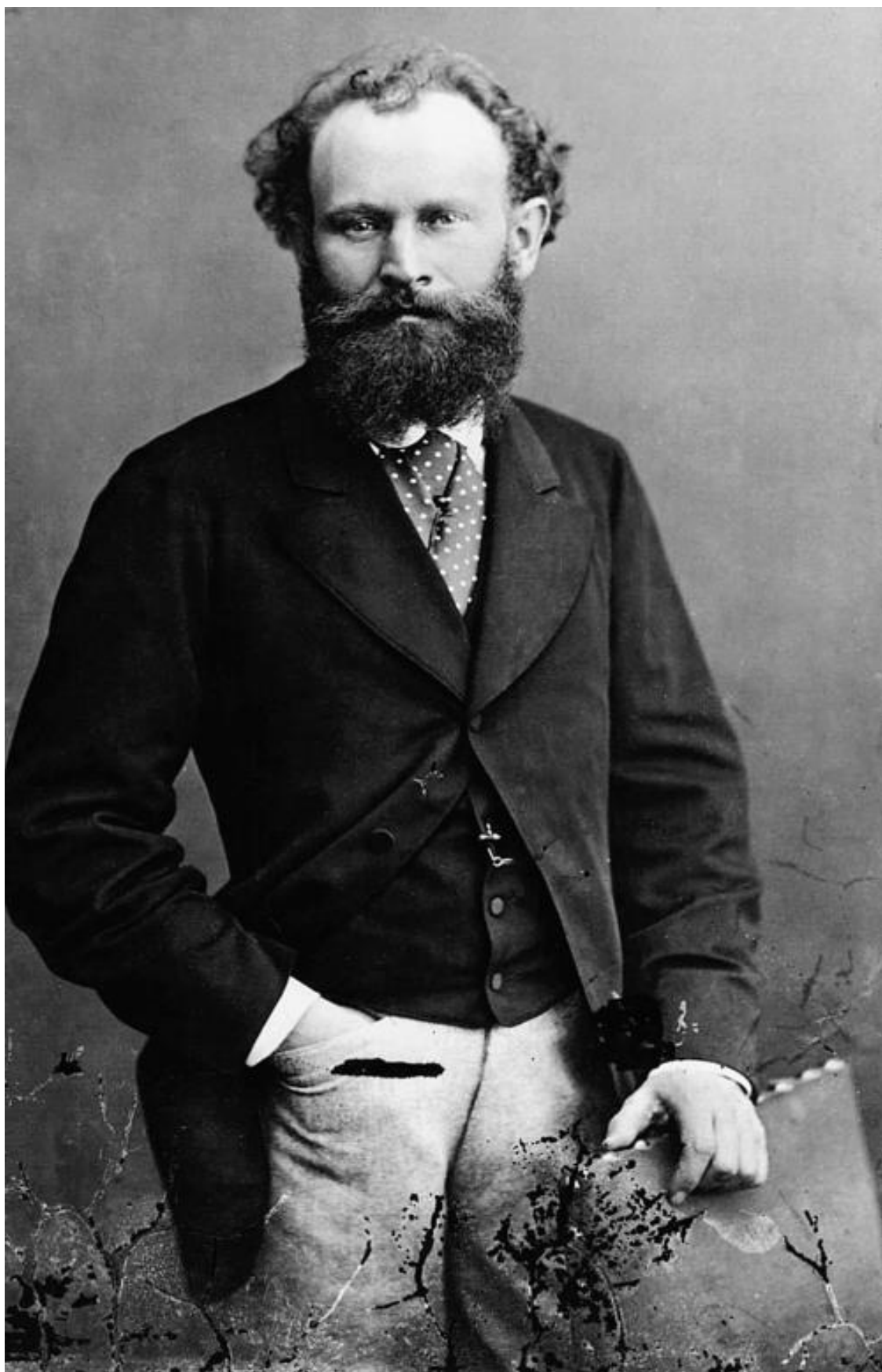
Эдуард Мане, портрет