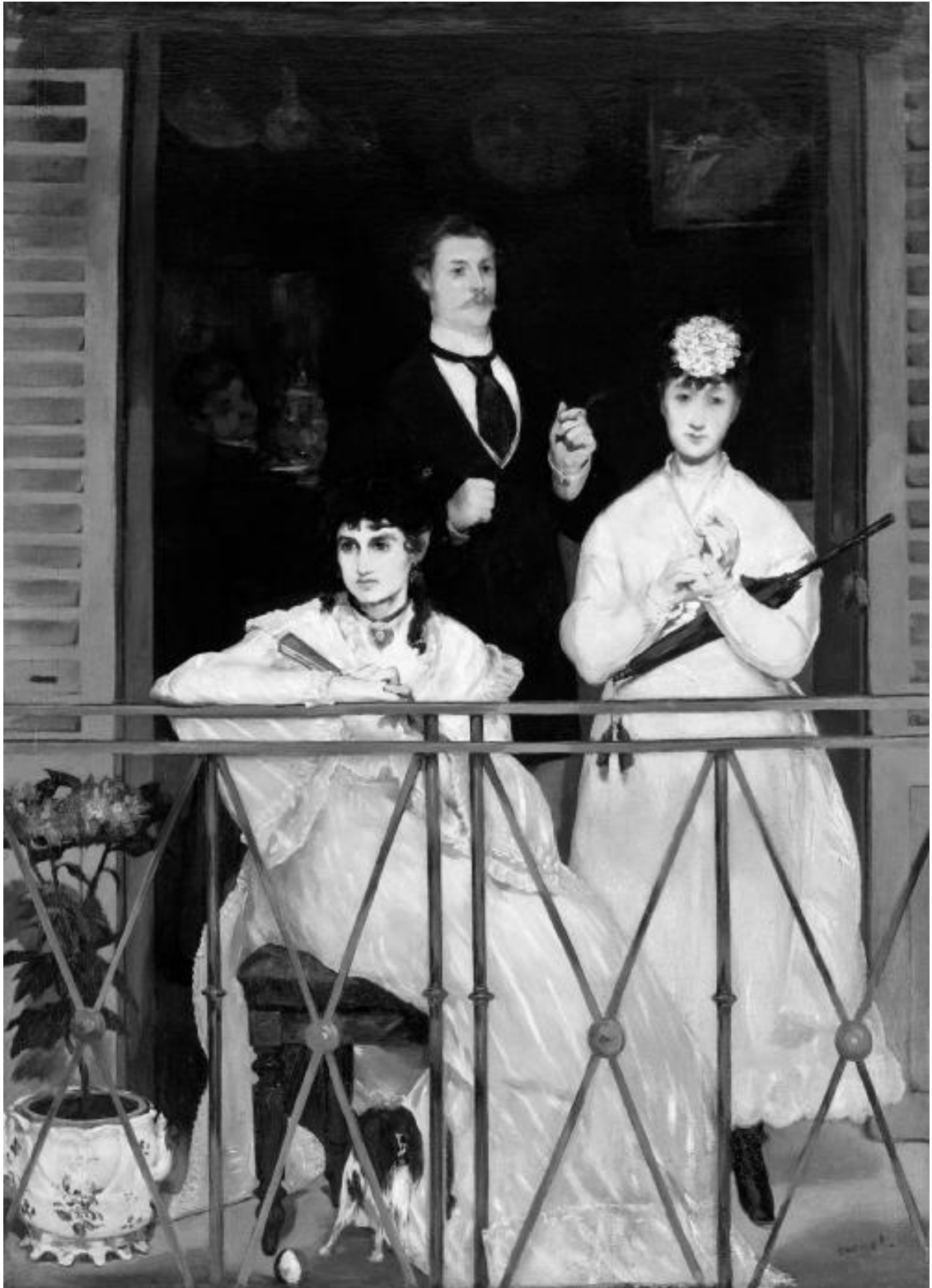
Эдуард Мане. Балкон. 1868–1869. Музей Орсе, Париж

В картинах Мане отображена свойственная ему буржуазность, изящество жизни, которое очень ценимо им. Он как никто из художников своего времени ценит элегантность, женственность, чувственную эротичность: эти локоны, шляпы, платья, изумительно написанные кистью мастера. Он великий художник, мимо вкуса которого, мимо глаза которого, мимо эксперимента которого, мимо художественной алчности которого не прошло ничего.