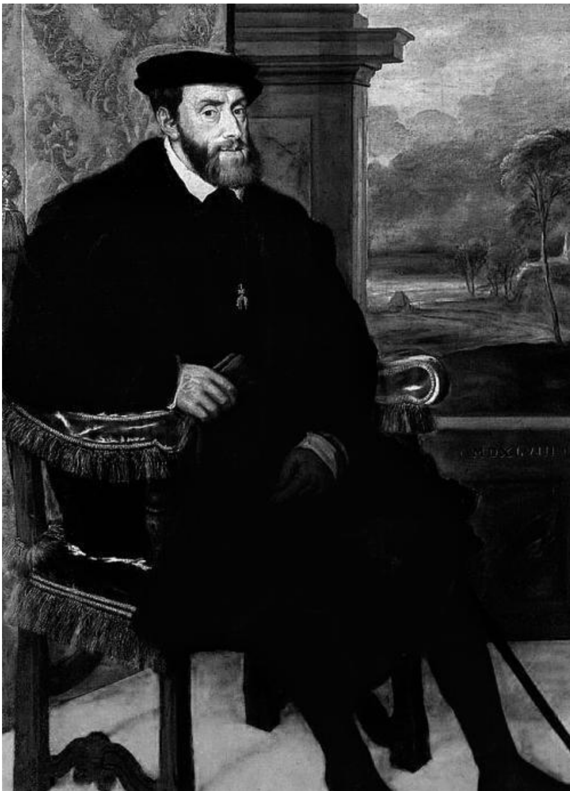
Тициан. Портрет Карла V в кресле. 1548. Старая пинакотека, Мюнхен

Венецианцы обожали женскую красоту, но в их живописи отсутствует какая-то женская активность в жизни. Женщины там присутствуют больше для любования. А «Сельский концерт» можно назвать пасторалью, причем не просто пасторалью, а пасторалью идеальной: в ней есть гармония всего со всем, гармония мира с человеком, растворенным в этой природе. Посмотрите на эти линии рук, на прозрачный кувшин... И картина называется «Концерт» не из-за того, что эти люди исполняют музыку, а потому что в ней есть то, что есть в концерте: