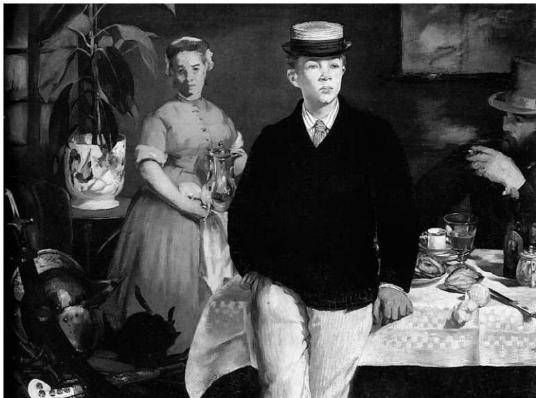
Эдуард Мане. Завтрак в мастерской. 1868. Новая пинакотека, Мюнхен