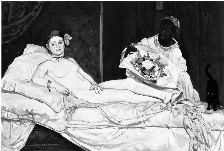
Эдуард Мане. Олимпия. 1863. Музей Орсе, Париж

В чем же это отличие? Посмотрим внимательнее на «Завтрак на траве». Во-первых, эта вещь очень интересно и необычно сделана с точки зрения композиции. Во-вторых, это вещь очень классическая. И в-третьих, она впервые показала ту жизнь, которой живут люди, и на картине все они узнаваемы. По сути это портрет, и одна из женщин была всем хорошо известна – это Викторина Меран. В картину вошла сама жизнь, про которую никто даже не думал, что ее можно так изображать в искусстве.