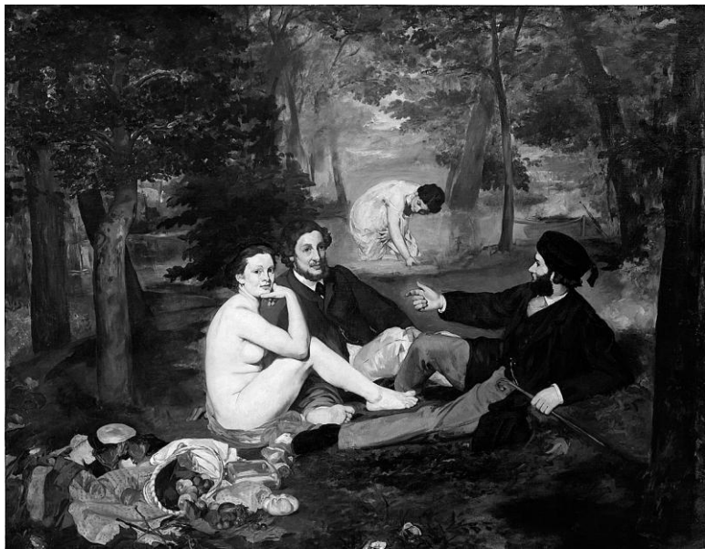
Эдуард Мане. Завтрак на траве. 1863. Музей Орсе, Париж

наженные женщины. И эта картина, как и «Олимпия», произвела взрывной эффект. Началась дискуссия – и вокруг картины, и вокруг личности художника. Все отлично понимали, до какой степени это все отличается от того, к чему привык зритель.