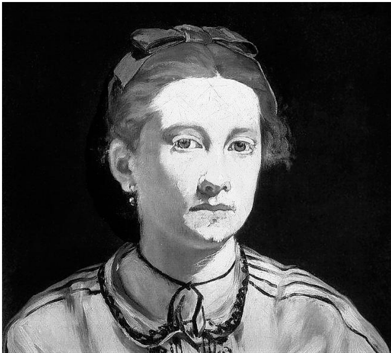
Портрет Викторины Мёран работы Эдуарда Мане. 1862. Музей изящных искусств, Бостон

Эдуард Мане – удивительная фигура. Он впервые начал описывать жизнь новым языком. Мане не только связан с традициями классической культуры, но он художник, открывающий двери для понимания другой задачи искусства. Он является художником-импрессионистом и в этом стиле на-