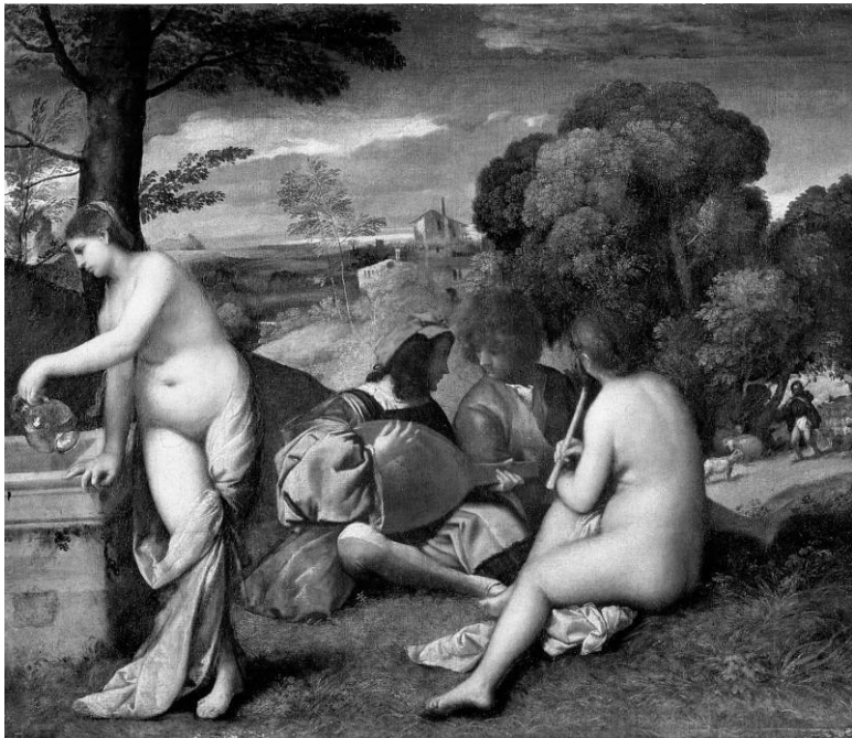
Джорджоне. Сельский концерт. 1508–1509. Лувр, Париж