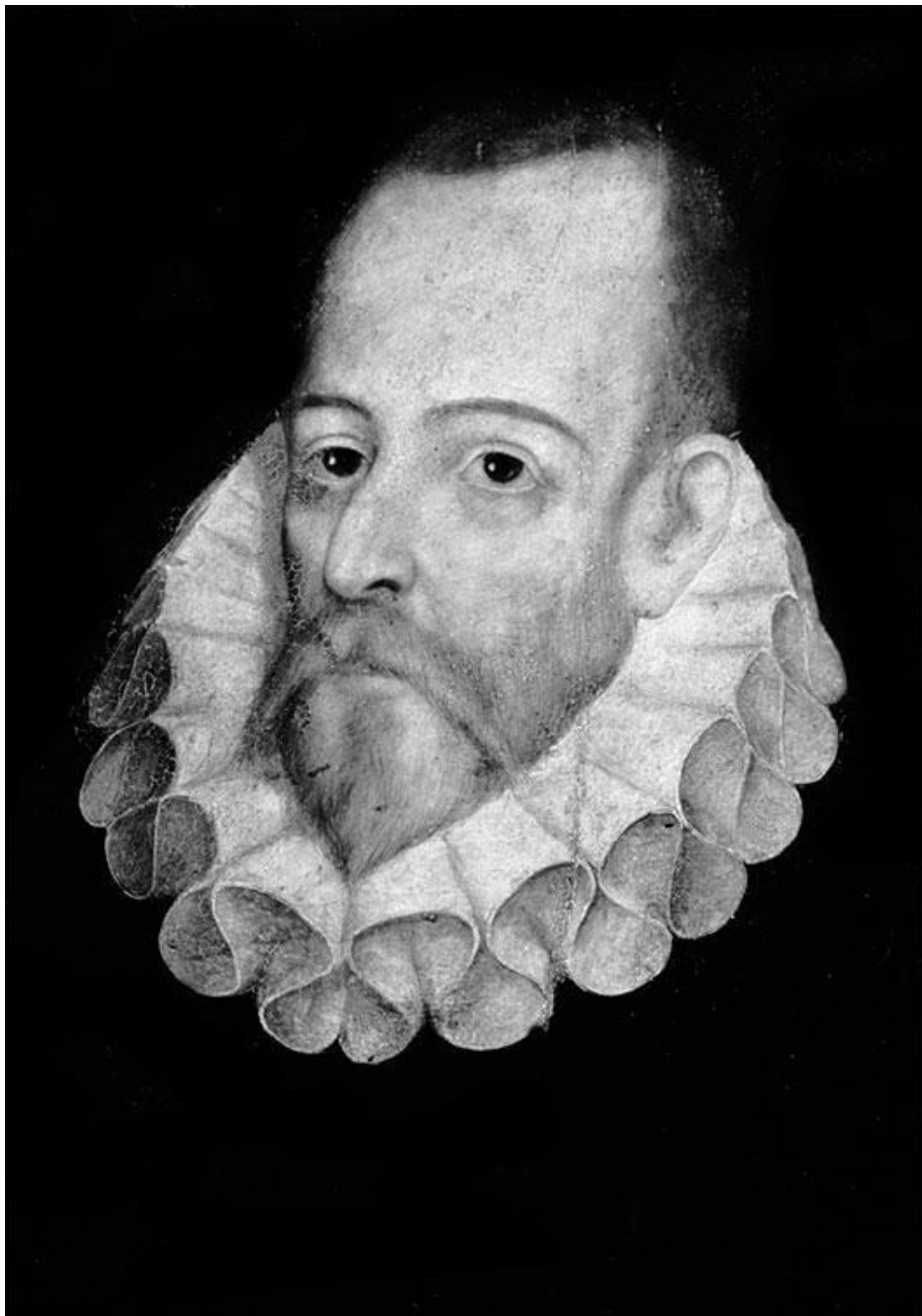
Хуан Маргинес де Хаурегуи-и-Агилар. Предположительный портрет писателя Мигеля де Сервантеса. 1600. Королевская историческая библиотека, Мадрид.

Любопытно еще и то, что эти три имени (между прочим, можно назвать здесь и Лопе де Вега, и еще очень большое количество людей) особенные. И особенные они по одной таинственной причине: они все анонимны. О них знают все, это самые знаменитые имена куль-