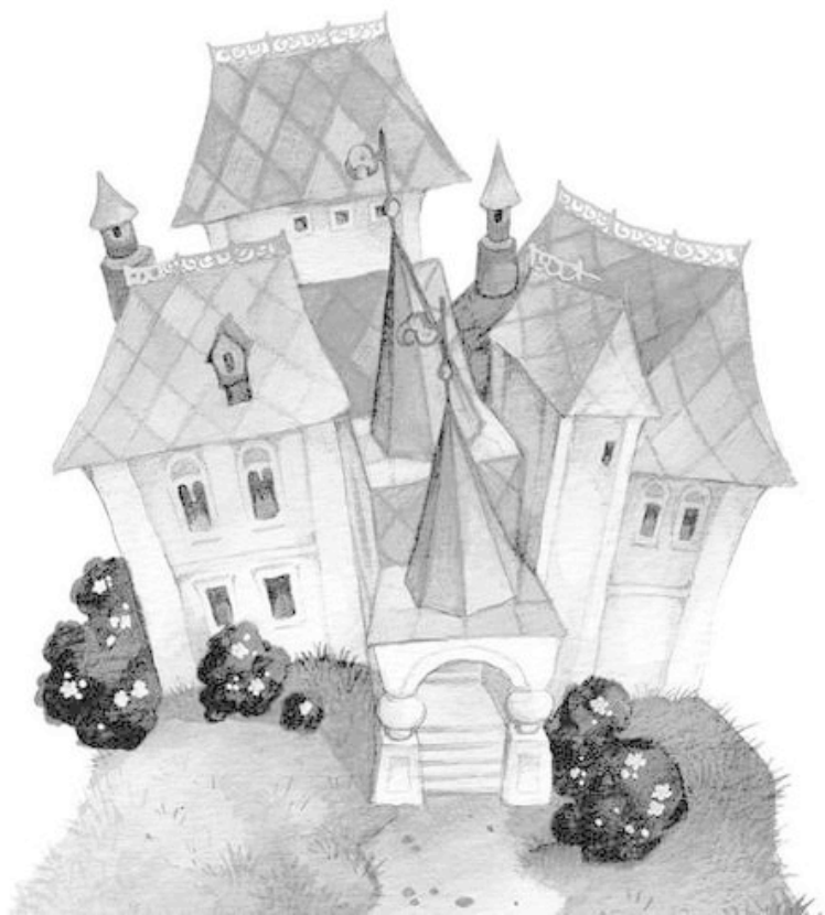
Рис. О. Ионайтис