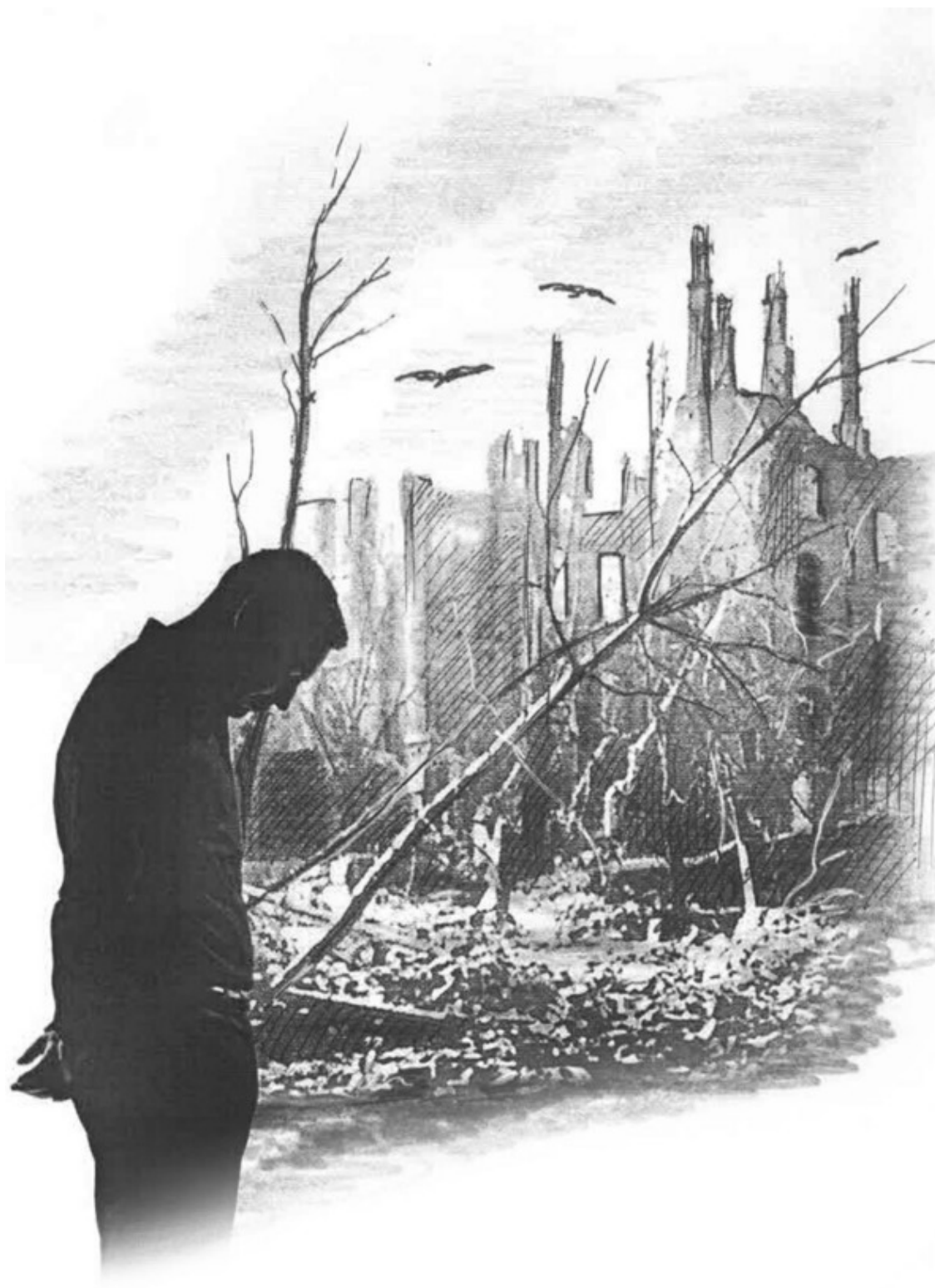
Иллюстрация: Леонард Крылов