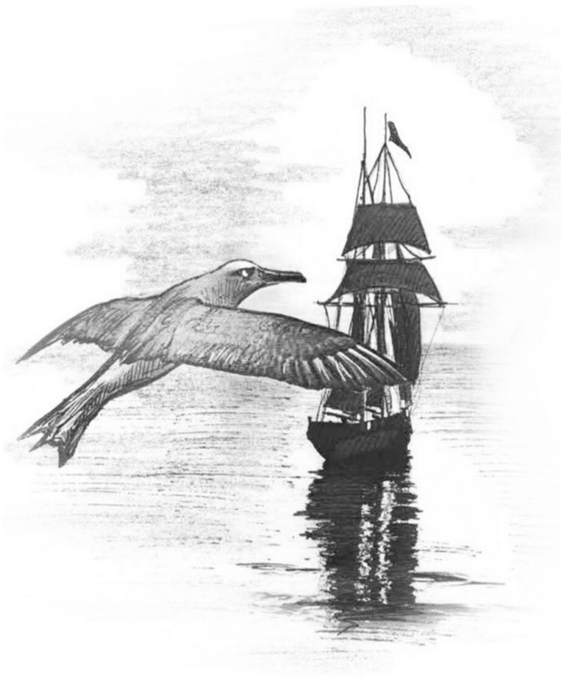
Иллюстрация: Леонард Крылов