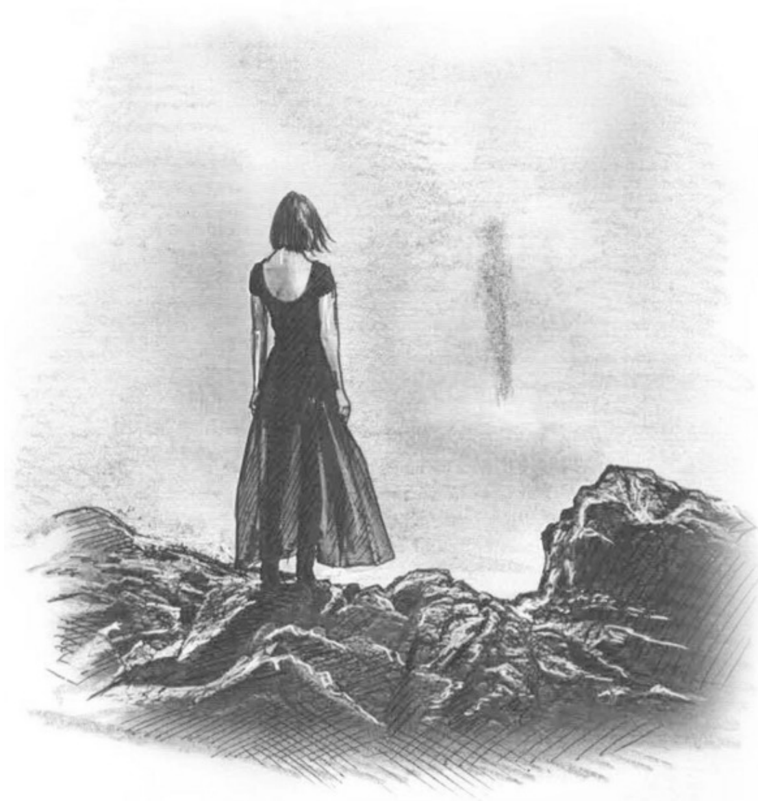
Иллюстрация: Леонард Крылов