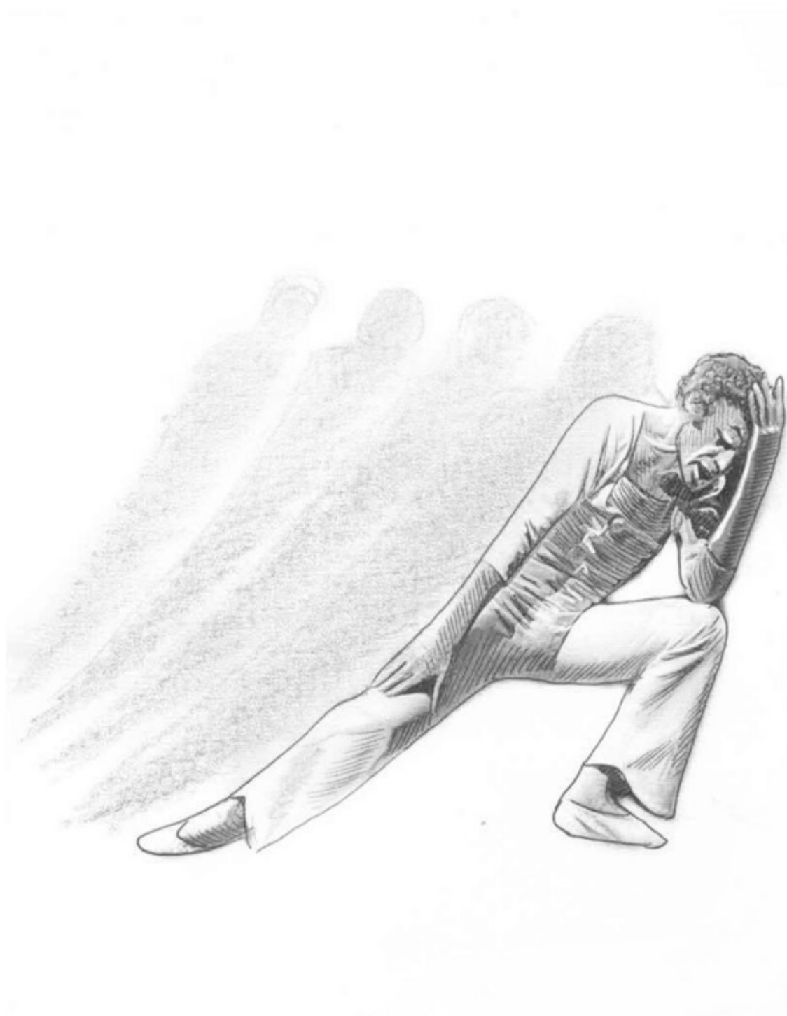
Иллюстрация: Леонард Крылов