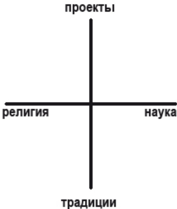
Рис. 2. Векторы пространства культуры © В.Каган, 1991

В пору написания этого текста тема «между наукой и религией» диктовалась тем, что на фоне воинствующего советского атеизма идеи и практика гуманистической психологии были не просто новы, но и вызывали массу вопросов, связанных как с непривычным расширением горизонтов психологии, так и с технологической близостью практик гумани-