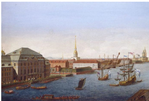
Адмиралтейство при Петре I.