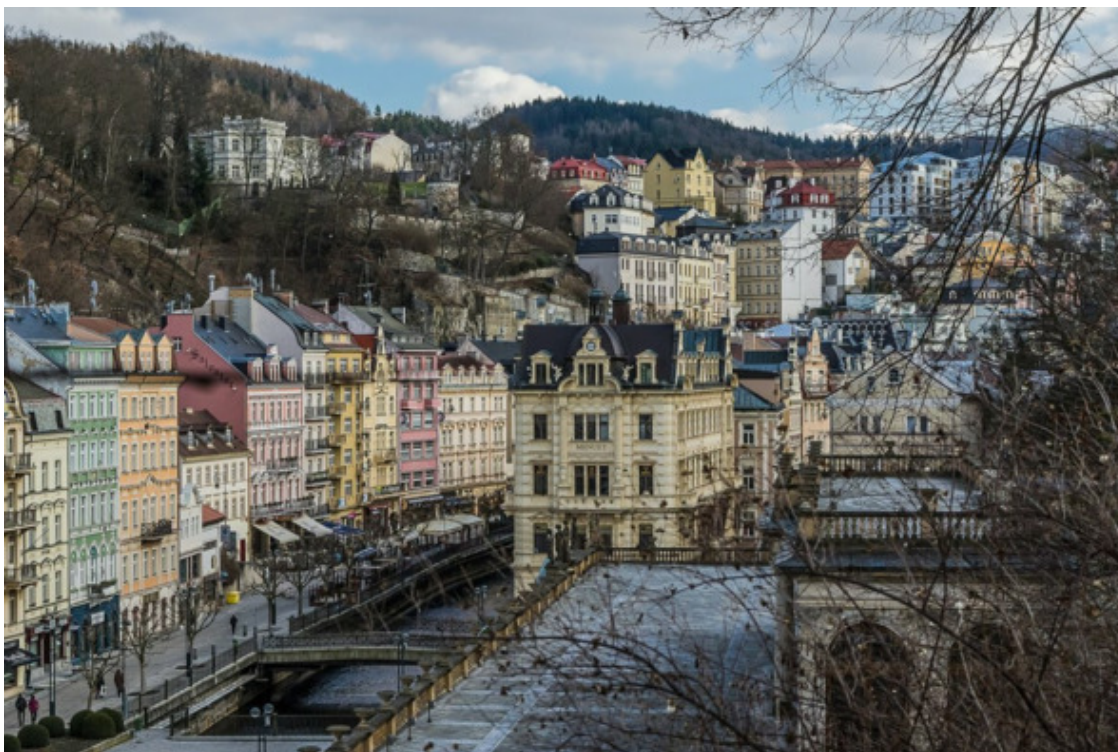
Карловы вары (Карлсбад). Наши дни.