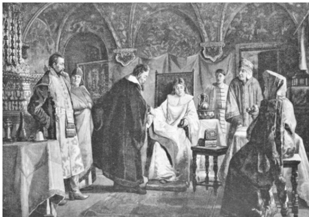
Мария (Анастасия) Хлопова.

кому. Будучи женихом и невестой Михаил с Анастасией отправились на гулянье в село Покровское взяв с собой ларец с сахарными леденцами и заедками, которые были отравлены подкупленными слугами. Ночью Анастасии стало плохо. По дворцу поползли слухи, что у невесты «черная немочь». По этому поводу был созван собор, но не Земской, а дворянский. Бояре вынесли приговор: " Невеста к царской радости непрочна», свадьба была отменена.