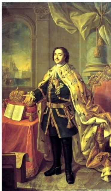
Петр I, ростовой портрет.

Петр I является, пожалуй, самым узнаваемым правителем России, а его вклад в развитие России переоценить невозможно. Петр Алексеевич был провозглашен царем в 10-летнем возрасте, а самостоятельно править стал с 1689 года. Петр проявлял огромную тягу к знаниям и стал первым русским царем, посетившим западные страны с деловой поездкой по окончании своей поездки нашу страну, ожидали большие реформы. Петр поражал своей фигурой, его рост был 203 см, но при этом император был очень стройным, носил размер обуви 39, а размер одежды 48-й.