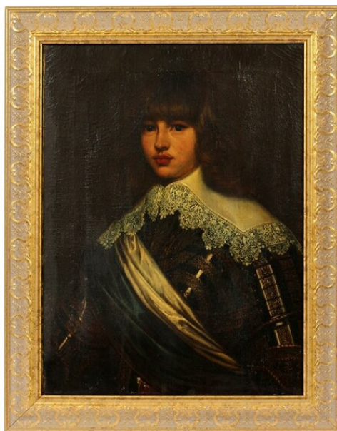
Принц Дании Вальдемар.

В 1640 году, когда дочери царя Ирине исполнилось 13 лет, царь решил выдать ее замуж. Для поднятия авторитета Романовых, Михаил Федорович решил выдать дочь за иностранного принца. Подходящий кандидат оказался в посольстве Дании. Принц Вальдемар был согласен на брак при ряде условий, одно из которых сохранение протестантской веры. Все шло хорошо и за несколько недель до свадьбы Михаил пригласил Вальдемара к себе и заявил: «Король, твой отец, велел тебе быть у меня в послушании; мне угодно чтобы ты принял православную веру». Королевич отказался наотрез, несмотря на угрозы и обещания, за что был заперт под домашний арест на четыре года и отпущен только после смерти Михаила Федоровича его приемником Алексеем Михайловичем.