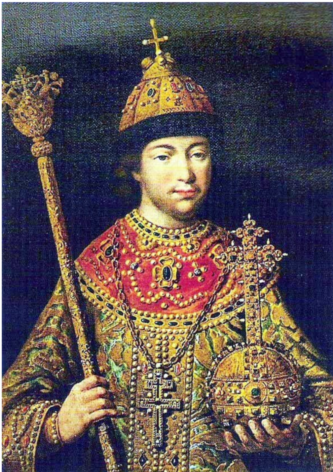
Михаил Федорович Романов, 16 лет.

Когда Михаилу Федоровичу исполнилось 20 лет пришло время ему жениться. На роль царской невесты претендовало множество девиц из знатных родов. Михаил взял в жены подругу детства Марию (в последствии Анастасия), дочь небогатого, незнатного дворянина Ивана Хлопова. Резкое возвышение Хлоповых в самые верха не понравились знати, было решено расстроить свадьбу. Недруги решили воспользоваться слабостью Анастасии к слад-