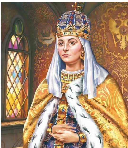
Евдокия Лукьянова Стрешнева.

Вторая невеста Мария Владимировна умерла через 5 месяцев после свадьбы. Следующий раз царь женился в 1626 году, на очень бедной дворянке Евдокии Лукьяновой Стрешневой. Все были против этого брака и даже мать царя от мнения которой он был очень зависим, но в этот раз Михаил настоял на своем решении и оставил его неизменным. Когда бояре приехали к отцу Евдокии чтобы объявить о великой чести, застали его за сохой, будущий царский тесть был настолько беден, что был вынужден сам пахать землю. После переезда в Москву, Стрешнев повесил свою старую одежду на стену в новых палатах, чтобы не возгордиться.