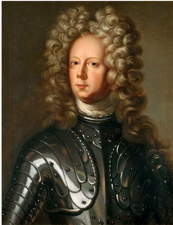
Фельдмаршал Карл Густав Рёншильд.

Довольный остроумным ответом, Петр велел вернуть фельдмаршалу его шпагу.