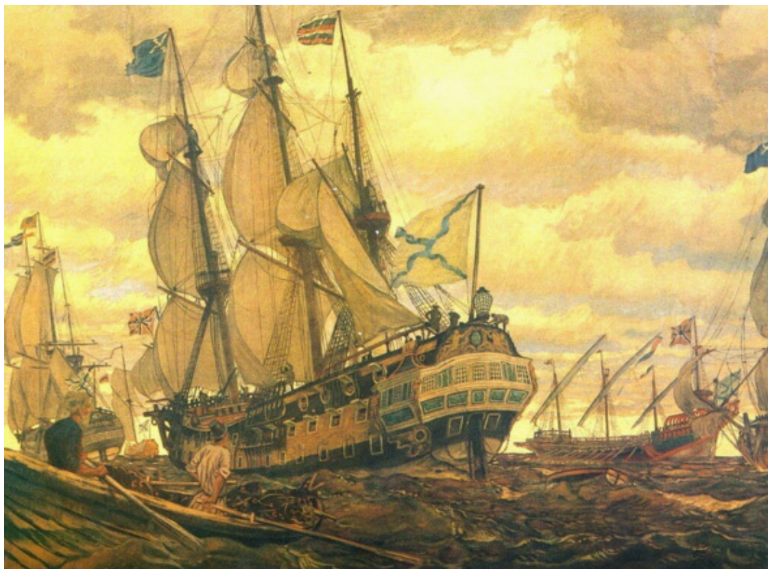
Корабль времен Петра I.

Тот ответил, как узнал науки, император проэкзаменовал калмыка и назначил его мичманом, а барина матросом в его команду.