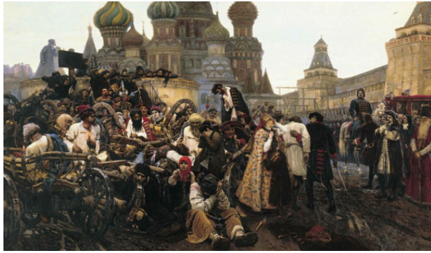
Утро стрелецкой казни. Красная площадь.