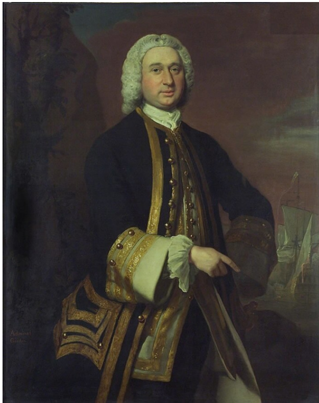
Ягужинский Павел Иванович.

Царь, погруженный в свои мысли, рассмеялся и замолчал.