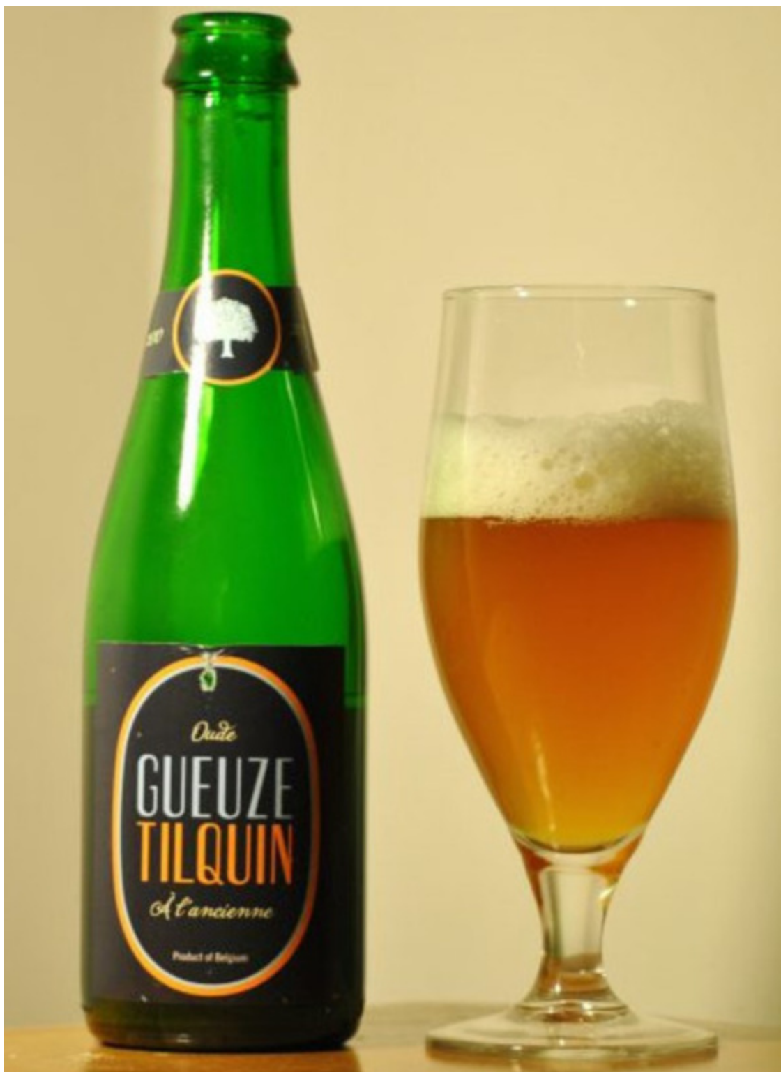
Гёз (Gueuze).

Гёз в статье «IPA или APA? Как разобраться в модных сортах крафтового пива», подготовленной Машей Все-Таки / ИА «Диалог», охарактеризован следующим образом [3]: