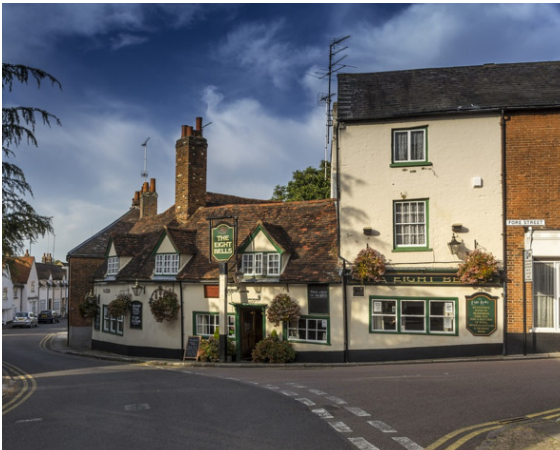
Паб Англия Пиво Але

Термин «пивоваренное ремесло» является наиболее всеобъемлющим термином для обозначения событий в отрасли, последовавших за микроварением конца 20-го века. Определение не совсем соответствующее, оно обычно применяется к относительно небольшим, независимым коммерческим пивоварням, использующим традиционные методы пивоварения и подчеркивающим вкус и качество.