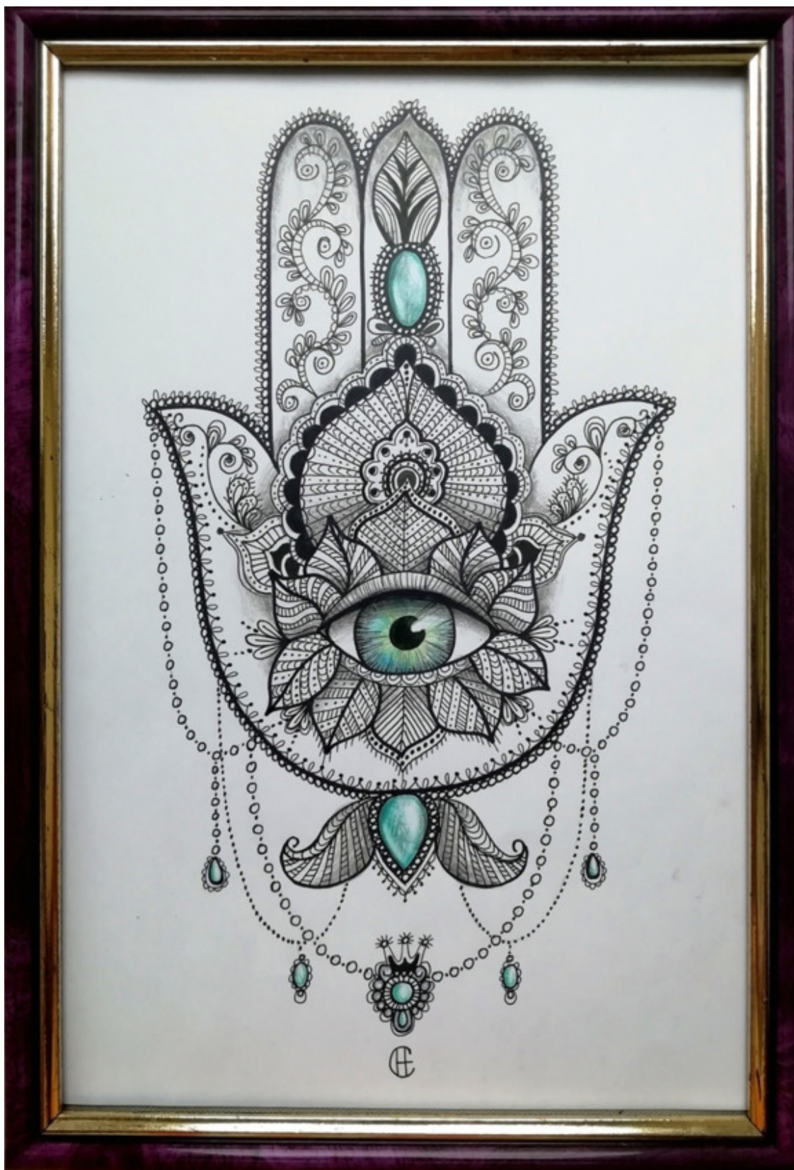
Рисунок Светланы Новиковой.