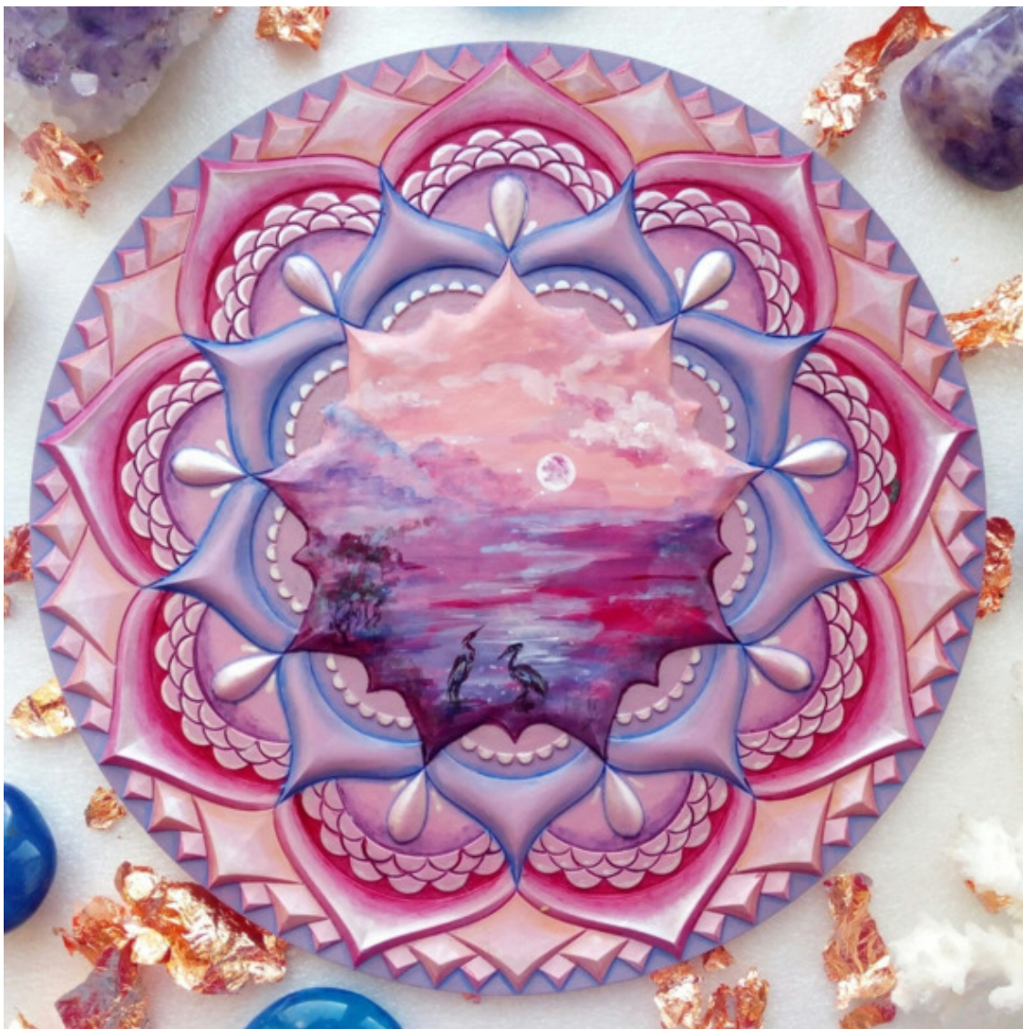
Автор работы и фото: @natanigma.