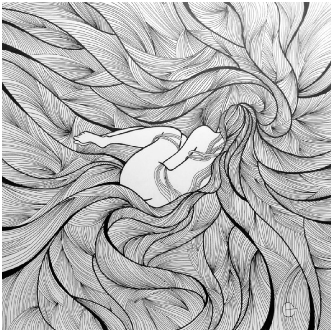
Рисунок Светланы Новиковой.