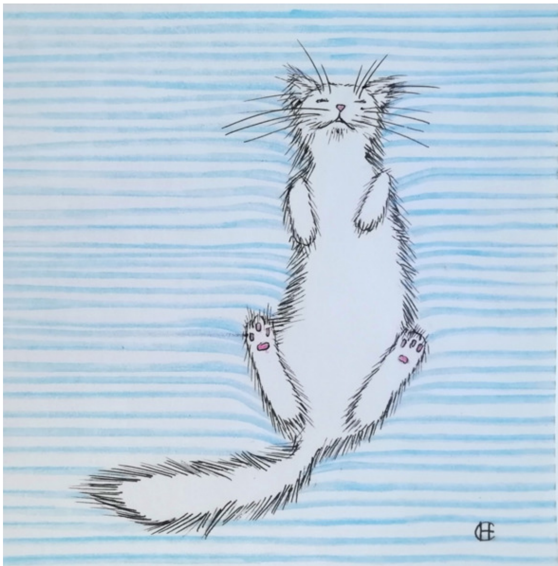
Рисунок Светланы Новиковой.