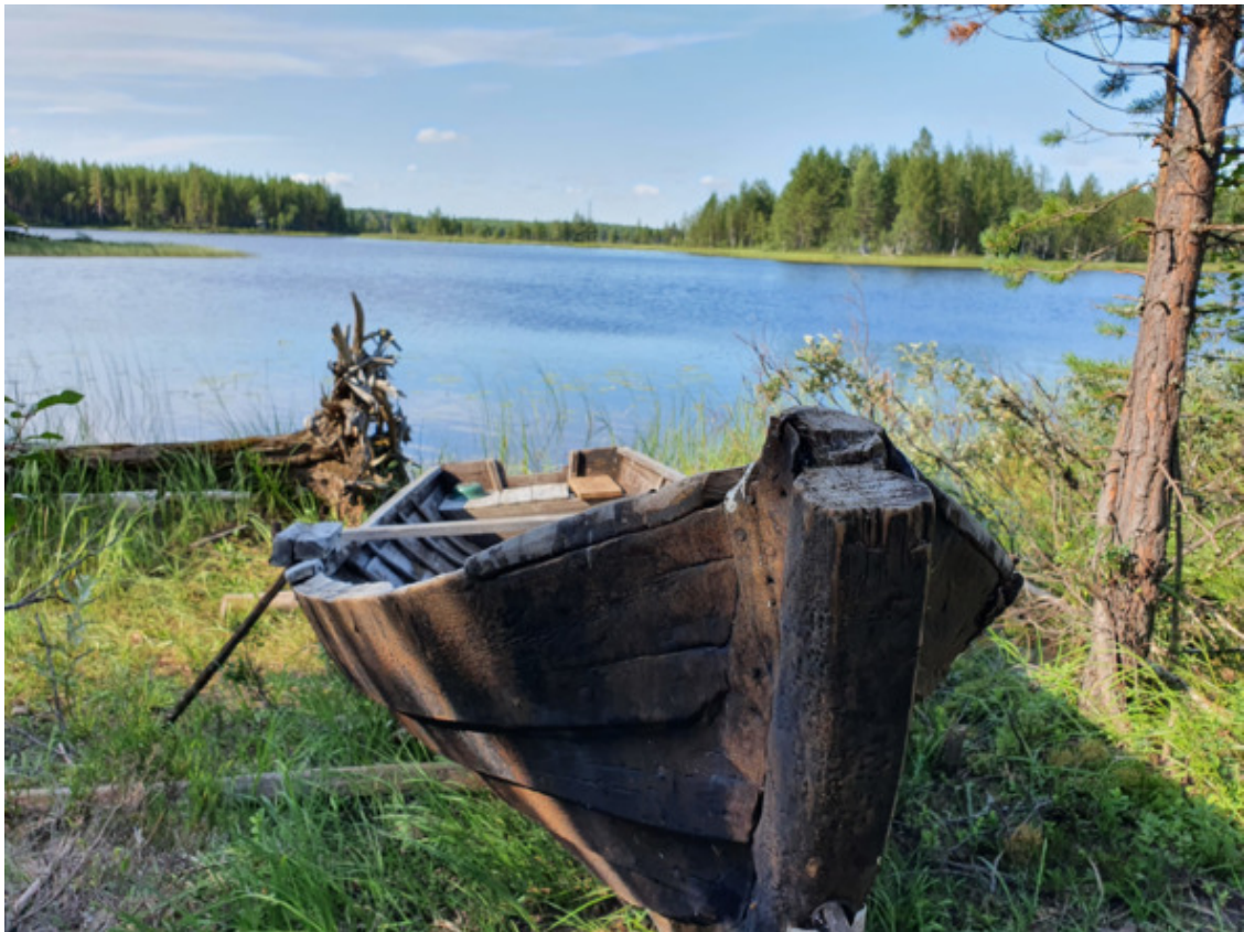
Северная Карелия. Россия. Лето 2020.