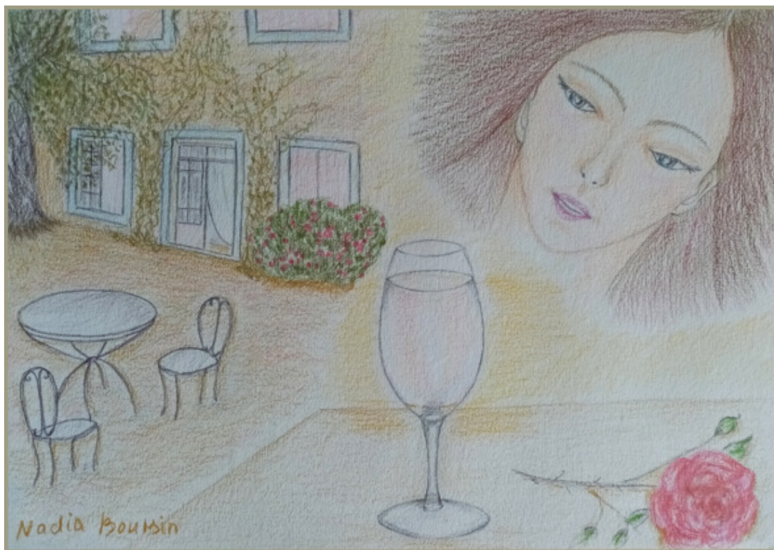
Рисунок Dana Derville.

Энергия слов творит чудеса. Ты только поверь и дождись, отбрось все сомненья, тревоги и страх, и в космос легко отпусти.