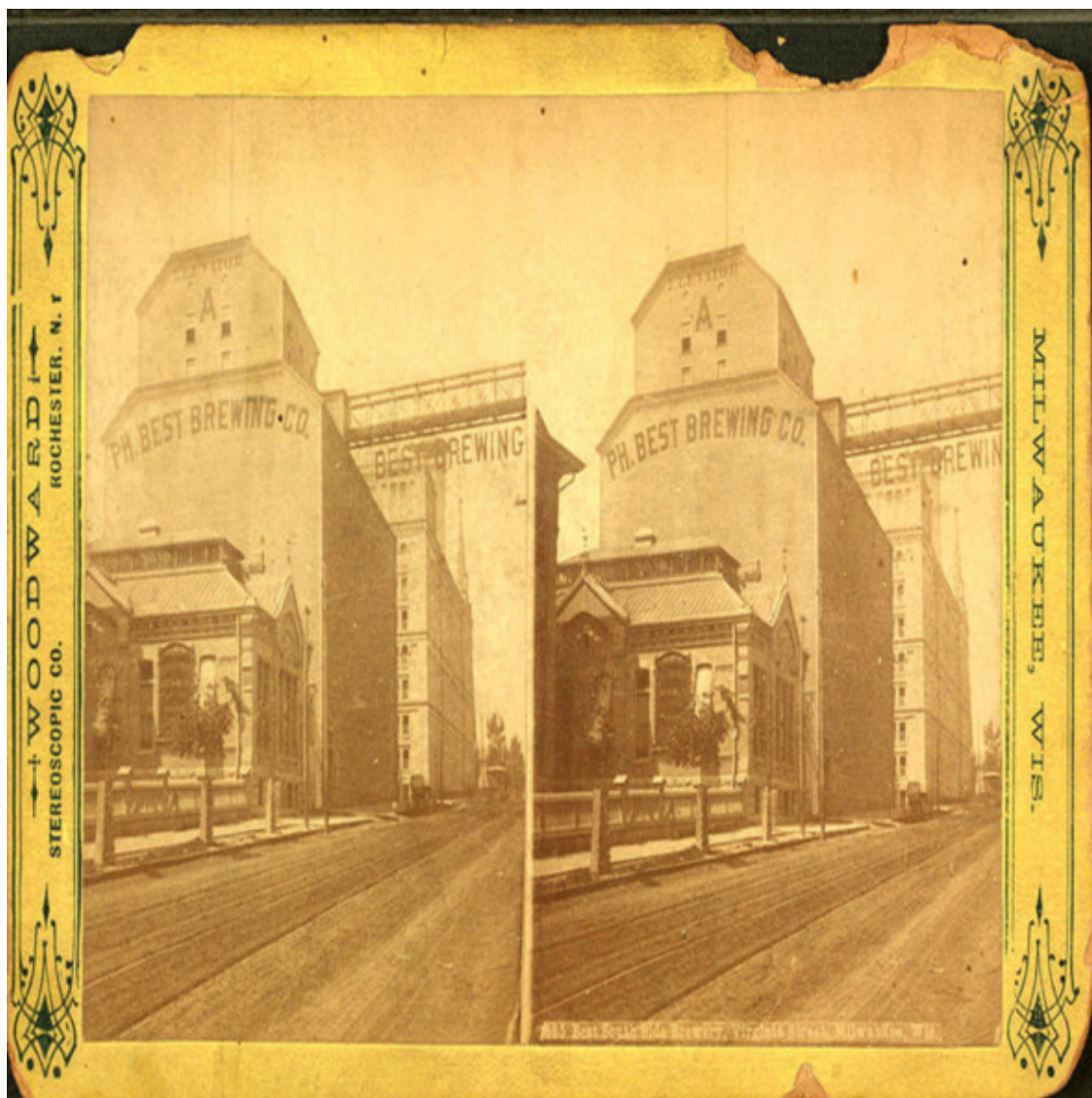
Best Brewing Co., Джуно Авеню, Милуоки, Висконсин, около 1885 г. Вудворд, Ч.В. (Чарльз Уоррен) – Издатель – Это изображение доступно в Цифровой библиотеке Нью-Йоркской публичной библиотеки под цифровым идентификатором G92F091_039ZF: digitalgallery.nypl.org → digitalcollections.nypl.org Источник: https://en.wikipedia.org/wiki/Beer_in_the_United_State