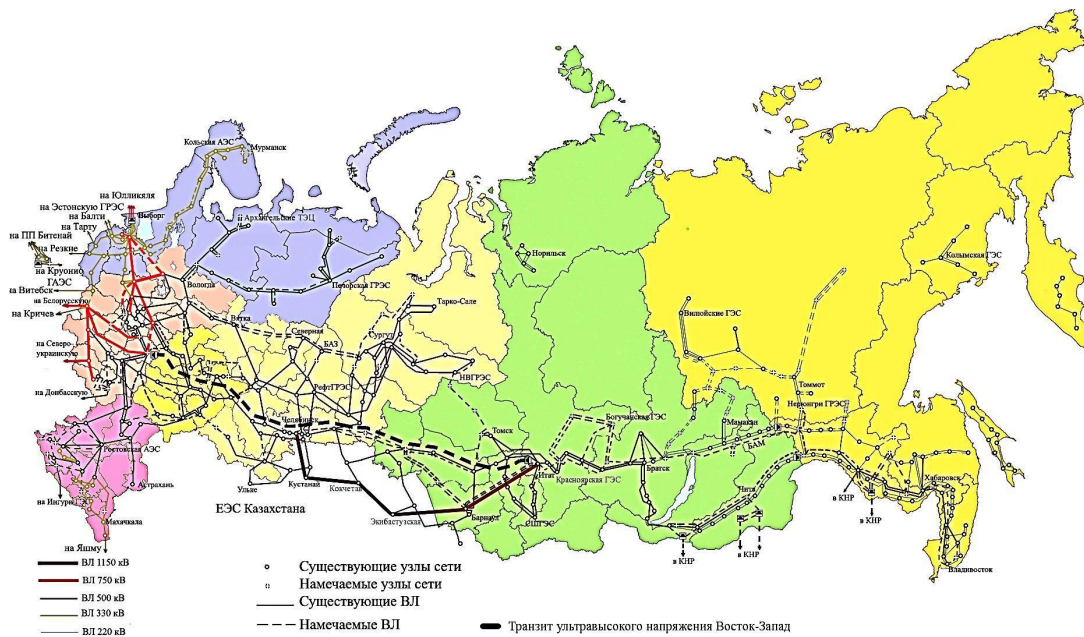
Рис. 2. Единая энергетическая система России