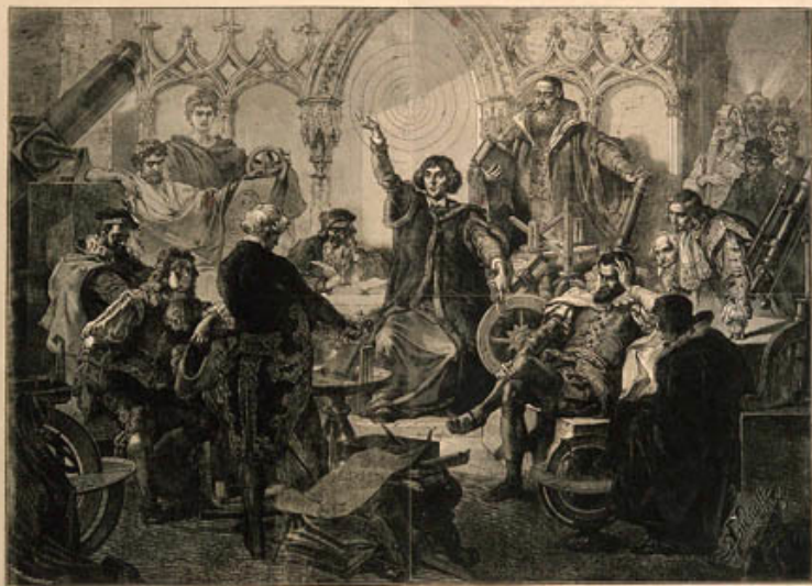
NICCOLO COPERNICO FRA GLI ASTRONOMI DEL MONDO:

Hipp. Antiochen. Ephesius, Ptole. Astronomus Aegyptius, Ptole. Aegyptius, Hipparchus, Copernicus, Galileus, Keplerus, Newtonus, Laplaceus, etc.