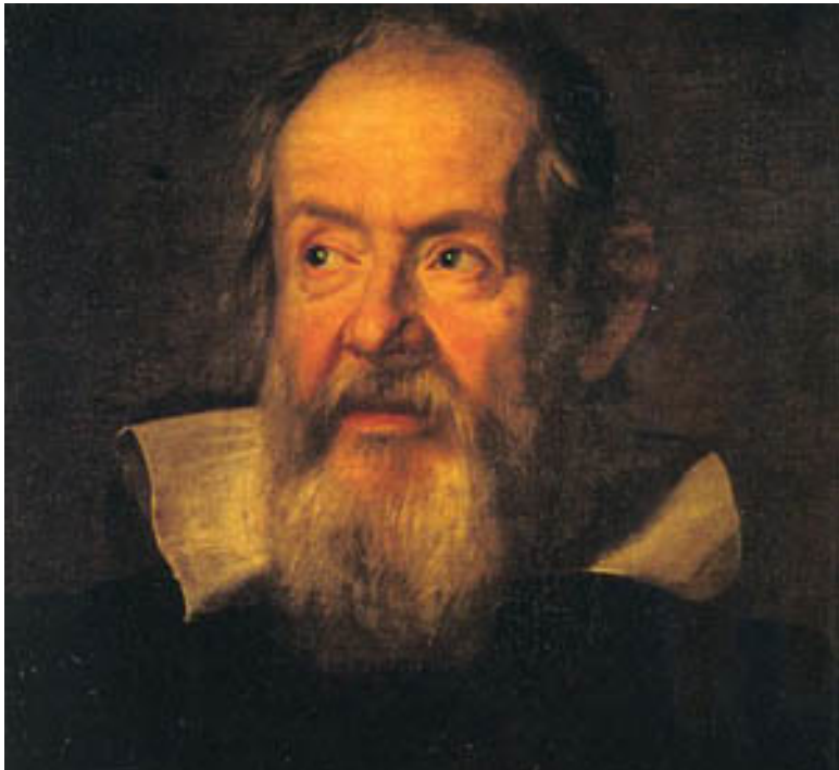
Галилео Галилей (1564—1642)