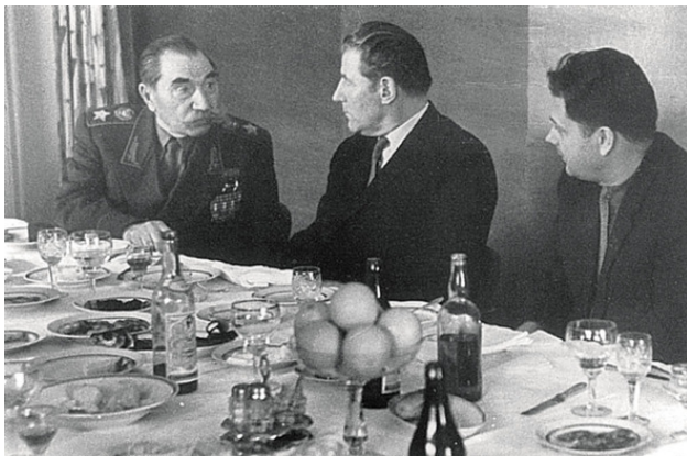
Маршал С. М. Буденный, первый секретарь Ростовского

ми в союзной и республиканской иерархии 61 . Кадровая мобильность в СССР была довольно высокой – сложившейся практикой было перемещение руководителей по горизонтали из небольших территорий в более крупные и далее наверх – в республиканское или союзное руководство. Часто использовалась технология переброски управленцев из вышестоящей организации на более статусные руководящие позиции в структурах меньшего масштаба.