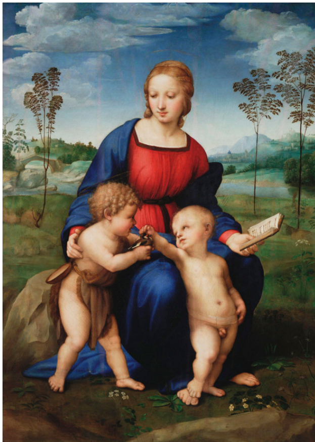
Мадонна со щеглом ок. 1506

И хотя Господь умер, воскрес и восседает во славе, Он был на Земле младенцем, Его растила и воспитывала Мария. И об этом нельзя забывать. Книга посвящена тем людям, которые чтут Господа Иисуса Христа и почитают Его Матерь.