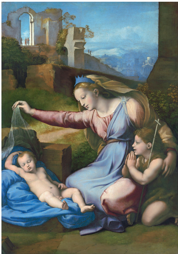
Мадонна с диадемой ок. 1510—1511 г.

Я люблюсь словами, оттенками разными звуков, От обилия красок приходит блаженный восторг. Красоту создавать, о какая должна быть наука, Чтобы звук Тишины – и такое блаженство исторг!