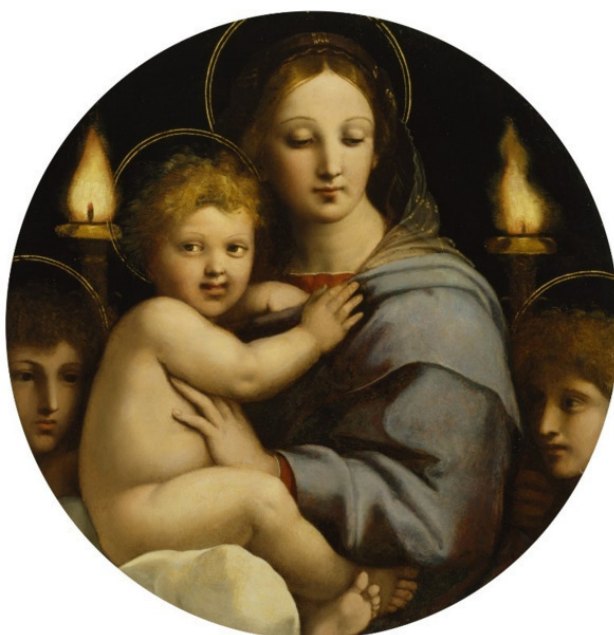
Мадонна с канделябрами ок. 1513—1514 г.