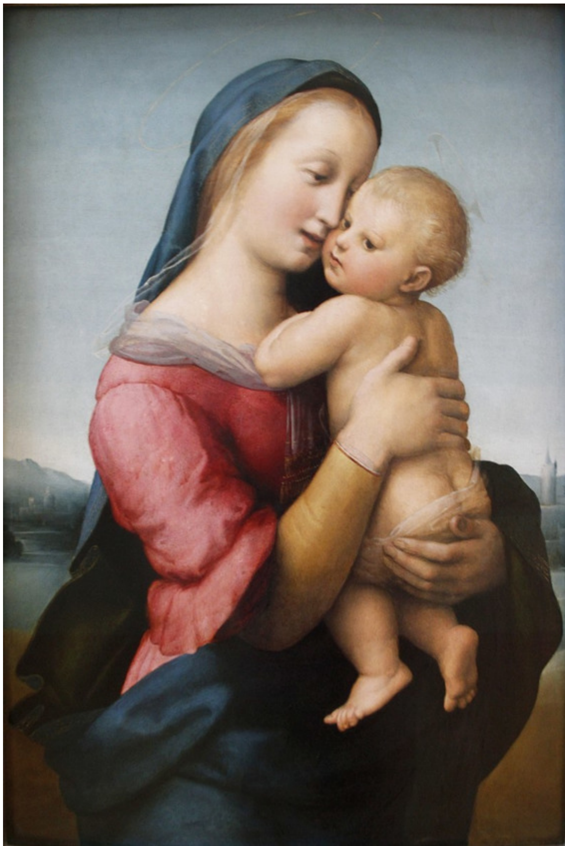
Мадонна Темпи 1508 г.