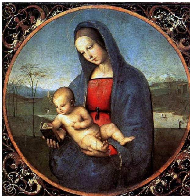
Мадонна Конестабиле ок. 1504 г.