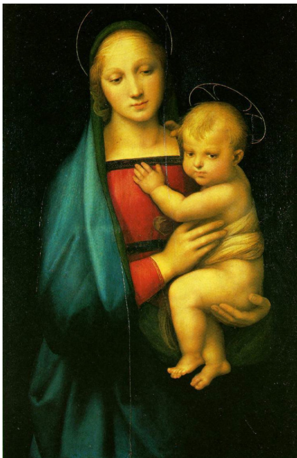
Мадонна Грандука ок. 1504 г.