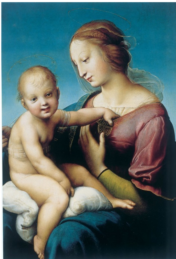
Большая Мадонна Каупера 1508 г.