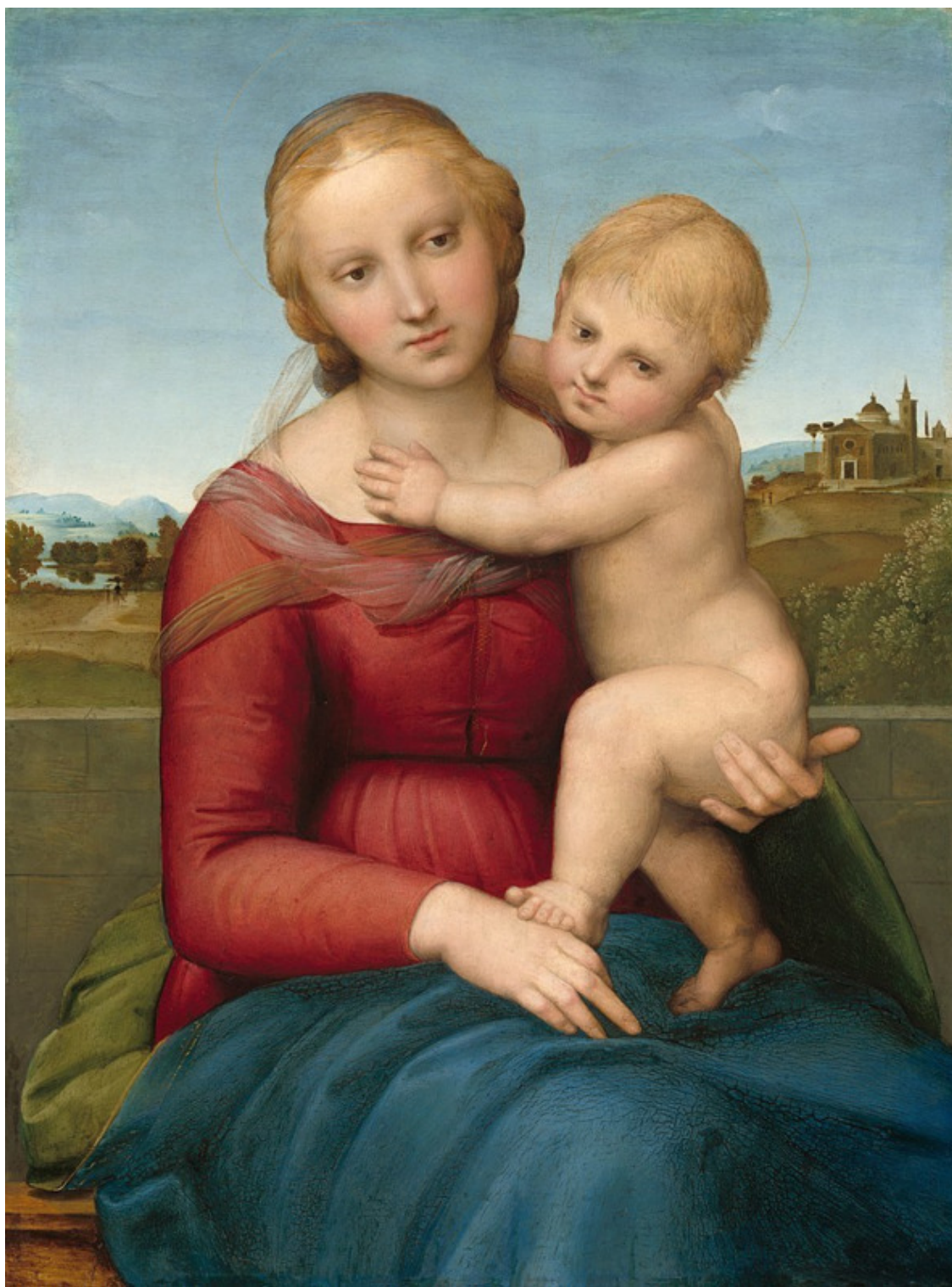
Малая Мадонна Рафаэля ок. 1504—1505 г.