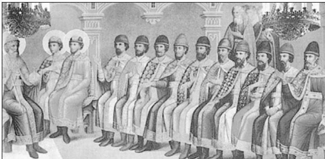
Великий князь Владимир Святославич с сыновьями. Фрагмент росписи стены Грановитой палаты Кремля

Впрочем, даже эти немногие строки – всего лишь дискуссионная гипотеза. Вокруг Владимира, его женитьбы, его детей и его политики развернулось так много споров, что одно только перечисление разных точек зрения заняло бы с десяток страниц, утомило читателя и лишило книгу всякого динамизма, не приблизив ни на йоту к ответам на вопросы.