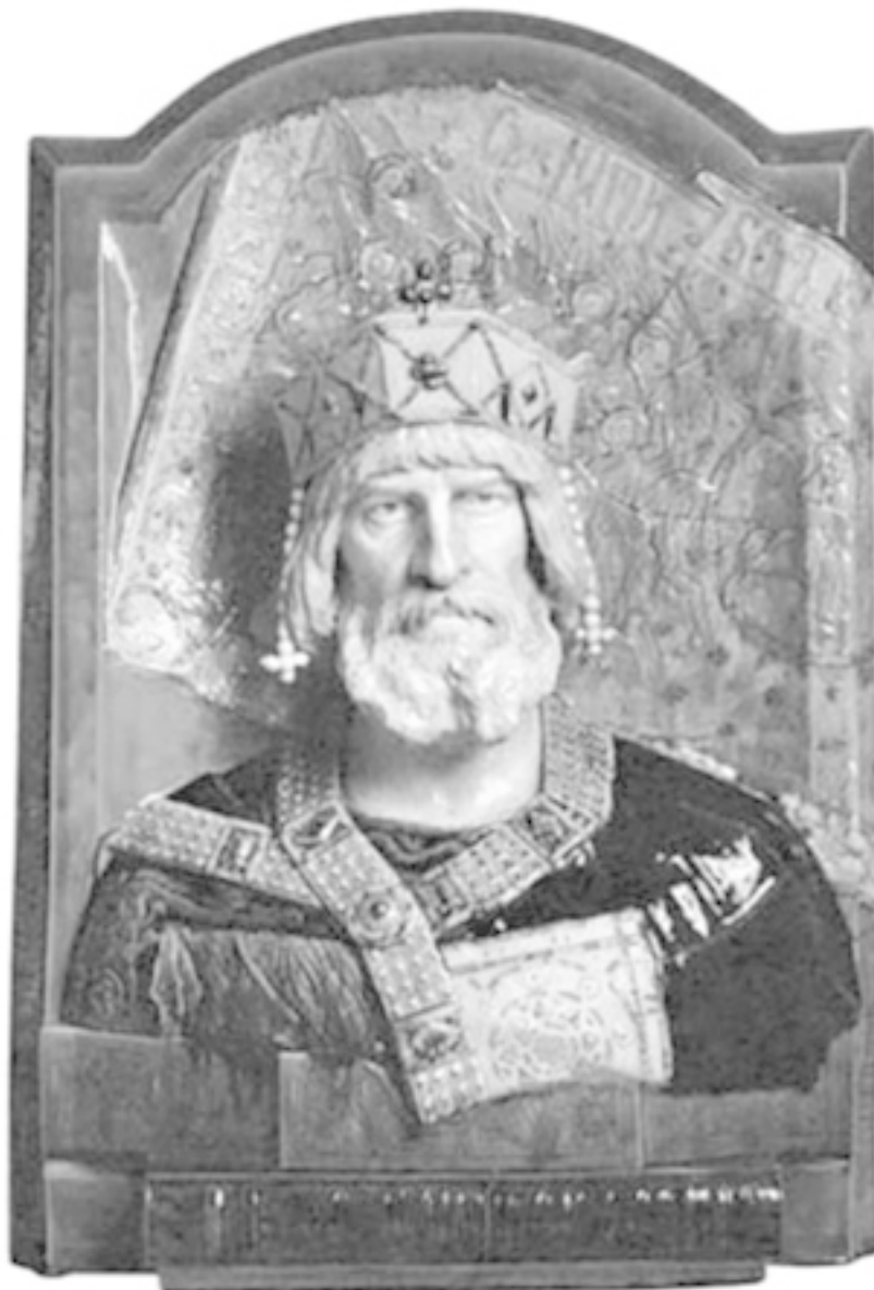
Ярослав Мудрый. Скульптор М. Антокольский

Ярослав Мудрый подарил Руси покой и расширил границы. Значит, сделал для нас, русских, то, что должен делать эффективный политик, который не разворачивает страну под видом политической стабильности и не пугает призраками фашизма, коммунизма, либерализма, не призывает сплотиться вокруг собственной семьи и богатств кучки своих сотоварищей. То есть перед нами не какой-нибудь коррумпированный «птенец гнезда Петрова» (читатель не заподозрил, что мы имеем в виду птенца какого-то иного, более близкого по отношению к нам гнезда?), а здравый политик.