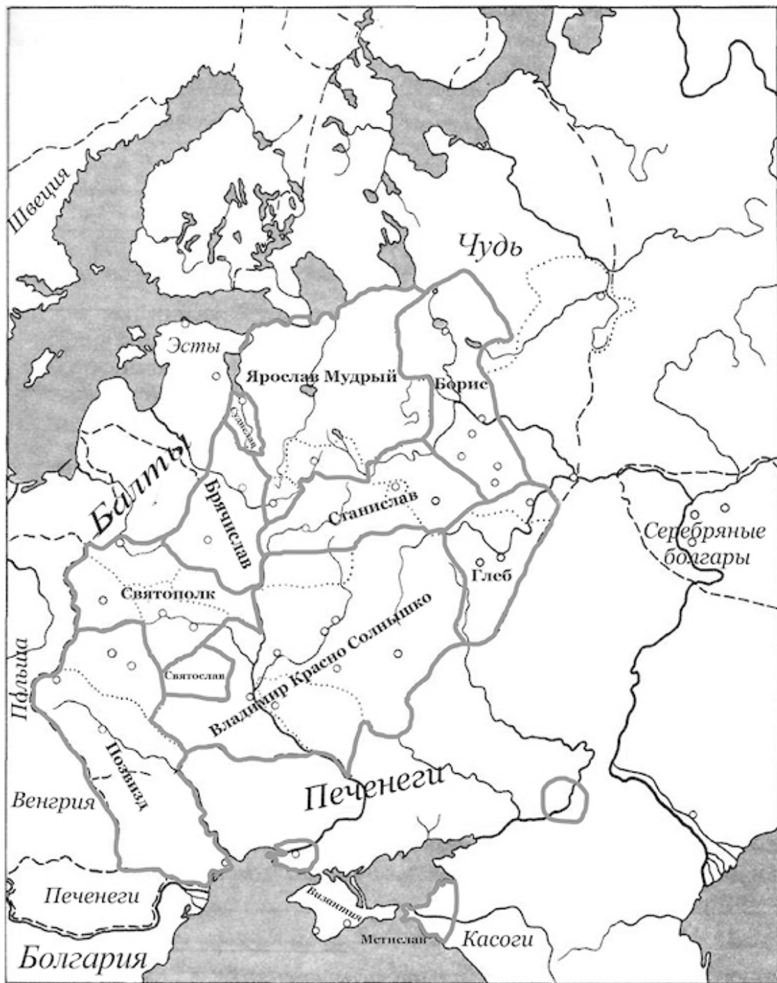
Древняя Русь, 1015 год

Умирал князь Владимир мучительно. Мучила не только болезнь, но и совесть, и неспособность к решительным действиям. Совесть... Он ведь убил своего брата Ярополка, чтобы прийти к власти. Ну, не своей собственной рукой, просто заманил в ловушку и приказал двум наемникам-варягам совершить убийство. Те подняли Ярополка мечами «под пазухи», как говорит летопись... После этого Владимир перебил «светлых князей», которые правили отдельными племенами, и создал обширную страну. Супругу убитого брата, православную гречанку, взял в жены.