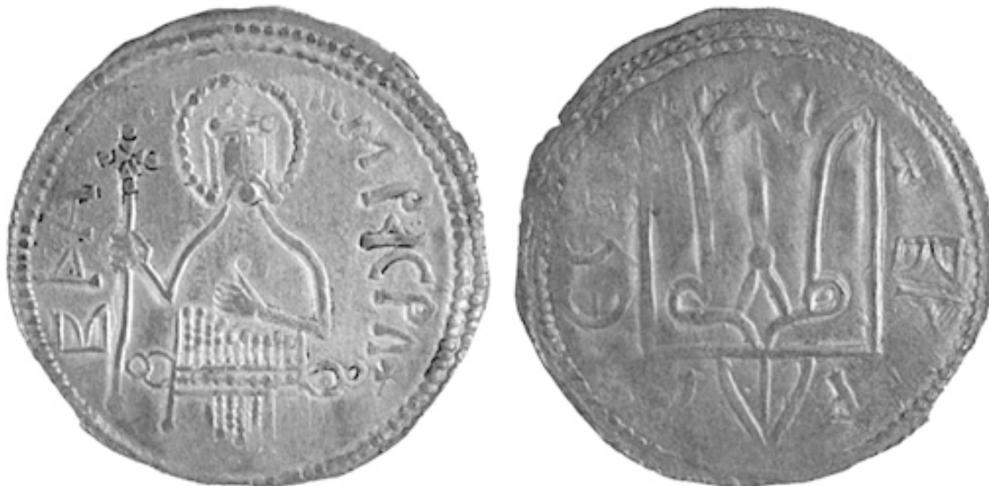
Монета Владимира Святославича. Начало XI века

Сын восстал против отца. Что делать с сыном? Полоцкая земля волновалась. Тамошняя община хотела своего князя. Может быть, существовала даже опасность, что две или три ветви кривичей соединятся и выступят против Киева.