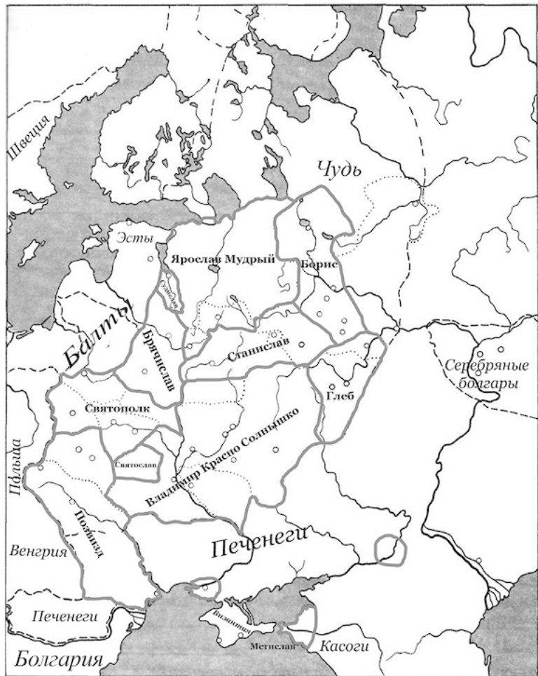
Древняя Русь, 1015 год