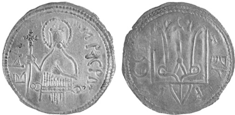
Монета Владимира Святославича. Начало XI века

Кривичи жили в Смоленске, Пскове и Полоцке... Тогда нужно разобщить недовольных и устранить угрозу. Например, какую-то часть кривского племени освободить, а какую-то – нет.