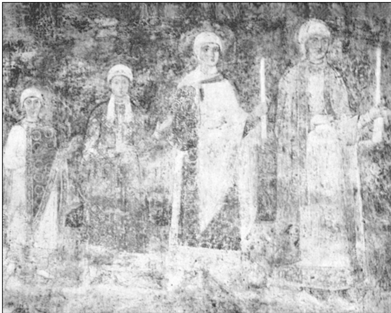
Жена и дочери Ярослава Мудрого. Фреска центрального нефа Софийского собора в Киеве

Назаренко безусловно прав вот в чем. Подлинный натиск Запада на Восток начался в XIII веке. Но не в результате провала Крестовых походов на Ближнем Востоке, как пишет этот автор. Отнюдь нет! В палестинском Заморском королевстве (Утремер) доминировали французы. Когда они стали терпеть неудачи, то переключили внимание на Византию и захватили Константинополь (1204), а до Руси не дошли.