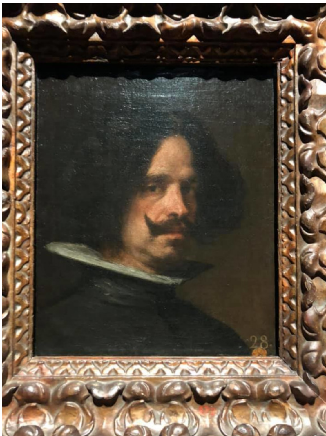
Троппо веро! Автопортрет.