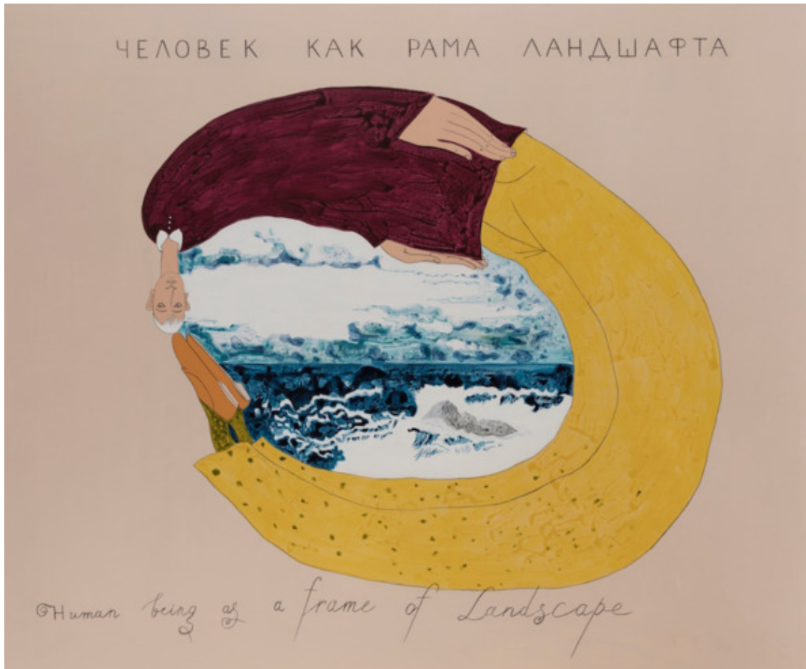
Павел Пепперштейн. Человек как рама ландшафта. 2018.

«Не счесть чудес творимых фоном» – выдыхаю словесно чисто зрительную эмоцию встречи с облачным перформансом двойного фонового эффекта.