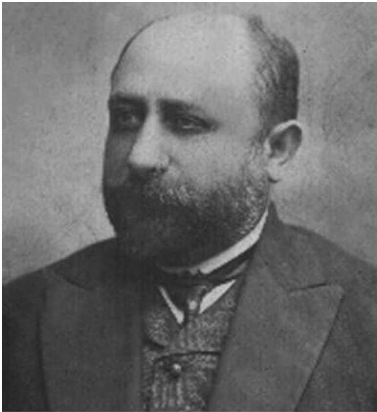
Дедушка Гиля до революции

Евреи составляли около трети населения города. Жизнь текла спокойно, но восемнадцатого и девятнадцатого октября 1905 года погромщики сожгли в Ромнах все еврейские