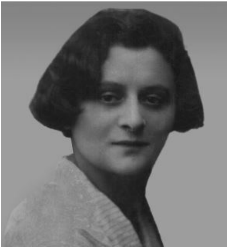
Мама, около 1930 г.