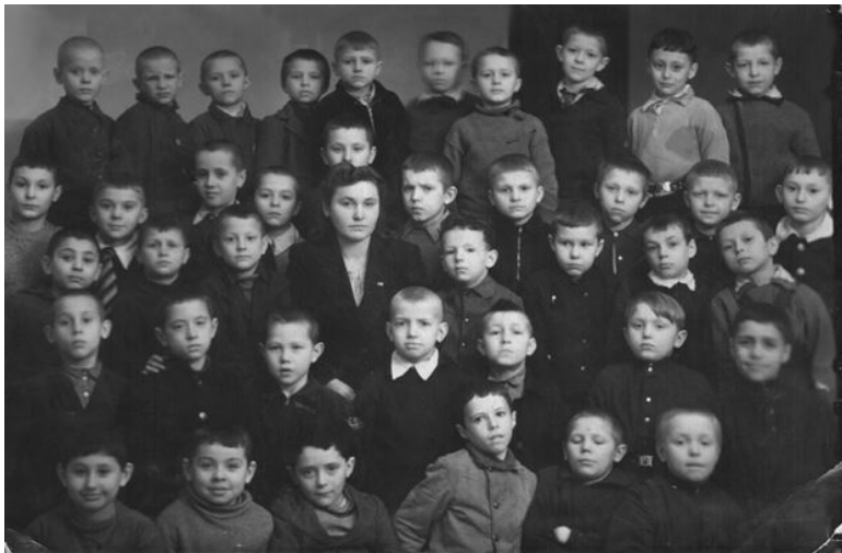
Второй «Д» класс, декабрь 1946 г. Я – третий слева в нижнем ряду

Хотя после снятия блокады прошло полтора года, и нанесенные городу раны начинали исчезать, следы войны встречались на каждом шагу. Помню, что в том же дворе, где стоит моя первая школа, чуть дальше от Невского, в направлении ул. Восстания, находились развалины жилого дома, и иногда в хорошую погоду мы забирались в эту «разрушку». Мне кажется, я и сейчас чувствую запах висящей в воздухе кирпичной пыли. Она золотилась в солнечных лучах, проникавших сквозь выбитые окна и разбитые стены. Вдоль каких-то ограждений тянулись плохо теплоизолированные трубы мет-