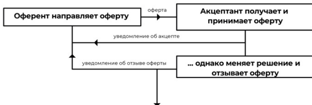
Таблица № 3 – Отзыв акцепта

Акцепт считается отозванным только в том случае, если уведомление об отзыве получено оферентом ранее или в момент получения уведомления об акцепте.