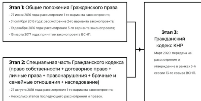
Таблица 1. Законодательный процесс принятия нового Гражданского кодекса.

Запланированный к принятию в 2020 году Гражданский кодекс должен заменить собой некоторые законы, в том числе Закон «О договорах», который аналогично Общим нормам войдет в кодекс в качестве одного из его разделов.