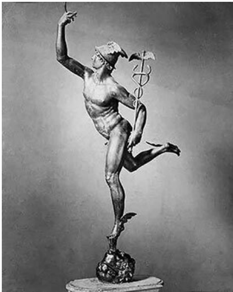
Джамблонья; Меркурий, 1564 г.