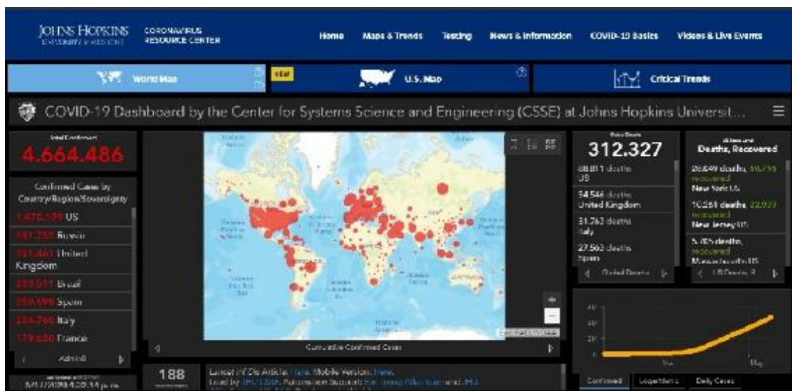
Ilustración 8 Casos de contagiados a 17 de Abril del 2020

Así a 17 de Abril del 2020, el número de afectados por COVID-19 a nivel mundial son de 4.664.486 distribuidos entre 188 países, de los cuales EE.UU. cuenta con 1.470.199 afectados, seguido de Rusia con 281.752 e Inglaterra con 241.461; situándose España en la posición quinta con 230.698 casos (ver Ilustración 8 ).