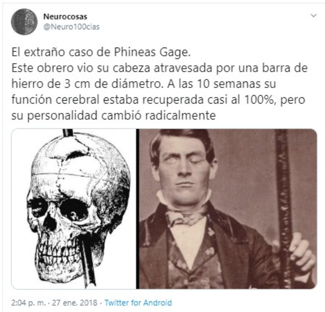
Ilustración 6 Tweet sobre Phineas Gage

Así uno de los casos más reconocidos en la historia de las neurociencias es el de Phineas Gage (Damasio, 2018), quien sufrió un accidente laboral en una mina donde trabajaba, con tan mala suerte que una de las barras le atravesó el cráneo, a partir de entonces, su comportamiento cambió siendo errático, imprevisible e incluso temerario (@Neuro100cias, 2018) (ver Ilustración 6 ).