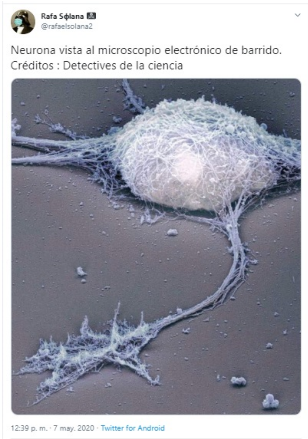
Ilustración 1 Tweet Neurona al Microscopio Electrónico

Hay que aclarar que hablar de las neurociencias y del cerebro es hoy en día bastante habitual, pero no siempre ha sido así, debido a que es un campo del conocimiento que ha surgido relativamente hace poco; aunque en sentido estricto no es posible decir que exista una neurociencia como tal, sino que es un conjunto de aportaciones de muchas ramas del saber que alimentan y conforman el cuerpo de las neurociencias; así si se tiene en cuenta su objeto de estudio, el sistema nervioso y su actividad,