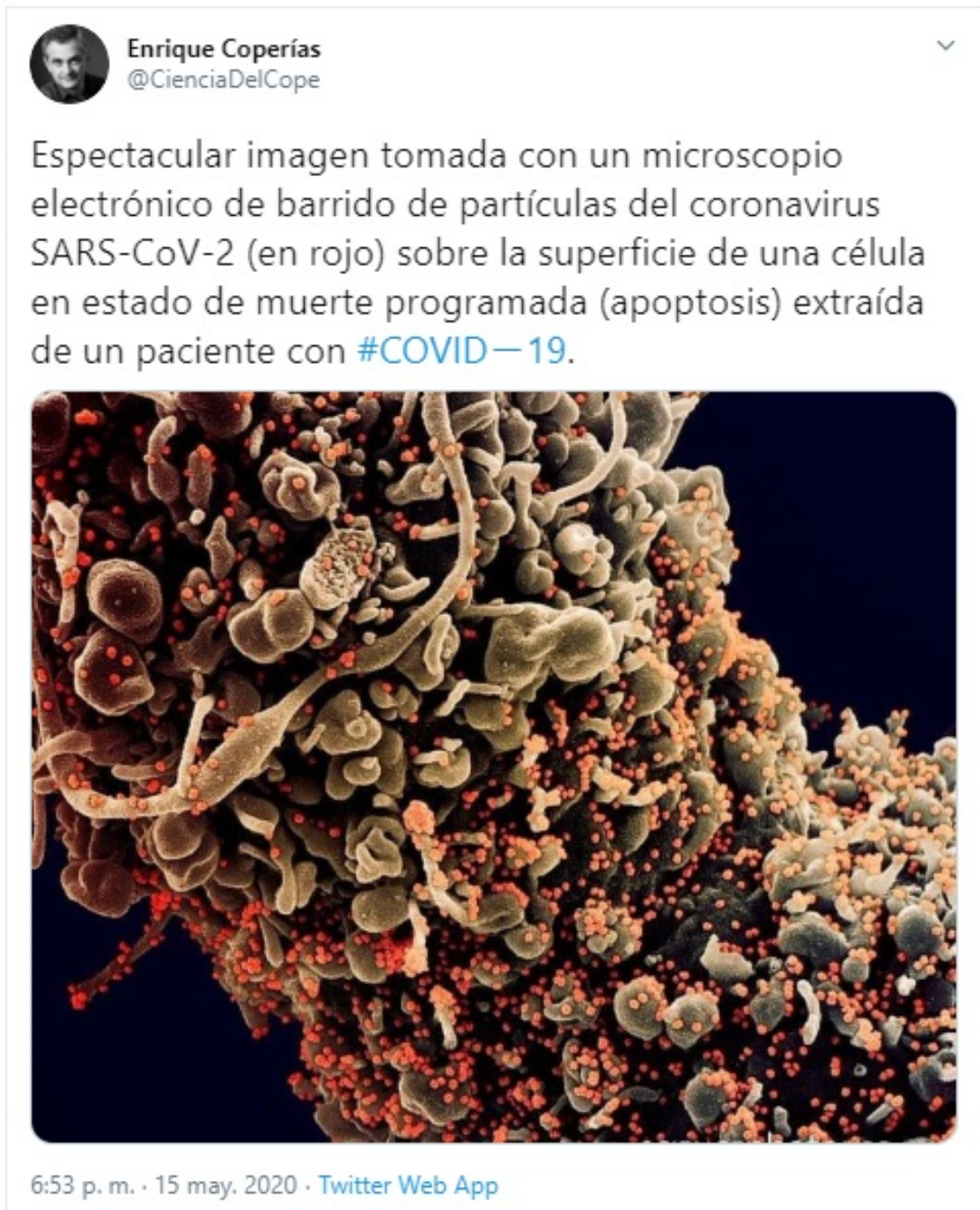
Ilustración 3 Tweet Apoptosis por COVID-19