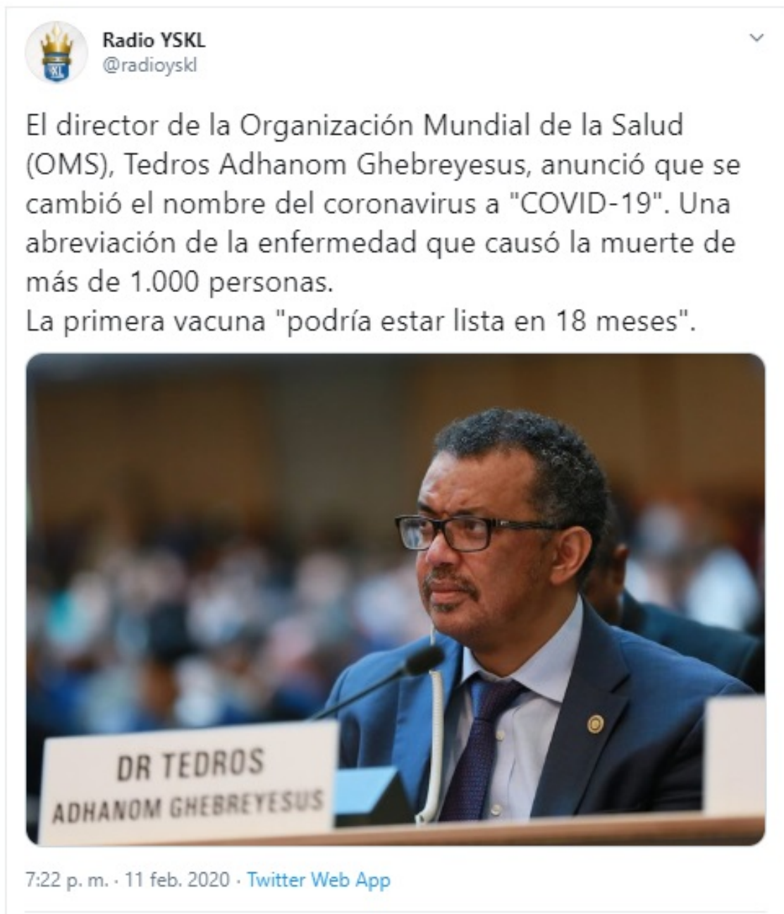
Ilustración 9. Tweet Denominación del COVID-19

De esta forma se pretendería eliminar las denominaciones de “virus de China” o “virus de Wuhan”, términos que apuntan directamente al foco del origen de la infección.