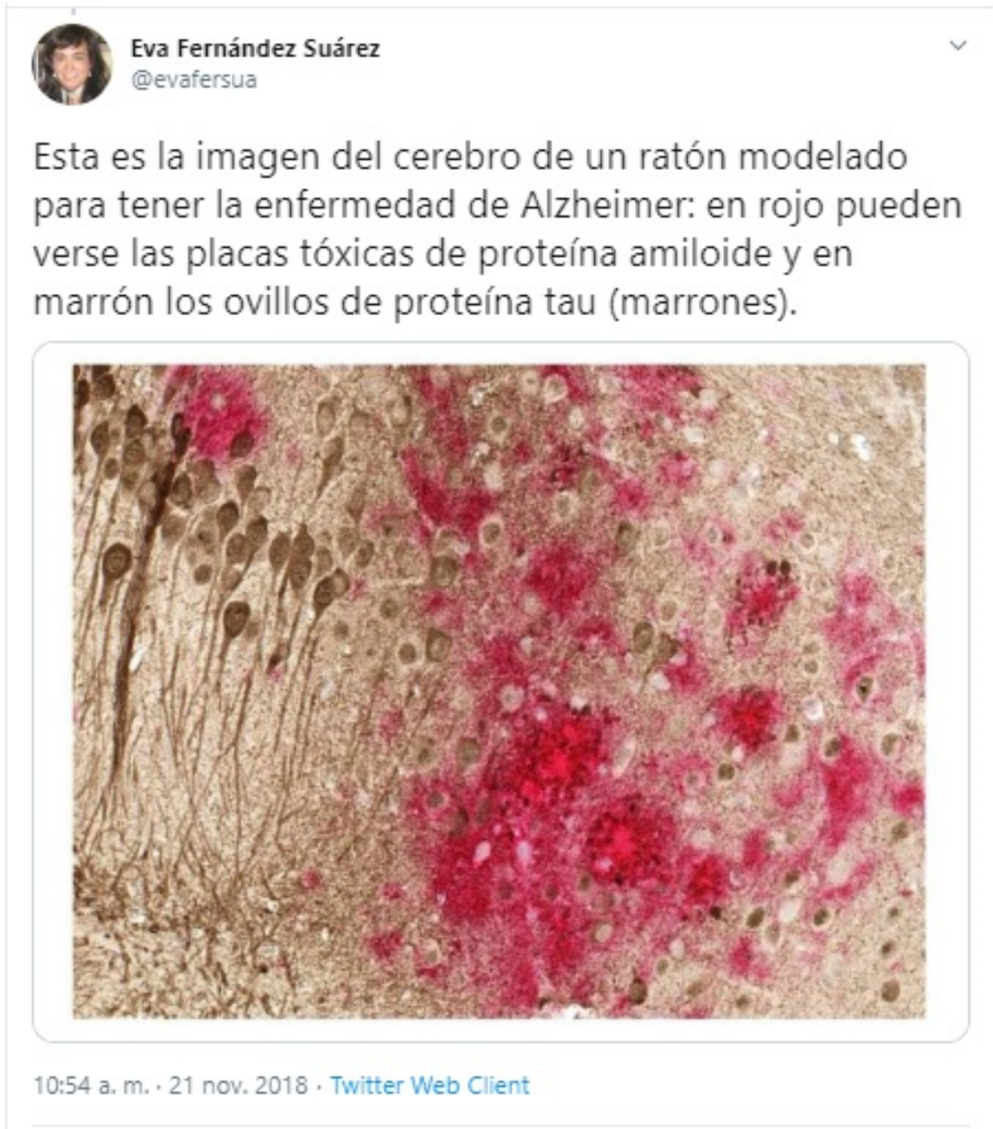
Ilustración 2 Tweet Cerebro con Alzheimer

Si bien hasta este momento se ha planteado el estudio del cerebro como si fuese este estático e invariable en el tiempo, esta idea se aleja mucho de la realidad, de hecho en el desarrollo del cerebro se pueden distinguir dos etapas claramente establecidas, antes y después de nacer, así y a diferencia de lo que sucede en otras especies, el cerebro humano está todavía sin terminar de formar en el momento del nacimiento, lo que conlleva que sea menos independiente, y que requiera de cuidados y protección durante más tiempo.