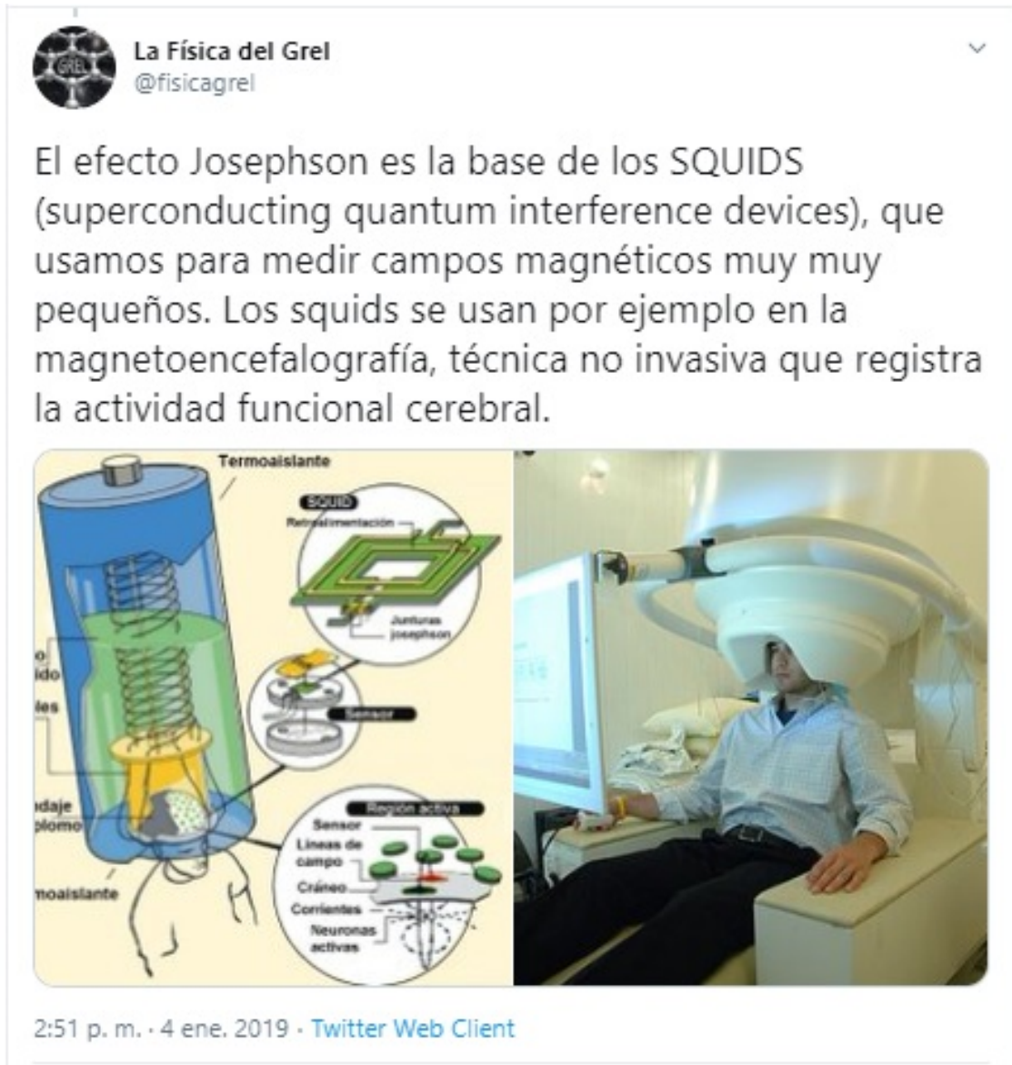
Ilustración 4 Tweet sobre Magnetoencefalografía

Igualmente se puede realizar una distinción entre las técnicas directas e indirectas del cerebro, siendo las primeras aquellas que trabajan directamente con el cerebro, ya sea empleando métodos invasivos o no invasivos, es decir, se refiere a todas las técnicas comentadas en el apartado anterior.