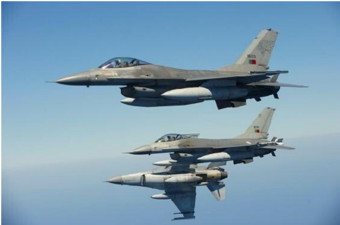
F-16 Fighting Falcons

A Roménia tinha comprado 12 aviões de combate F-16 excedentários em Portugal e cabia às Valquírias recolher e entregar o primeiro lote de seis aviões ao seu destino. O resto dos jactos seria entregue mais tarde aos romenos.