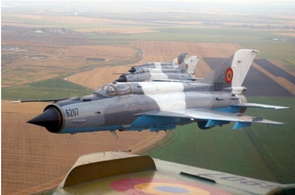
MiG-21s

O alcance dos MiGs era de apenas 685 milhas, e a viagem a Ciudad Real era de mais de 1.500 milhas, então os romenos instalaram tanques de combustível auxiliares sob as asas da aeronave. Mesmo assim, os pilotos tiveram de aterrar e reabastecer na Base Aérea de Amendola, no centro da Itália. A base foi usada pelos caças F-35 e pelos drones Predator, recentemente adquiridos pelos italianos.