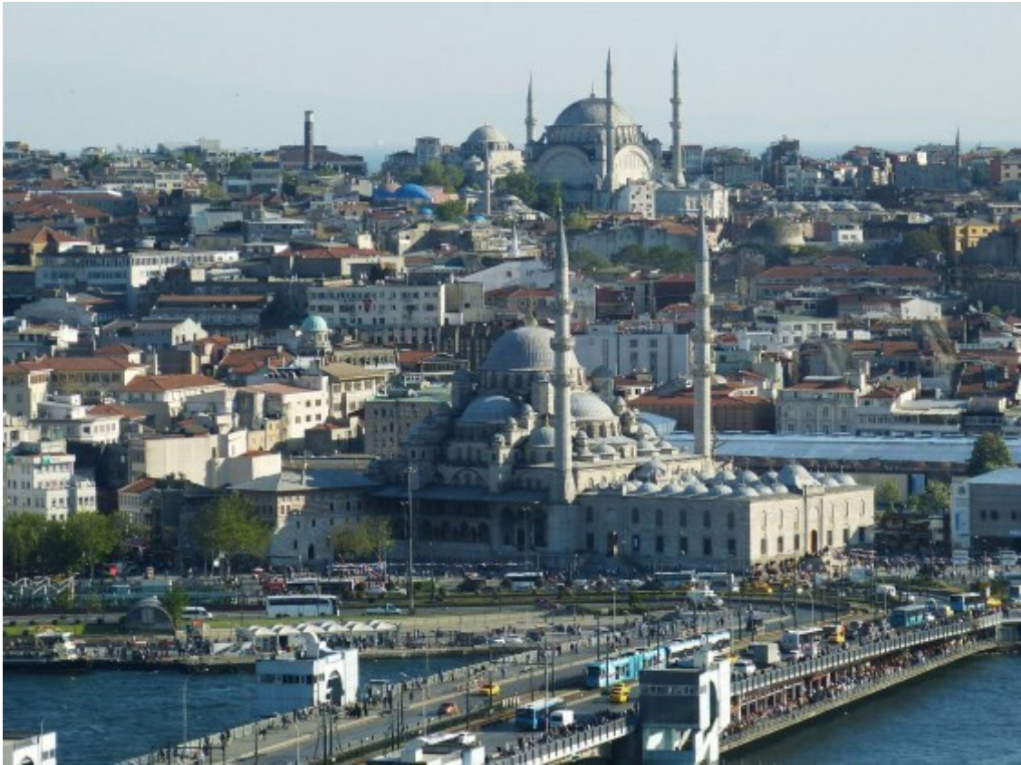
Vista de Istambul

Laurent e os seus homens foram até à casa de Hazinedar. A governanta disse que o patrão não estava disponível, mas isso não dissuadiu Laurent e os seus dois capangas de invadir a casa e encontrar Hazinedar na sua secretária. Quando o homem viu Belcour, entrou em pânico e tentou escapar pela outra porta, mas os homens de Laurent o prenderam e o colocaram em numa cadeira de frente para Laurent, que se sentiu confortável num sofá de couro.