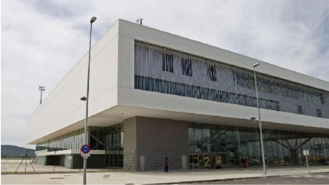
Terminal Ciudad Real