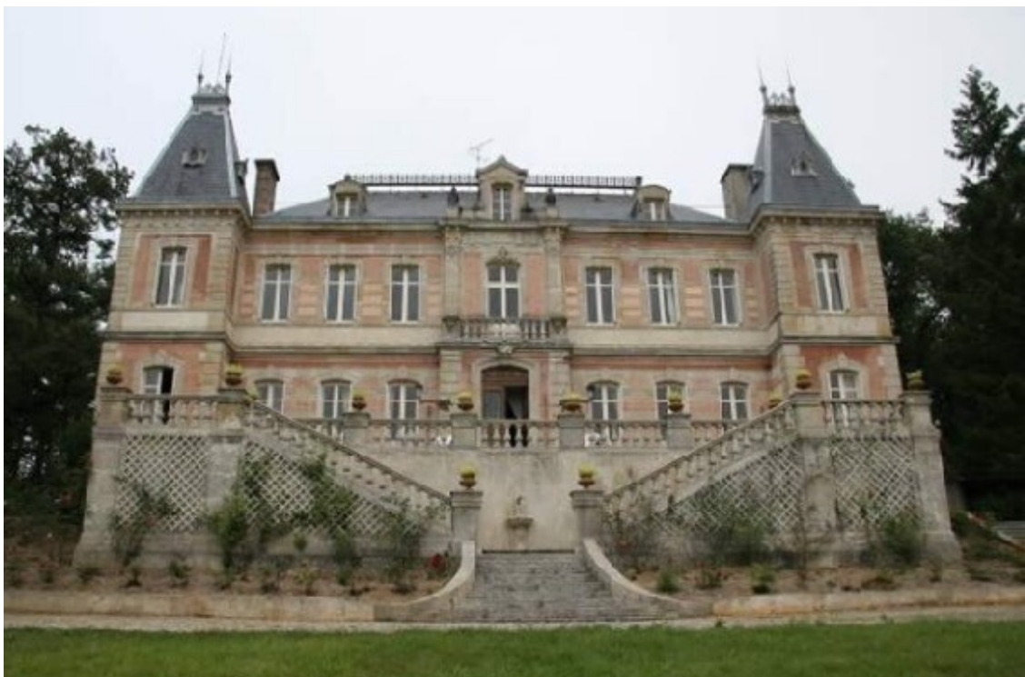
Castelo de Laurent Belcour

Tendo satisfeito temporariamente os seus desejos sexuais, Belcour apanhou um avião privado para o seu castelo na Provença. O governo havia tomado a propriedade quando o prenderam pela primeira vez, mas agora ele podia usar a casa enquanto esperava o processamento da papelada para que lhe devolvida a propriedade.