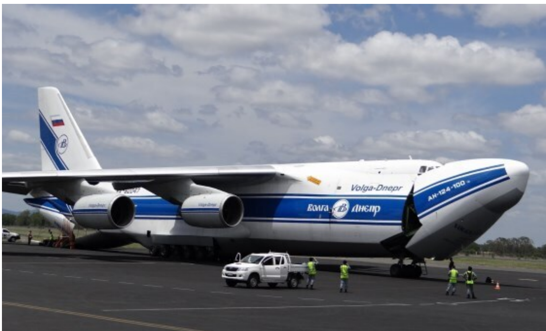
Avião de Carga Antonov

O enorme avião de carga estacionado longe do terminal. A frente da aeronave girou para cima e caiu no chão, mostrando a sua carga.