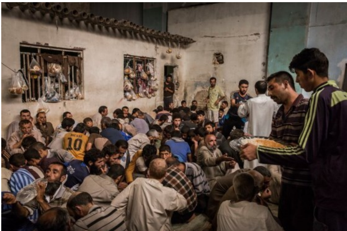
Detidos do ISIS na prisão de Mosul

O governo iraquiano construiu uma gaiola de madeira no meio da sala de audiências. Amarrados atrás das grades, os réus do ISIS capturados enfrentaram um painel de três juízes num banco alto, com duas bandeiras iraquianas atrás deles. Um advogado de acusação sentou-se abaixo da plataforma junto com os secretários cujo trabalho era registar os procedimentos. Os advogados ocuparam três fileiras de bancos atrás da jaula. As famílias dos réus não foram autorizadas a entrar na sala.