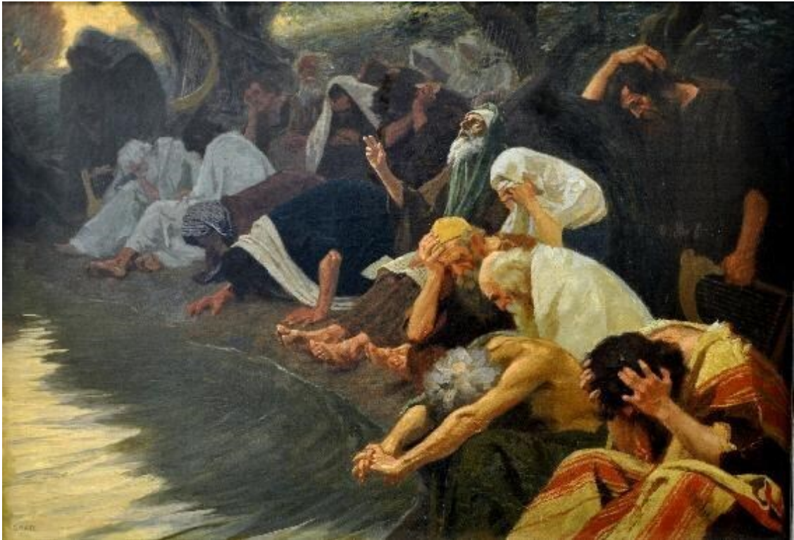
Gebhard Fugel, Sobre las aguas de Babilonia, Museo Diocesano, Freising.

Mientras que estos profetas anunciaban la liberación política de los hebreos de la servidumbre en Babilonia, el cristianismo, teniendo otras intenciones humanas, verá en sus textos inspirados los anuncios del Cristo Salvador, portador de la alianza nueva y definitiva. En el Evangelio, Jesús se refiere a Jeremías después de haber bendecido el pan eucarístico: «Después de la cena hizo lo mismo con la copa, diciendo: “Esta copa es la Nueva Alianza sellada con mi Sangre, que se derrama por vosotros”» (Lc 22, 20).