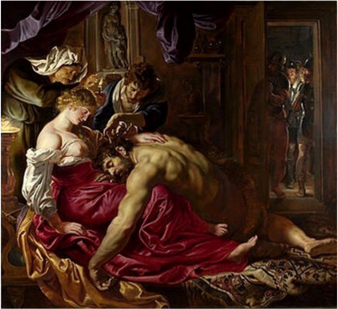
Pieter Paul Rubens, Sansón y Dalila, óleo sobre tabla, ca. 1609, National Gallery de Londres.