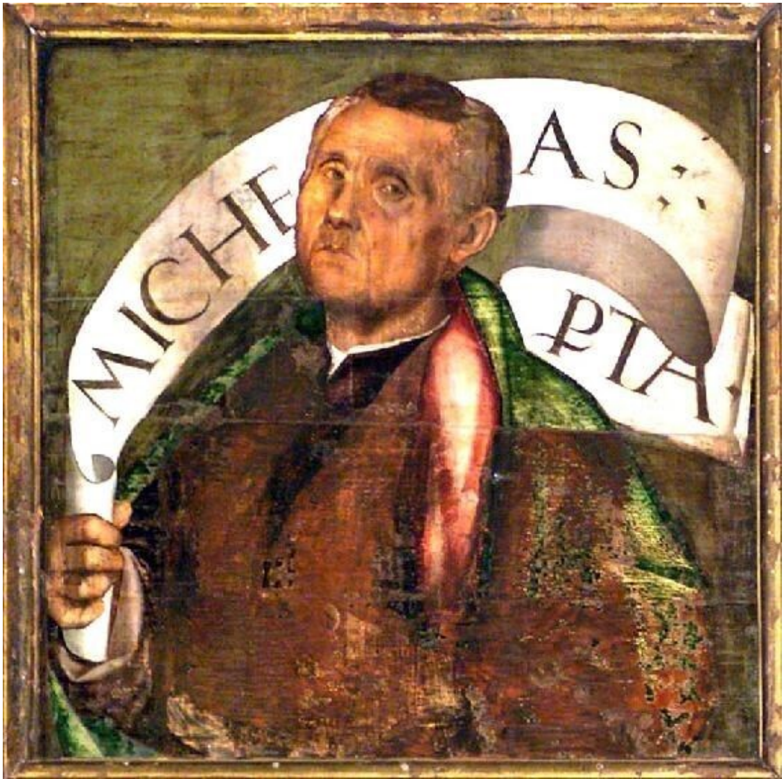
Profeta Miqueas, t mpera sobre tabla, escuela v neta, primer cuarto del siglo XVI.