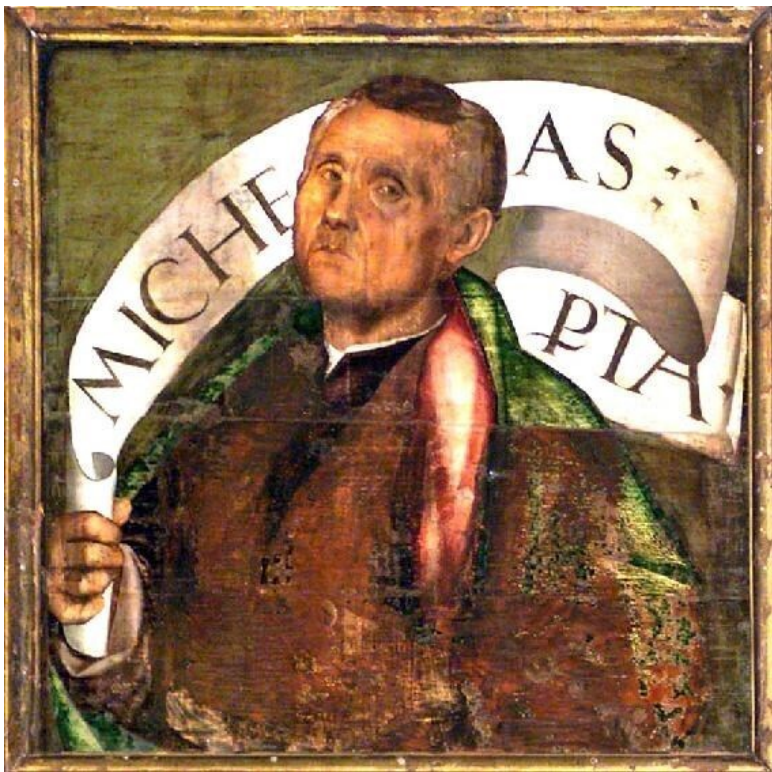
Profeta Miqueas, t mpera sobre tabla, escuela v neta, primer cuarto del siglo XVI.