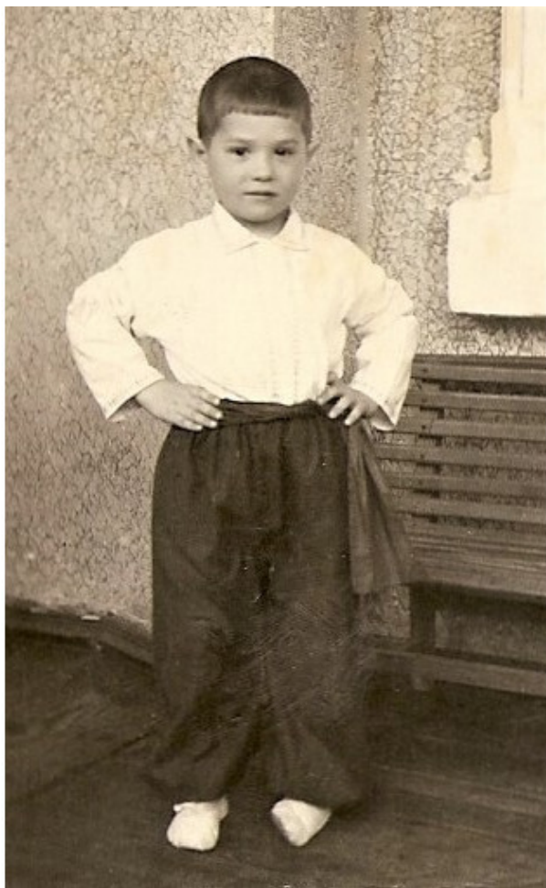
1953 год. В детском саду. В украинском наряде.