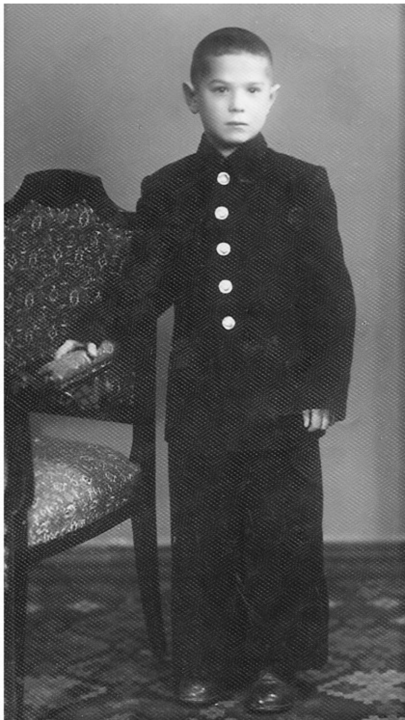
1956 год, Одесса. Первоклассник

Скандал перерос в личную трагедию молоденькой и невинной учительницы. Она была публично унижена, при всём классе моей необразованной и нездоровой бабушкой, обвинена во всех женских грехах и была вынуждена тут же уволиться. Больше я никогда её не видел, не знаю её судьбы. Совесть до сих пор мучает меня. Что могла сказать своим родителям любимая дочь в тот день, вернувшись посреди дня из школы в слезах и в истерике?! Для них это был конец света. Что она могла сказать, как объяснить?! Она любила детей. Настоящий педагог! Но разбитое не склеить. Всё равно получится разбитое. Это по моей вине расплатилась моя учительница своей профессиональной карьерой и психическим здоровьем! Каким она теперь станет педагогом? Кому она будет доверять? Напуганная и опозоренная. Я был причиной разбитой судьбы человека. Я дал моей бабушке повод, не представляя, какую лавину горя и стра-