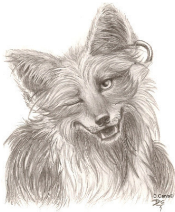
Улыбка (2008). Бумага, карандаш. 15 x 15 см