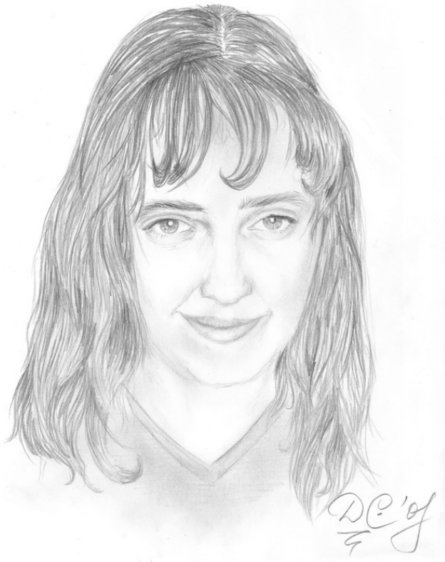
Мама (2008). Бумага, карандаш. 20 x 28 см