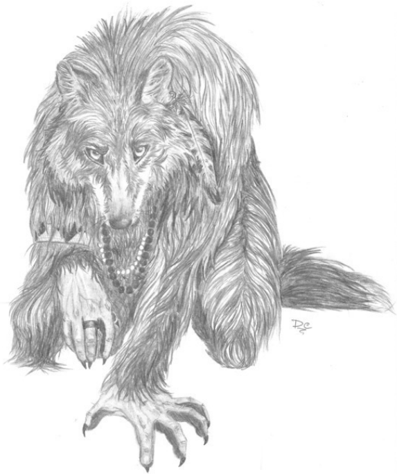
Териантроп (2008). Бумага, карандаш. 20 x 28 см