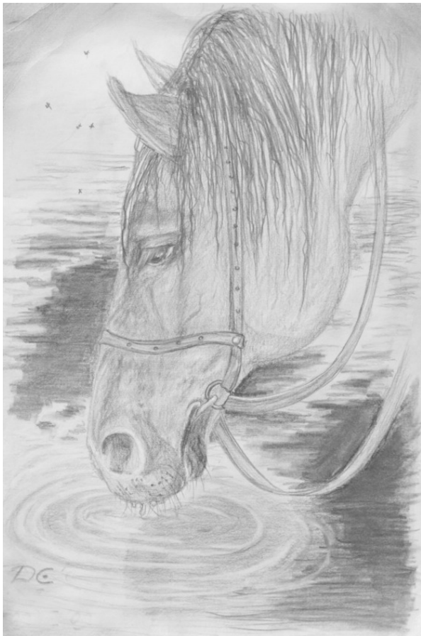
Жажда (2011). Бумага, карандаш, уголь. 28 x 42 см