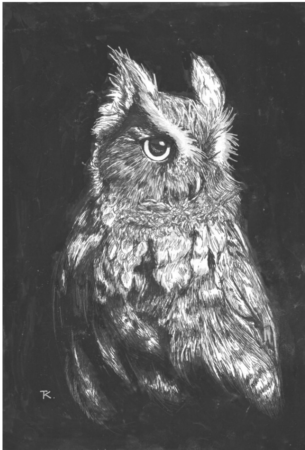
Сова (2006). Бумага, тушь. 16 x 18 см