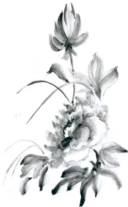
Пионы (2019). Бумага, тушь. 9,5 x 17 см