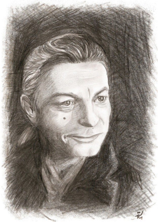
Отто Зандер (2007). Бумага, уголь, карандаш. 20 x 28 см