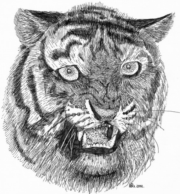
Страх (2002). Бумага, тушь. 16 x 18 см