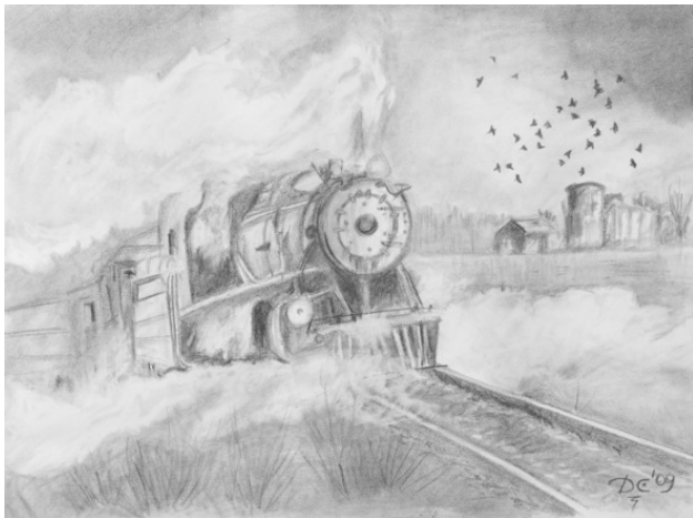
Скорость (2008). Бумага, карандаш. 29 x 42 см