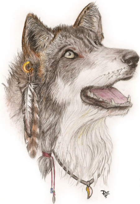
Вожак (2008). Бумага, цветные карандаши. 20 x 28 см