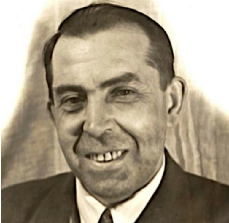
Петр Степанович Скулачев

Постановление ЦК КПСС и СМ СССР 1955-го года положило начало по сути разгрому архитектурного дела в СССР под видом экономии денег и направления их на строитель-